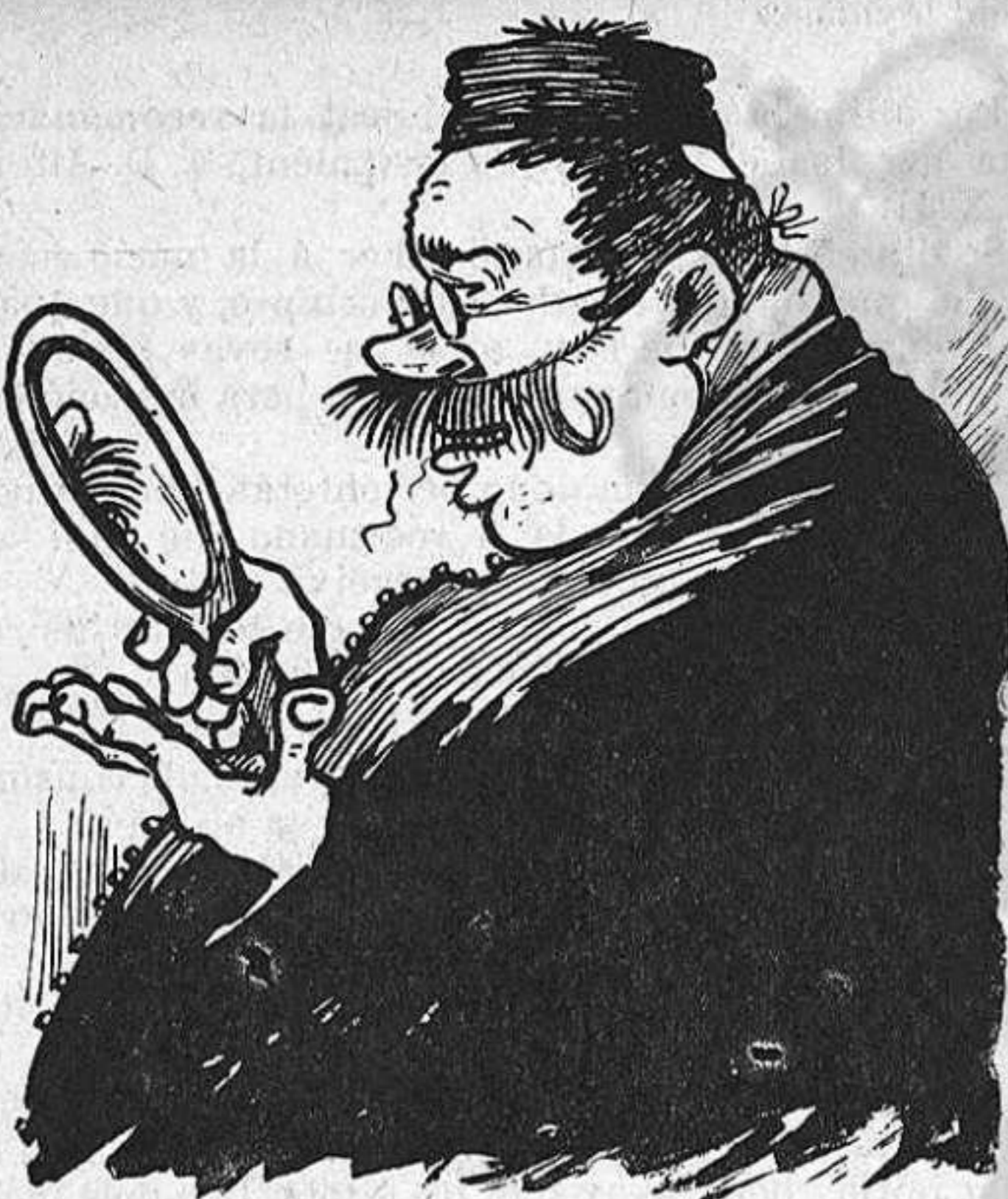
—Jo no tinc paciència: interinament me creix el natural, me 'n poso un de postís