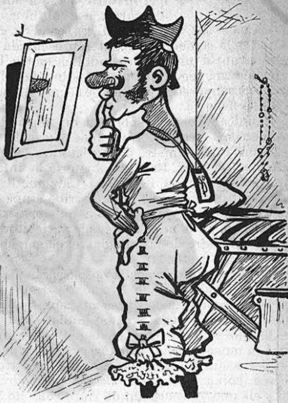
—Trobo que ab el bigoti no hi van bé las faldillas: hauré de posarme pantalóns.