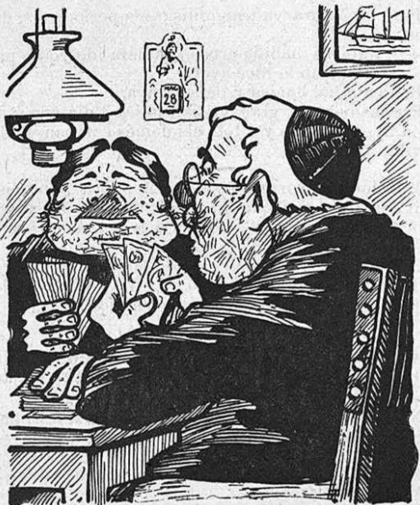
—Noya, ara sí qu' en qüestió de pèl a la cara, ja casi estém tants a tants.