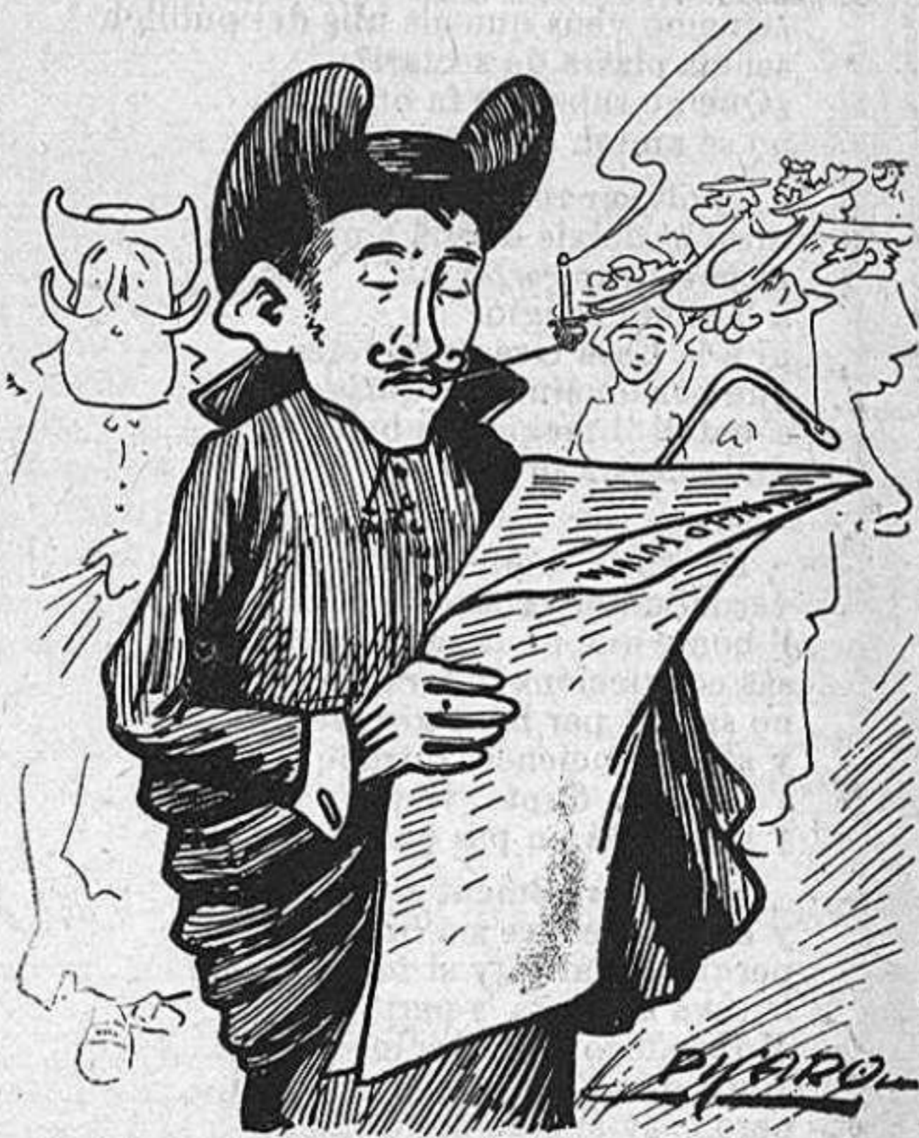
Un vicari de la primera volada.