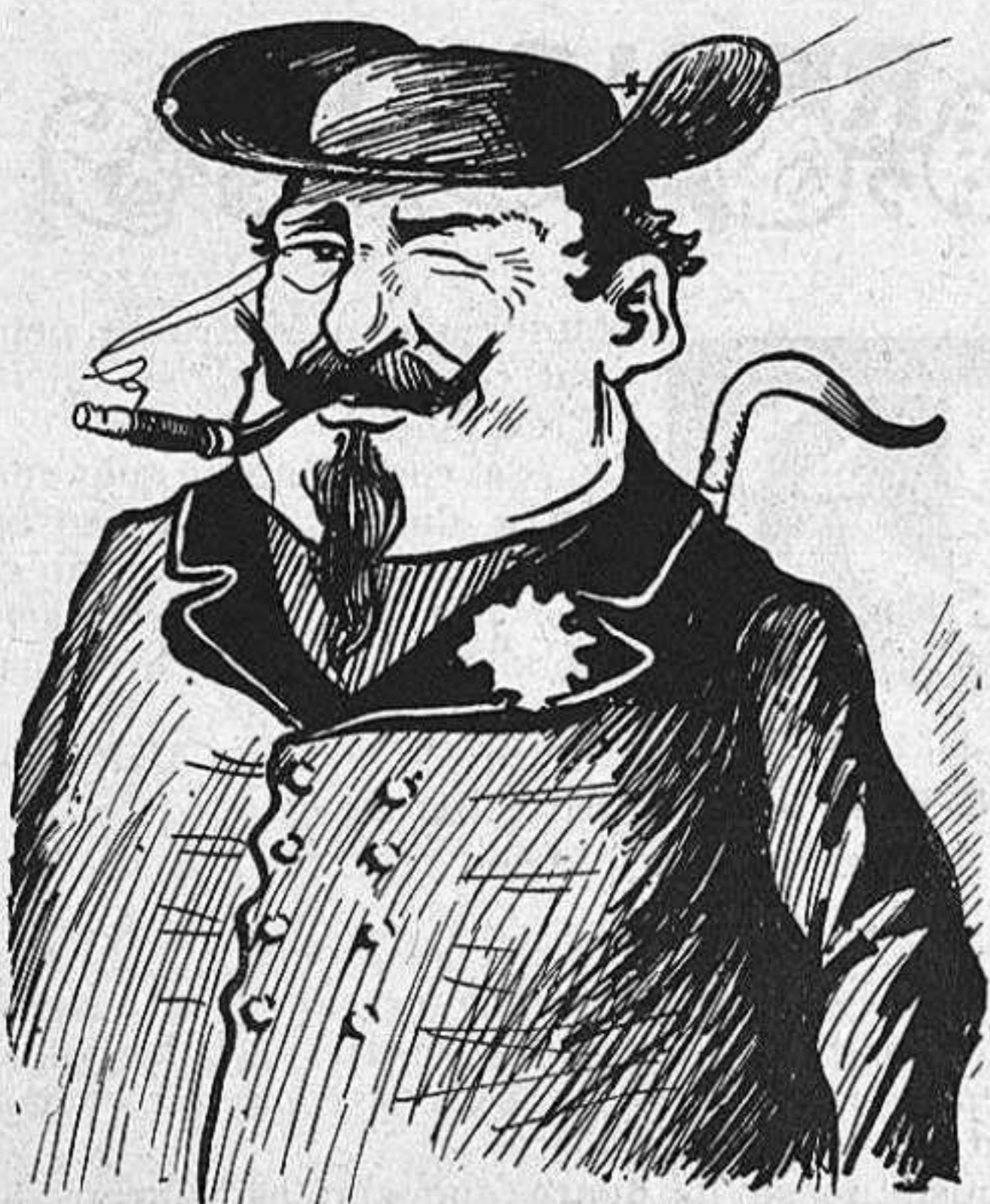
Capellà de carrabiners.