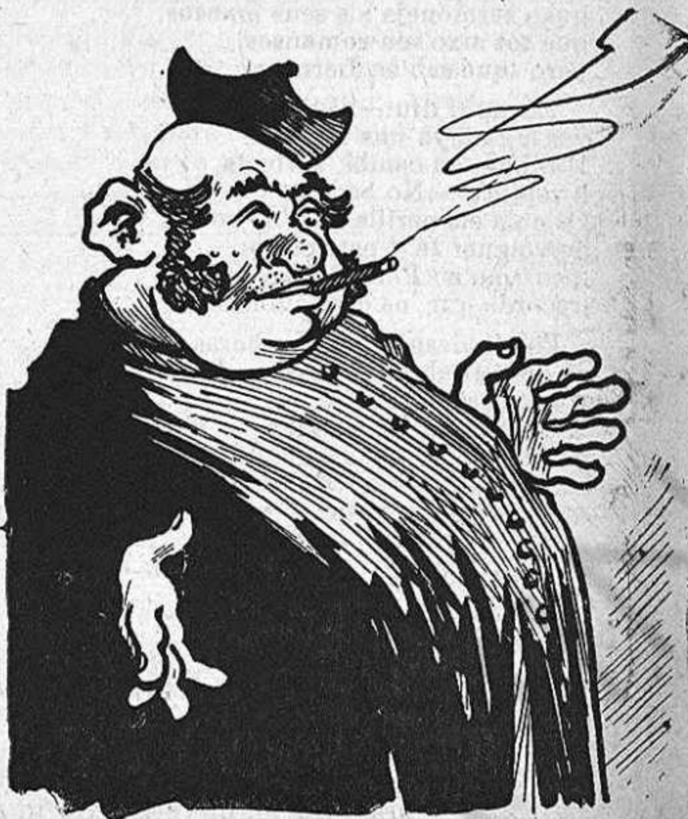
—¡Vaja! Que vingui l' Agujetas ara; que vingui el Badila...