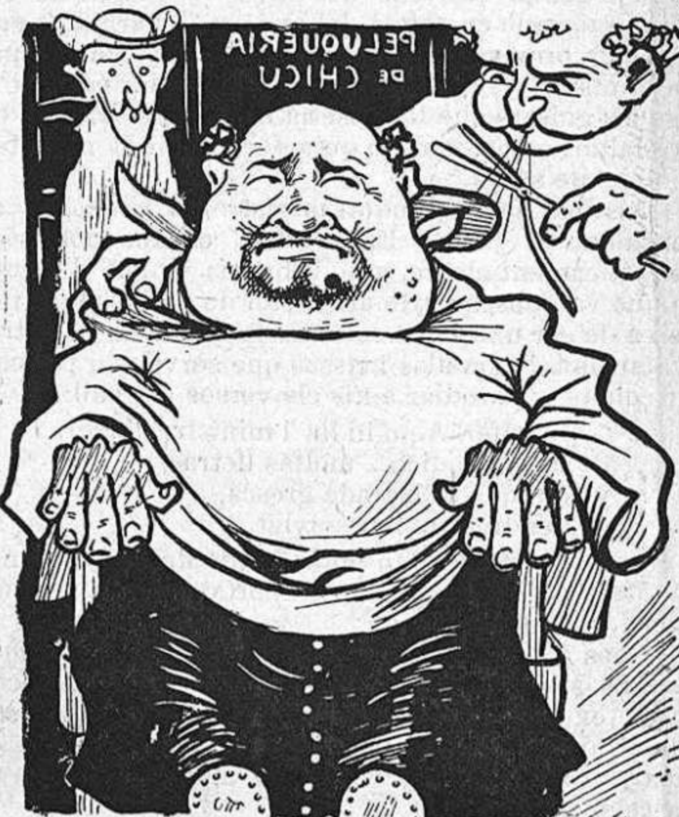
—Dónguimhi un cop de ferros, que avuy tenim un ofici dels grassos.

prén contra 'ls masóns, ni contra 'ls impiós, sino contra 'l govern de 'n Maura. Vegin vostés com se podia creure que 's girassin contra 'l seu protector.