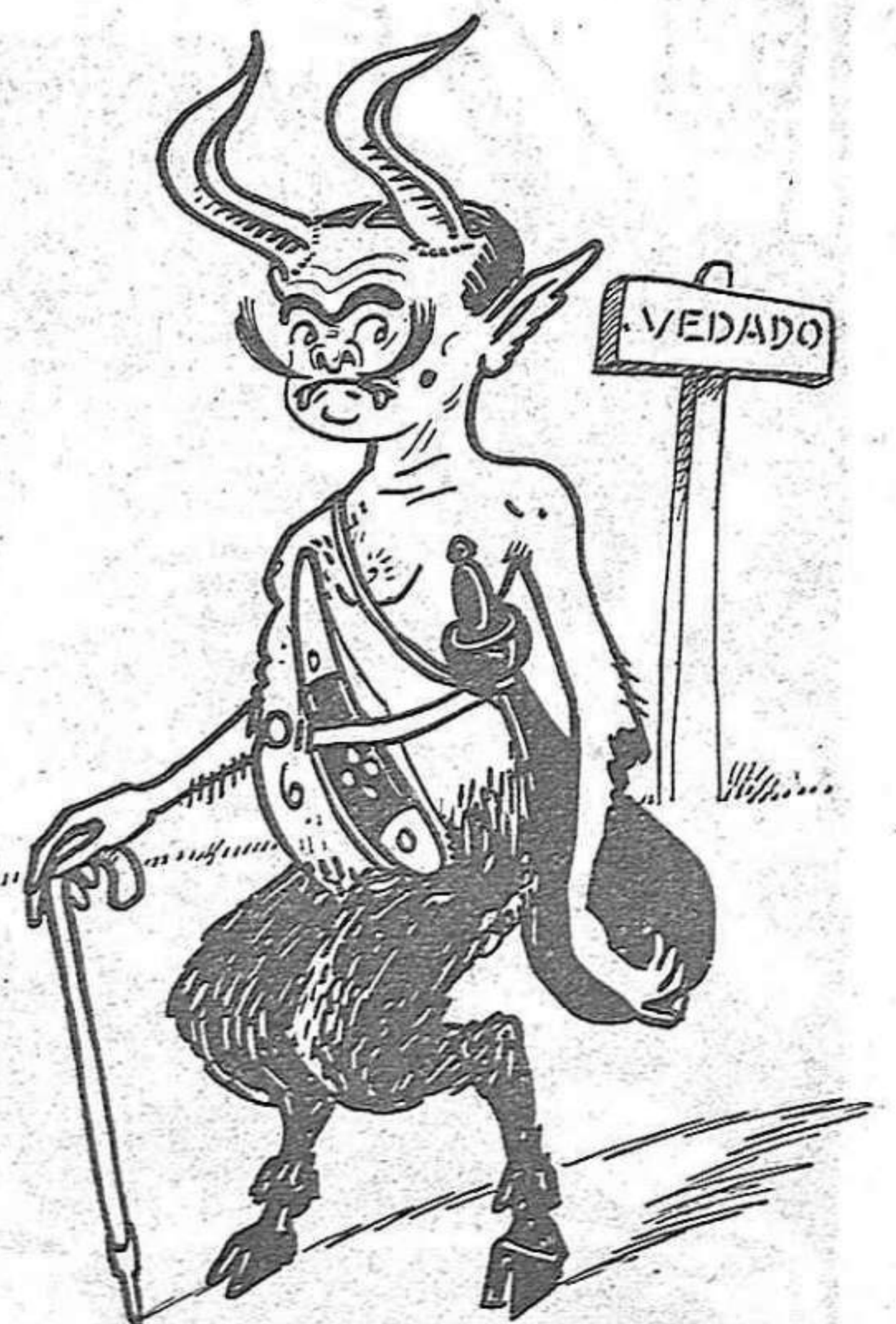
El bisnét de l'Hèroe