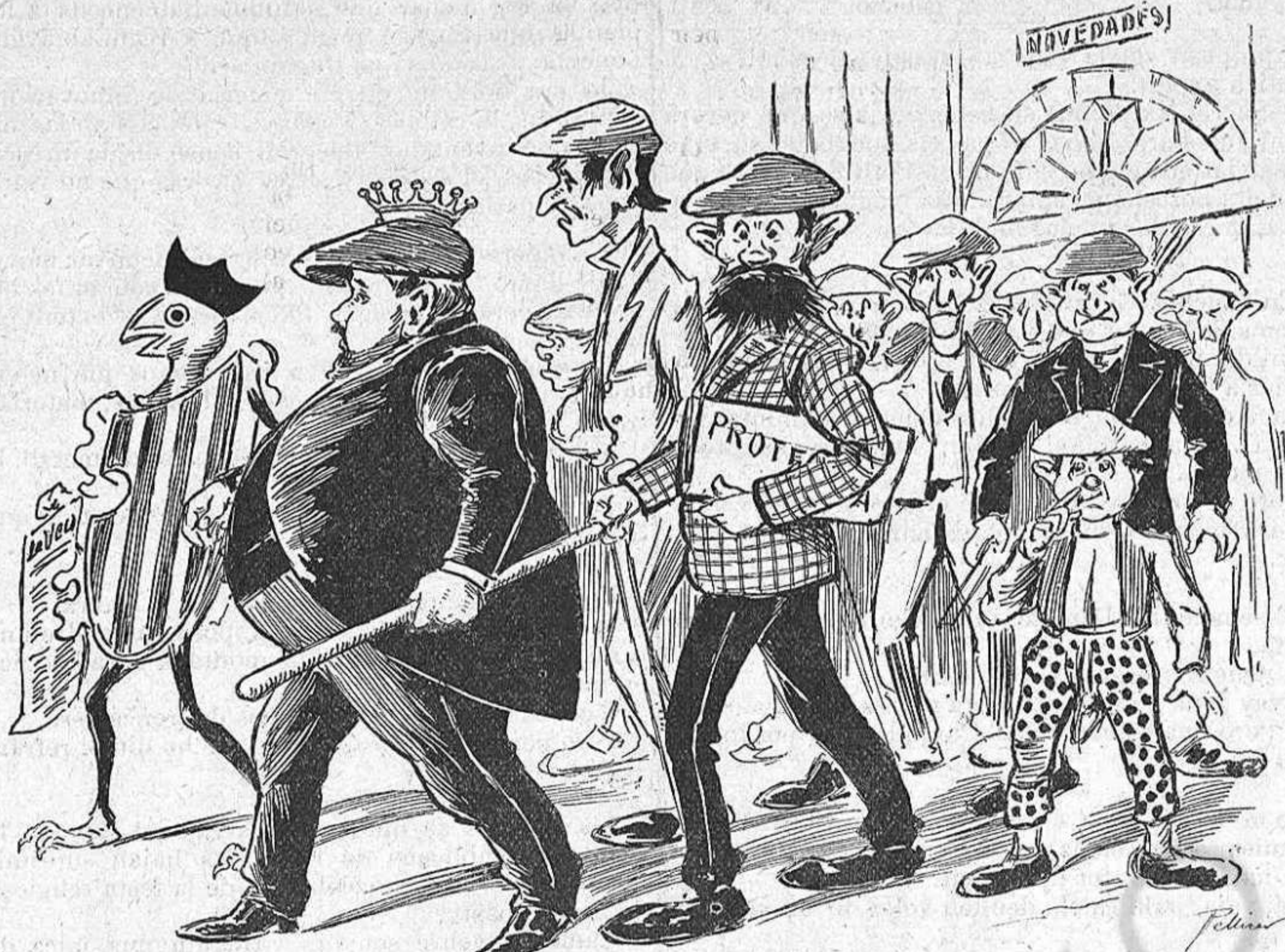
Després d' haverse esbravat armant un xich de cridoria, se n van entorná al corral... y aquí pau y després gloria.

de fer un discurs furibundo, pujá al cubell y s' desféu en impropis contra la gent liberal y las escolas laicas, sermó guerrero mes propi d' un carrabiner que d' un anomenat ministre de Deu. No s' capíqui ni s' encaparrí; l' Escola Laica anirá endavant, y al revés de vosté y dels seus galifardeus procurarà la verdadera instrucció del poble y la germanó dels que veen instruirse y dignificarse.