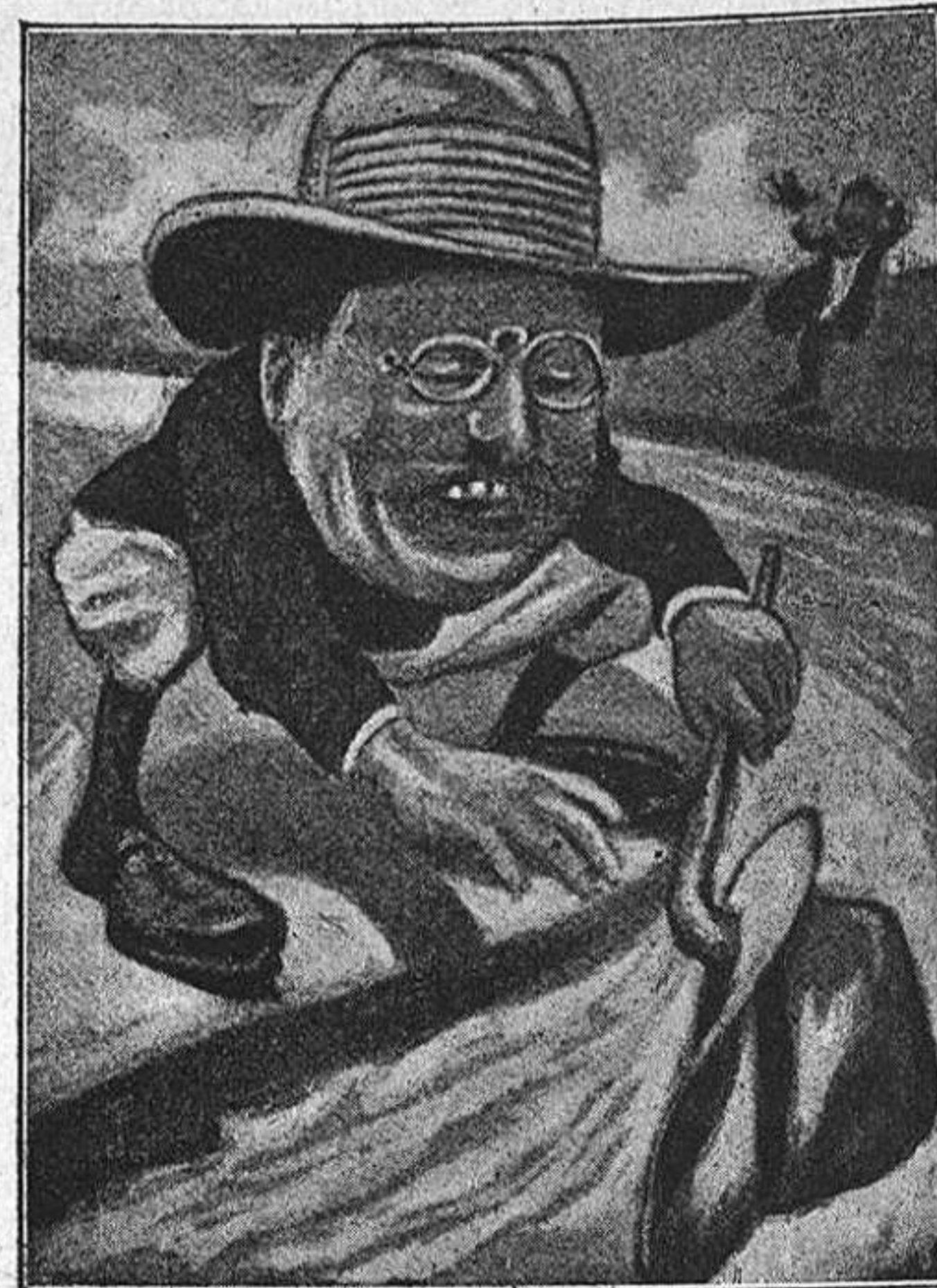
COLOMBIA:—¡Ay que 'm fuig el meu Panamá! L' ONCLE SAM:—No t' amohinis: ja 'l he pescat.