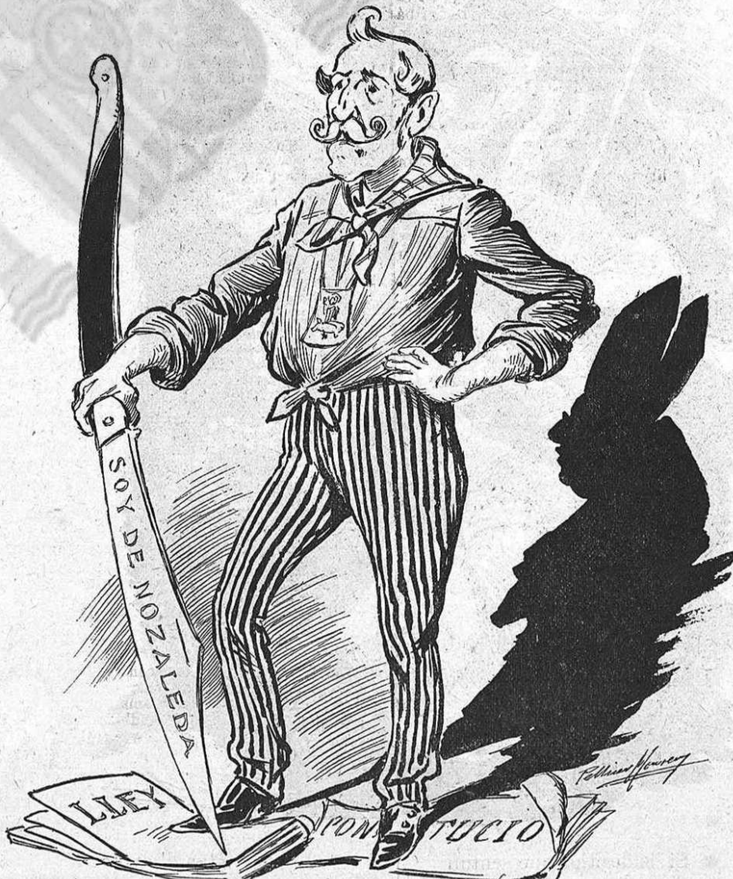
—El que vulgui alguna cosa, que surti.