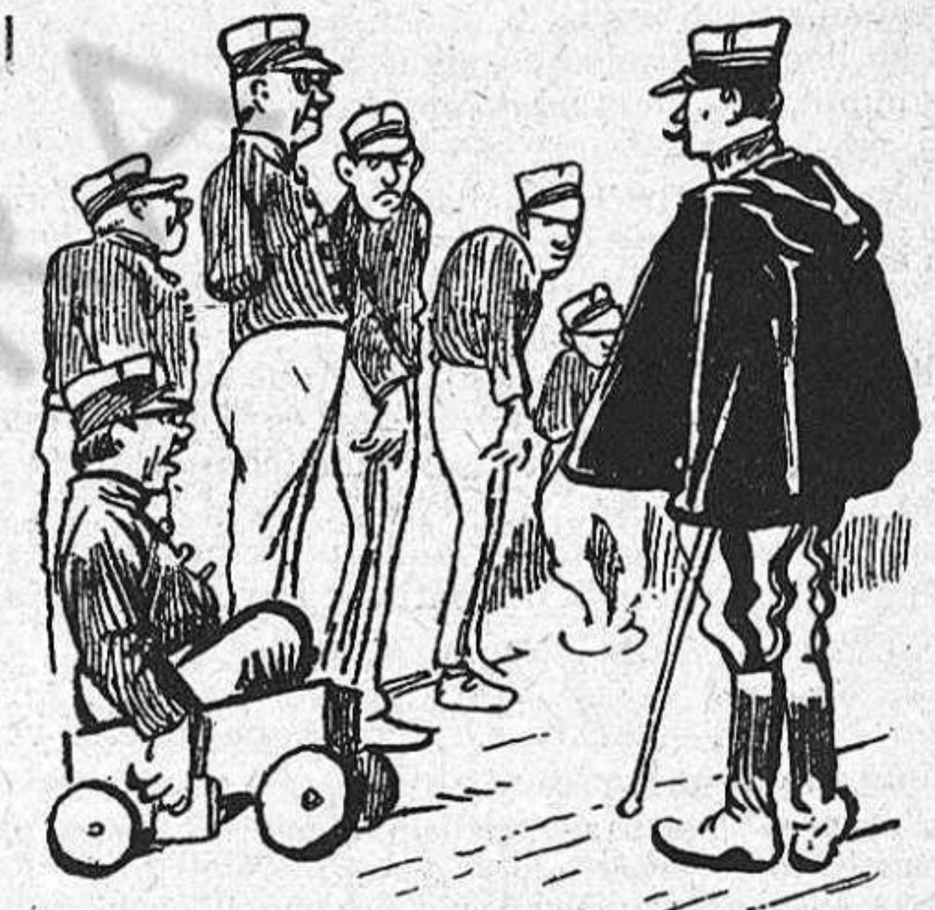
Per lo que serveix l' exércit, valdría mes que per formarlo reclutessin a n' aquests pobres inútils, qu' están impossibilitats per guanyarse la vida.