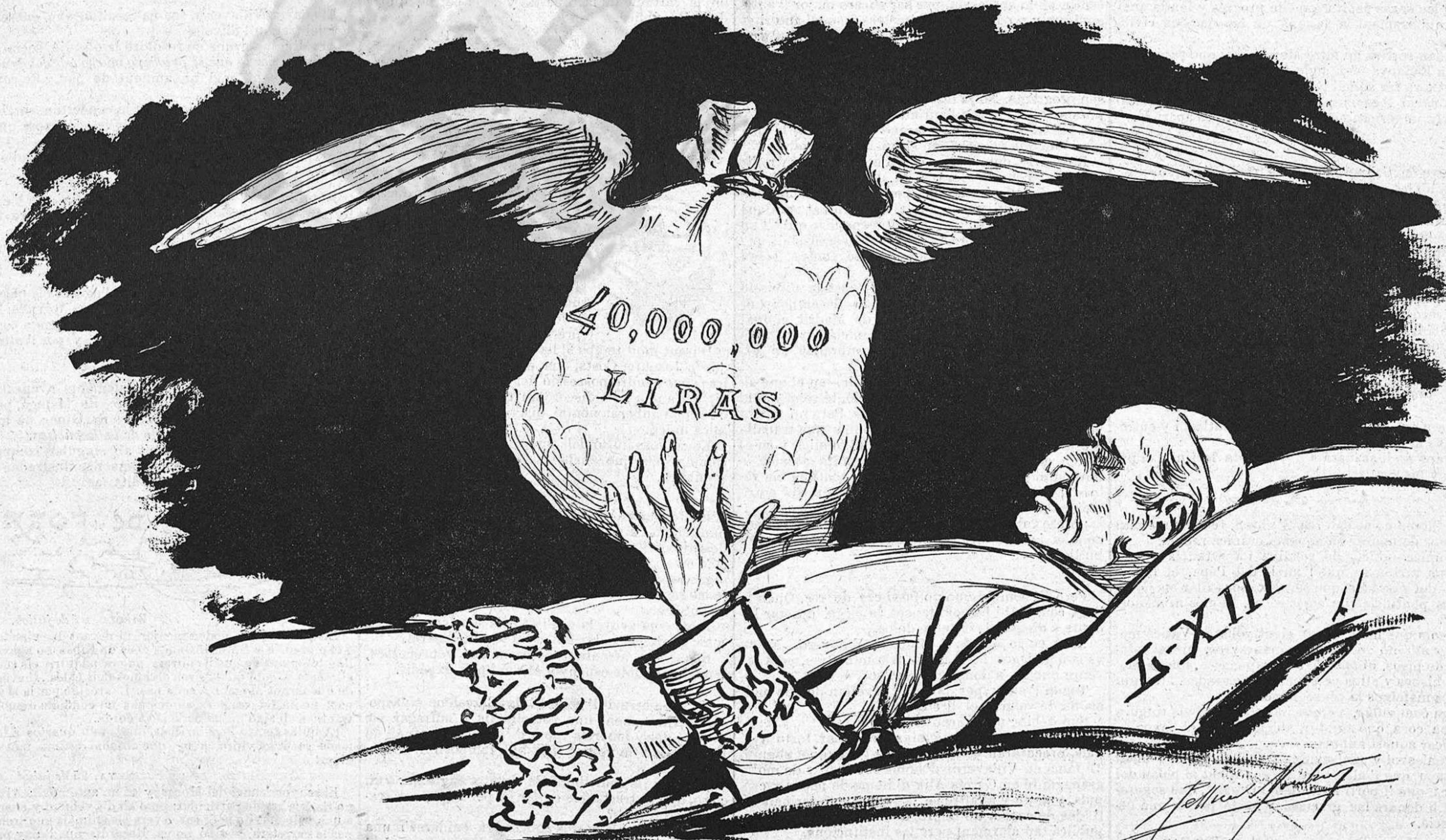
.....Y l' ánima se 'n va pujar al cel!...