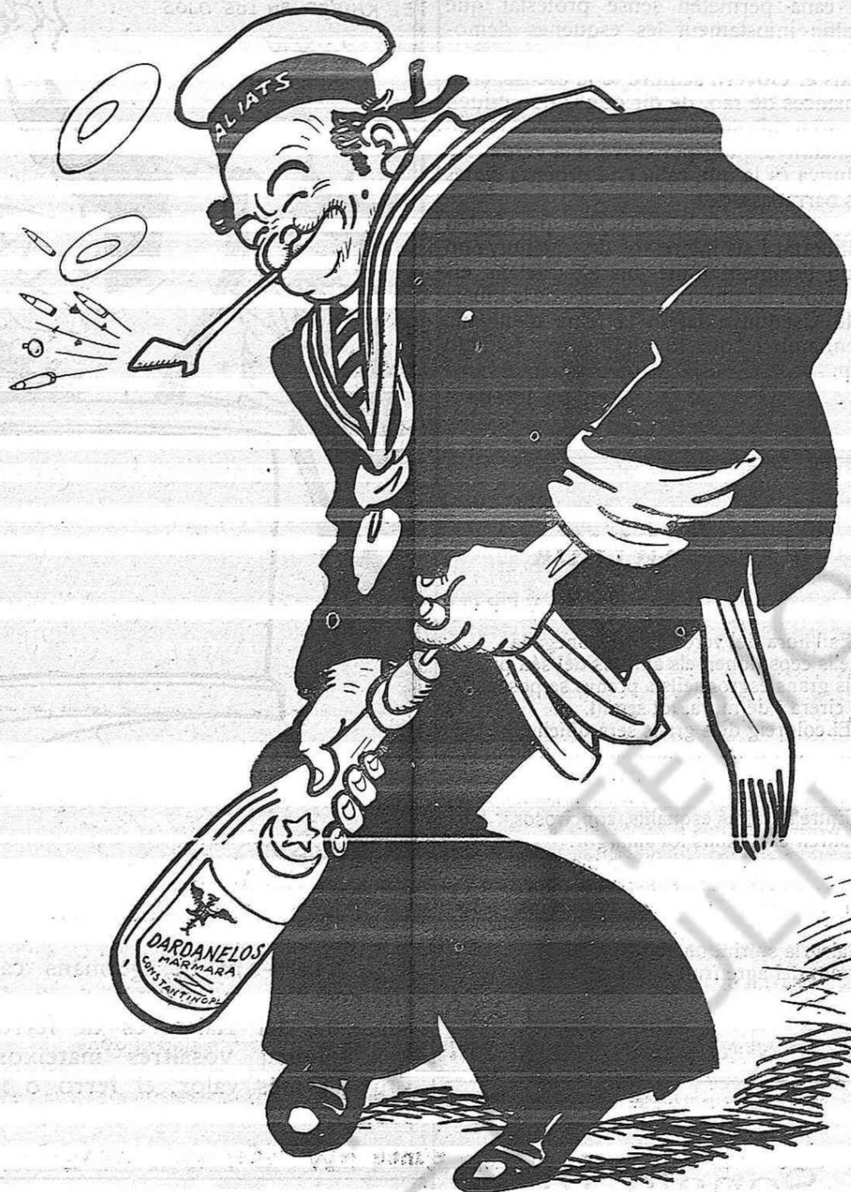
—Redeu, quin tap!... Mai hauria dit que costés tant de sortir.