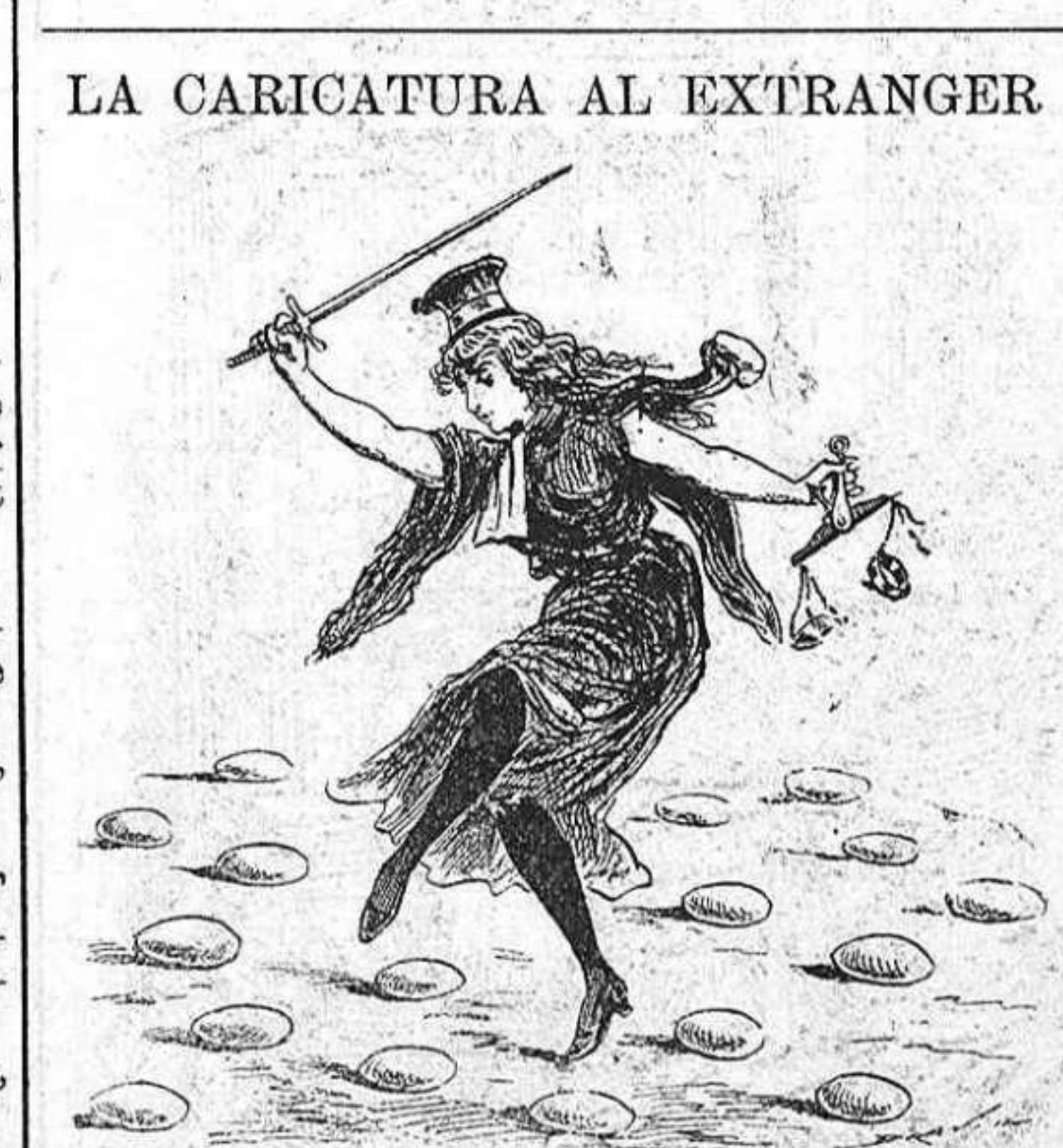
La danza dels ous ó la Justicia en el procés dels Humbert.