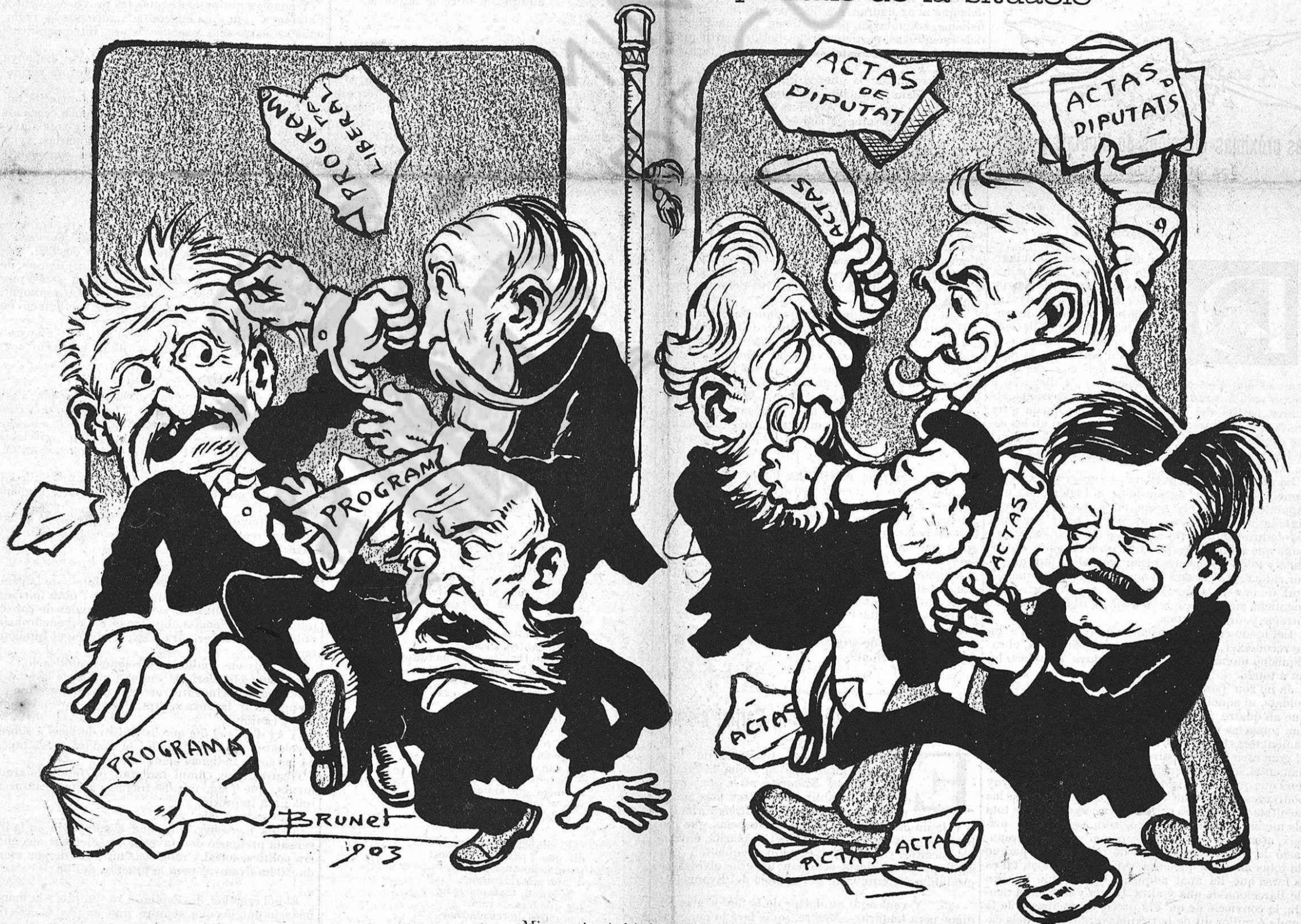
¡Mireu si n' hi ha d' armonia al camp de la monarquial...

La gent del torn «pacífich» ó 'ls puntals de la situació