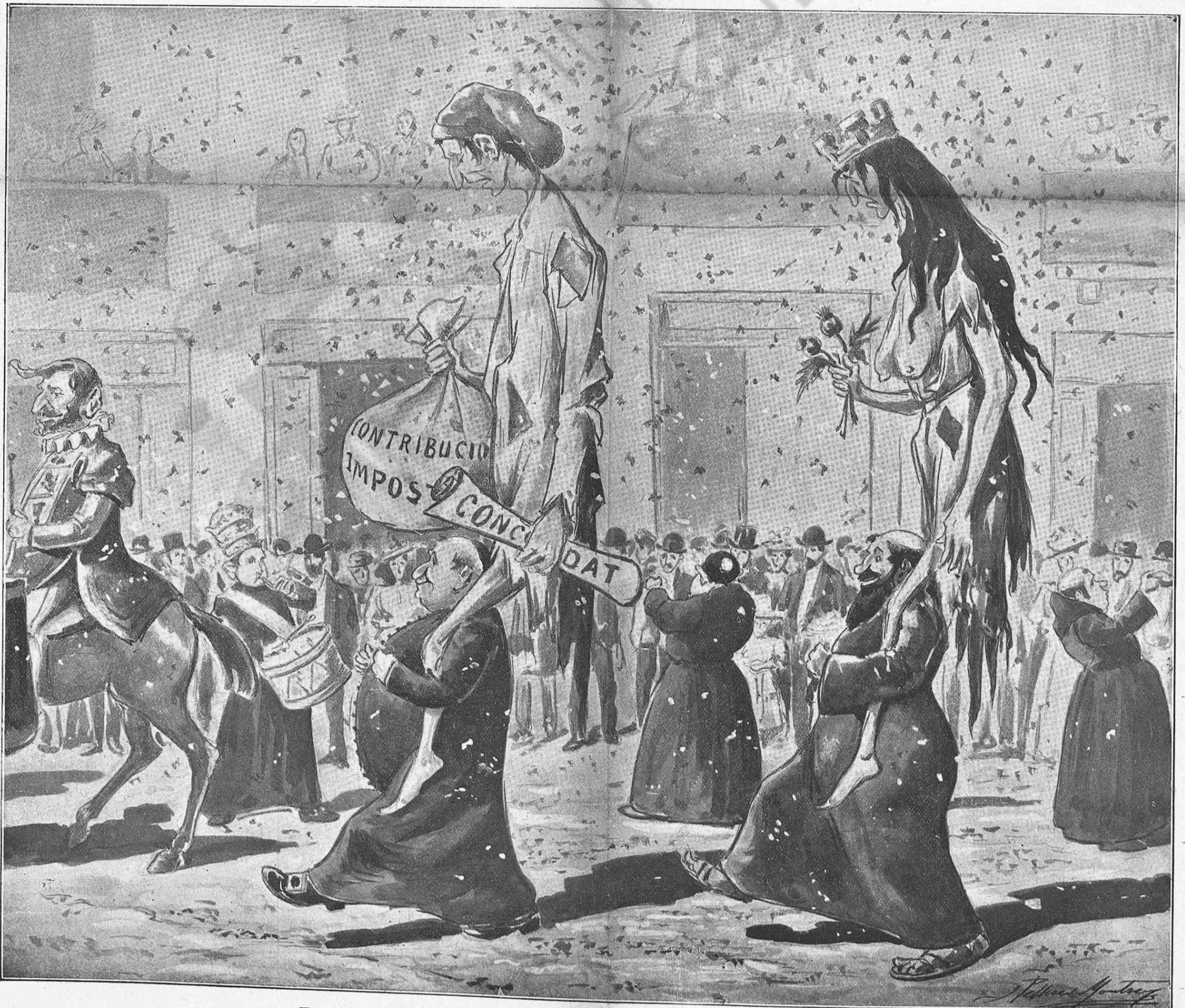
En virtut dels jochs de mans de comparses y comares.