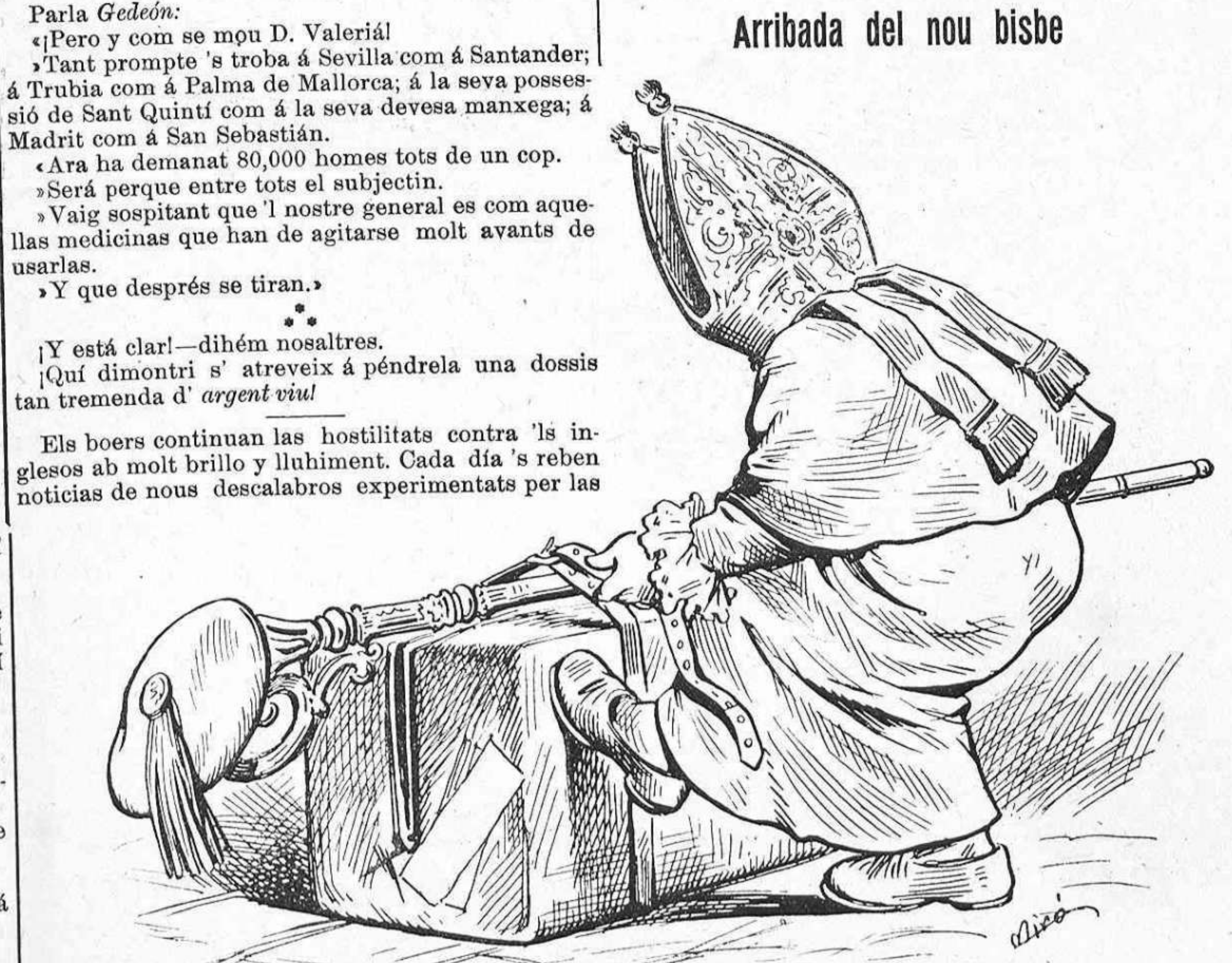
—Desembalém las eynas y posemnos á cultivar la vinya... del Senyor.