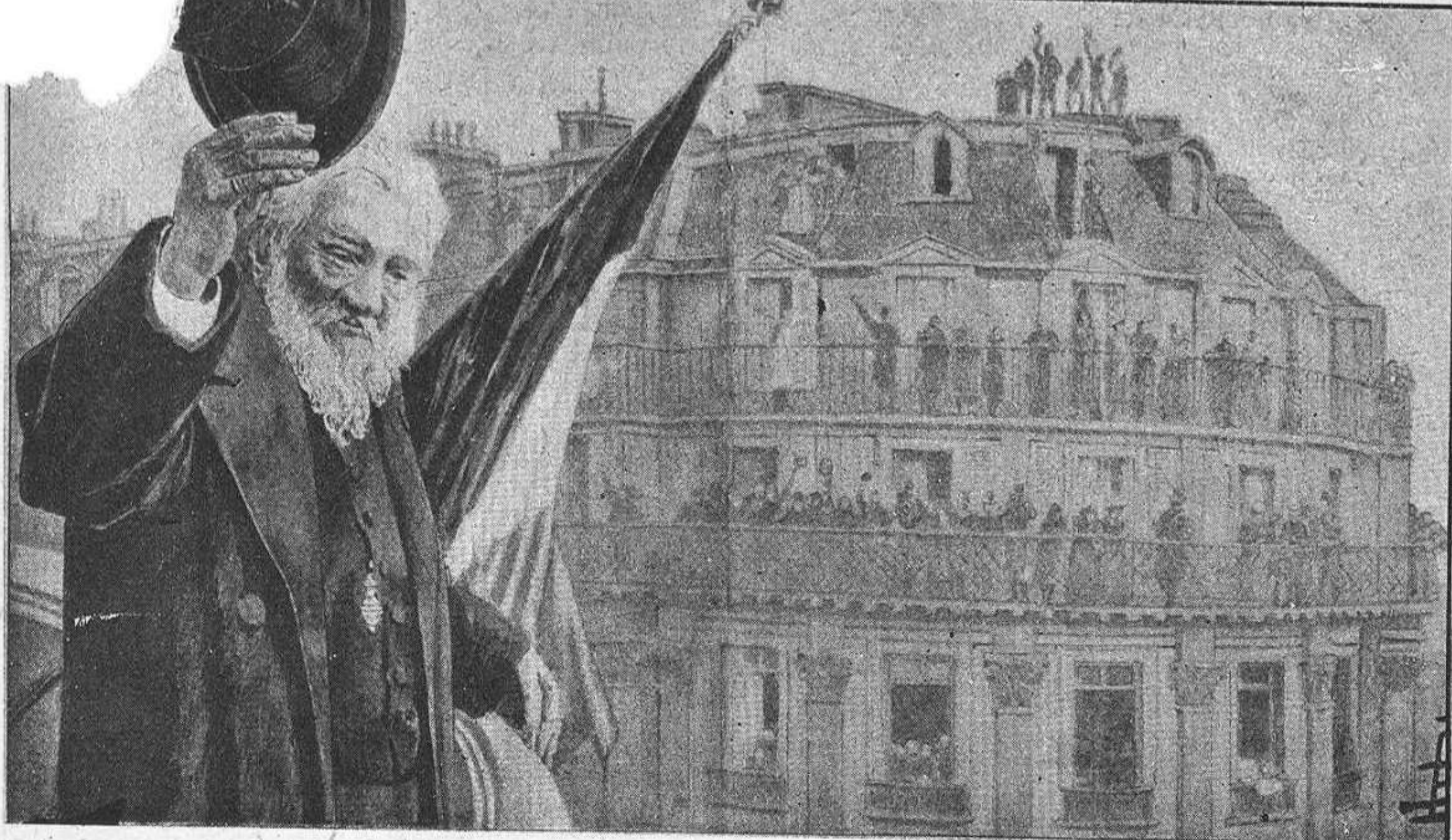
Krüger desde 'l balcó del hôtel Scribe, á París, saluda á la multitud que l' aclama.