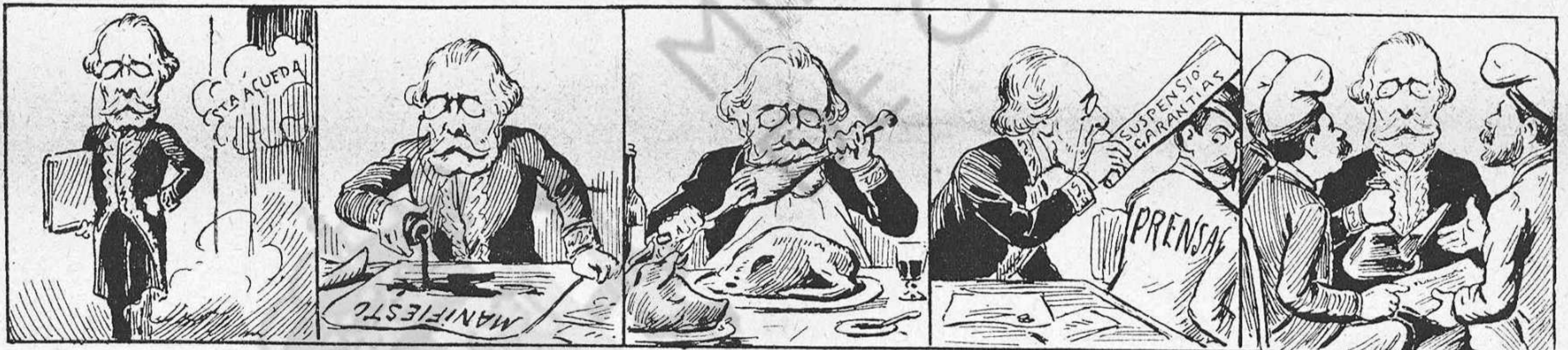
Suena un tiro y lo hacen presidente del Ministerio.