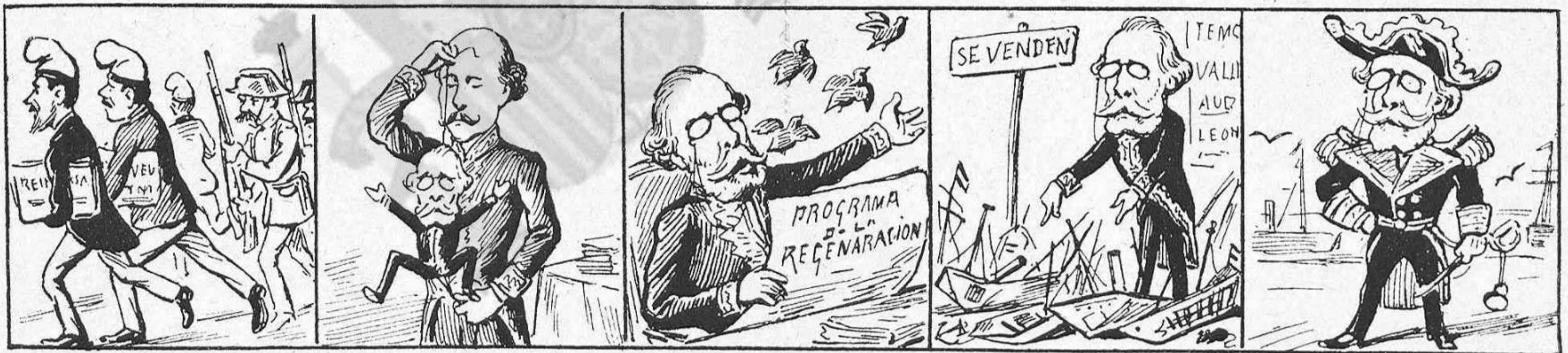
Otro día les levanta el Cristo.