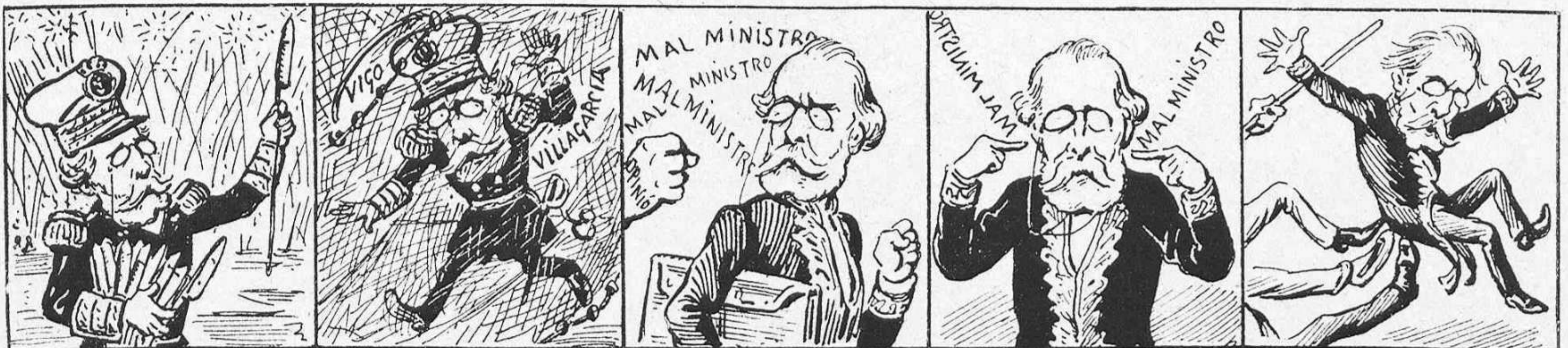
Todo se lo gasta en cohetes.