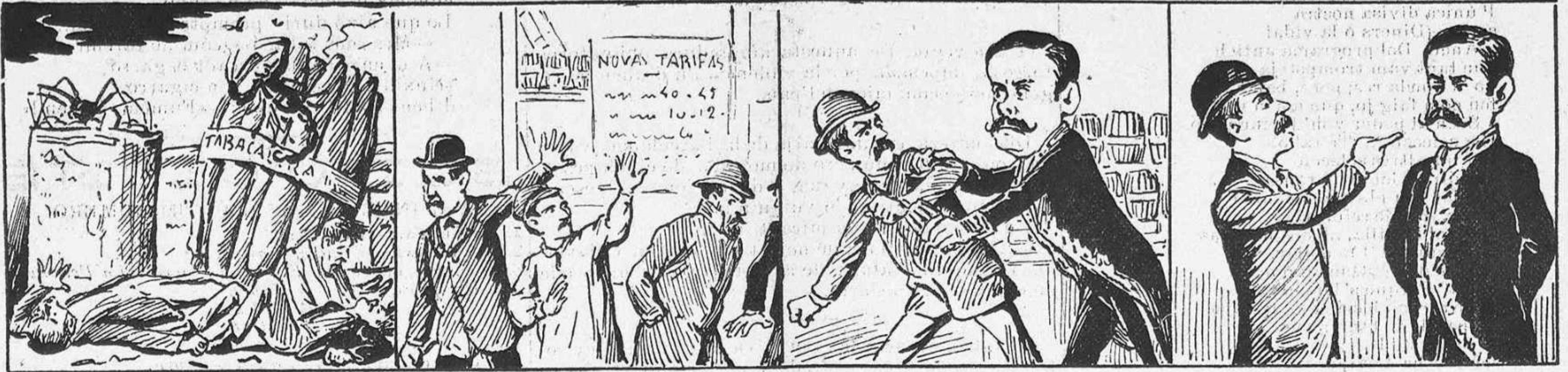
El tabaco era dolent y matava molta gent.