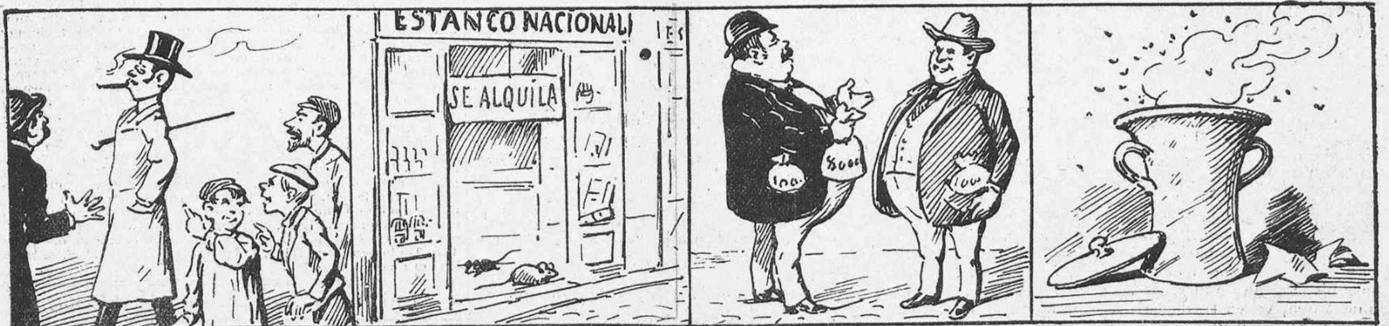
Un fumador d'aquí un any vindrá á ser un tipo extrany.