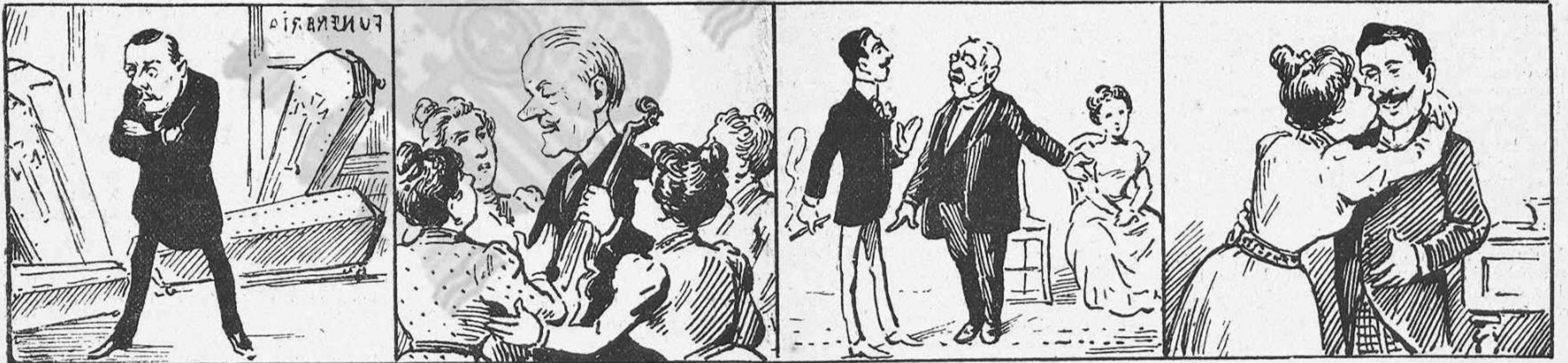
Els venedors d'atahuts ¡que se 'n veuhen de perduts!