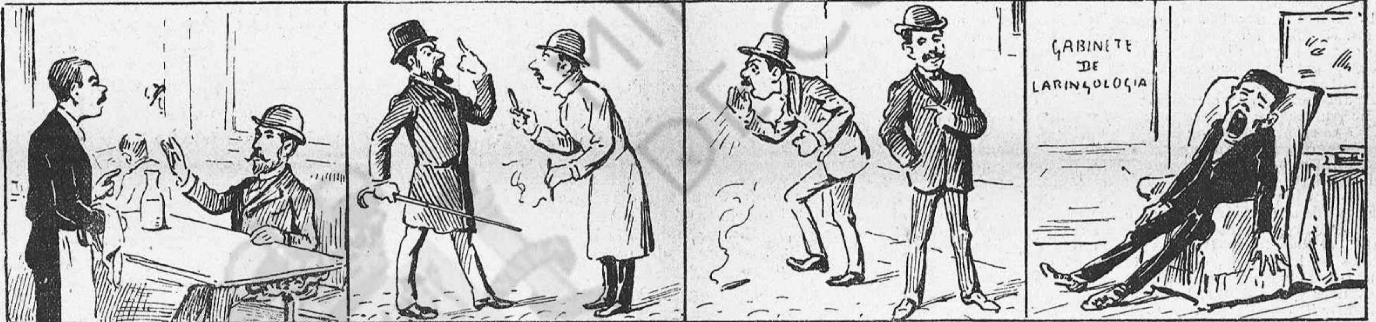
—Café y copa... y ja m' aturo: desde avuy no 'm portis puro.