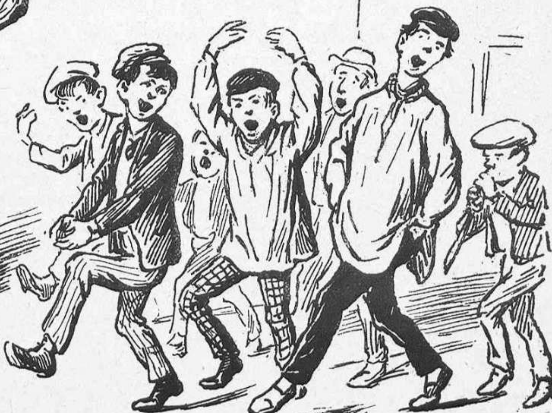
«Diu que anirém tan bé—que 'l diari ho porta—que la reyna vé.