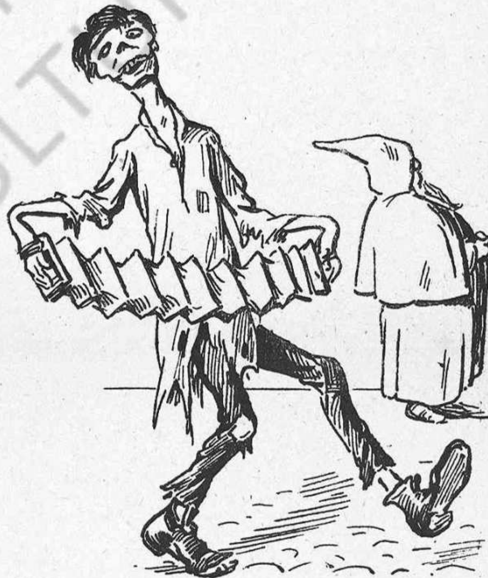
Una disfressa de contribuent.