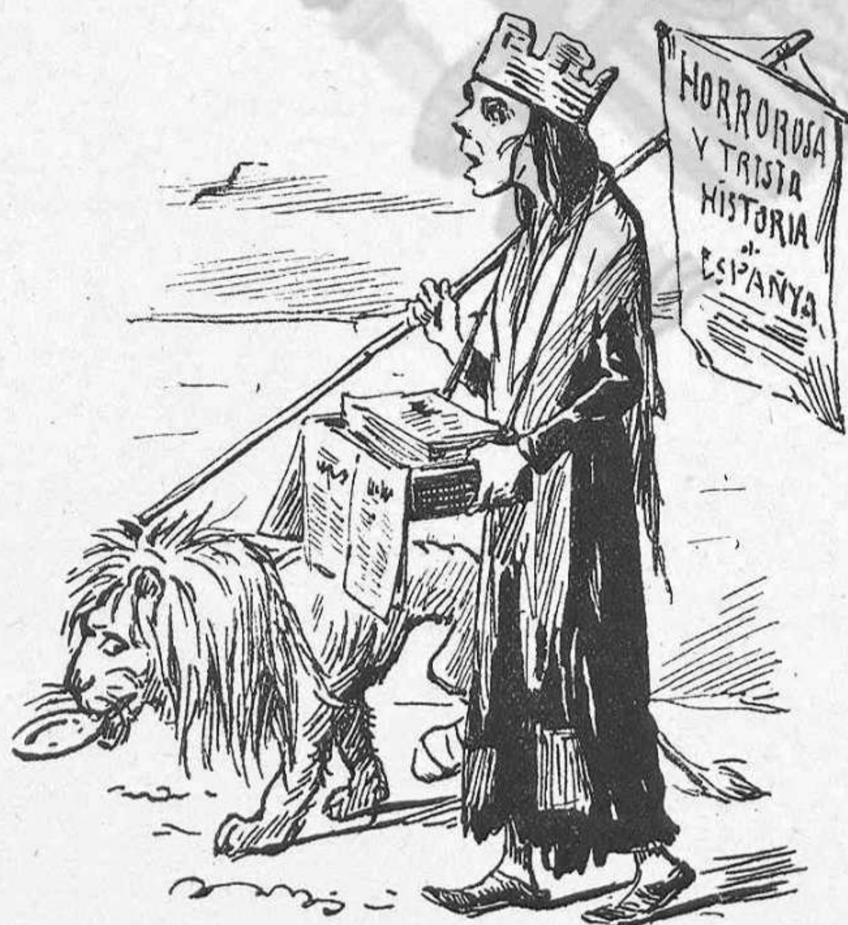
—Espanya vá disfressada. —De qué? —De regenerada.