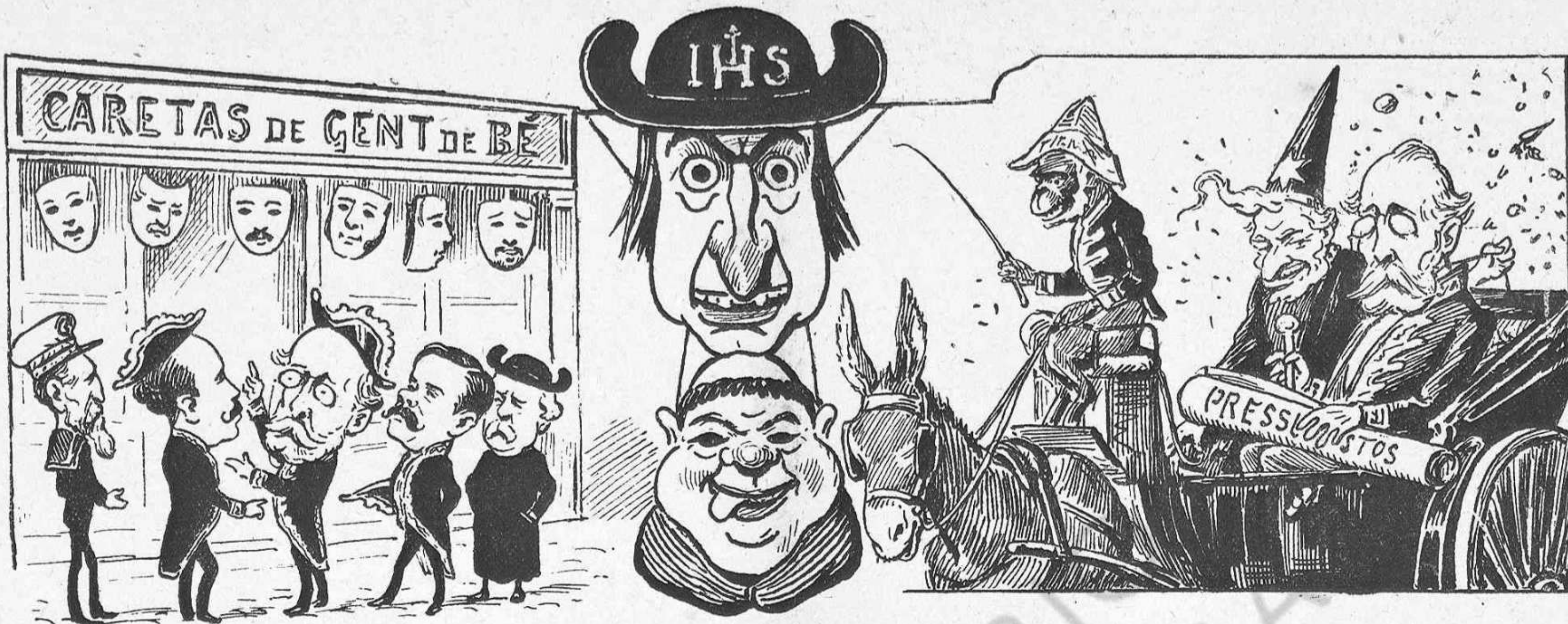
—Entrém á comprarne y no 'ns coneixerá ningú. | Caretas á la moda del día. |