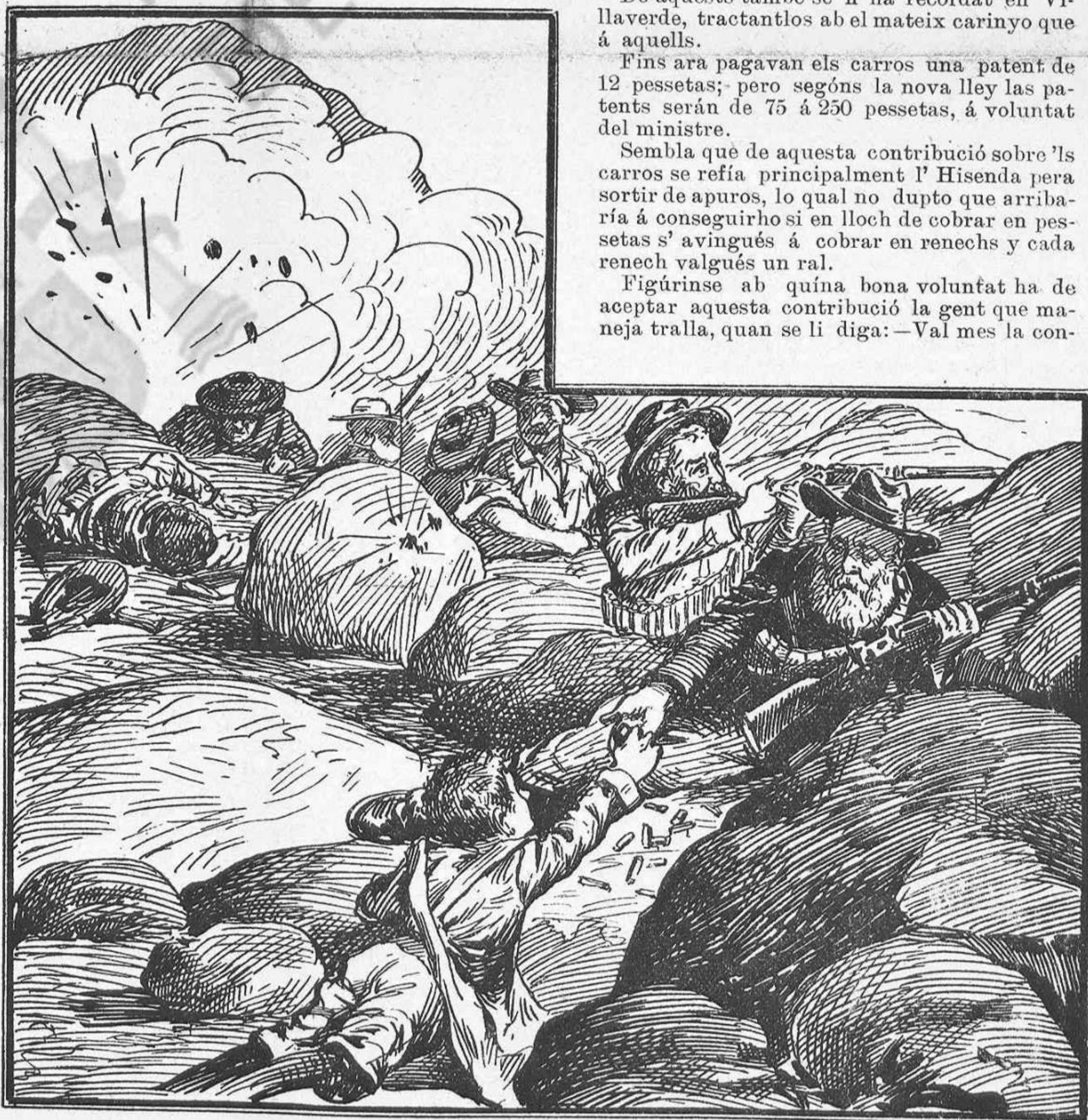
Els boers á las trincheras: els fills ajudant als pares.

Figúrinse ab quina bona voluntat ha de acceptar aquesta contribució la gent que maneja tralla, quan se li diga:—Val mes la con-