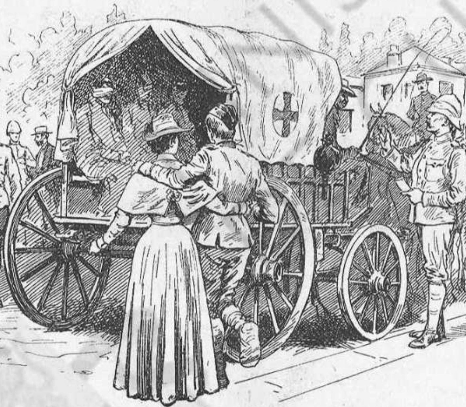
Ambulancia assistint als ferits de l' últim desastre.