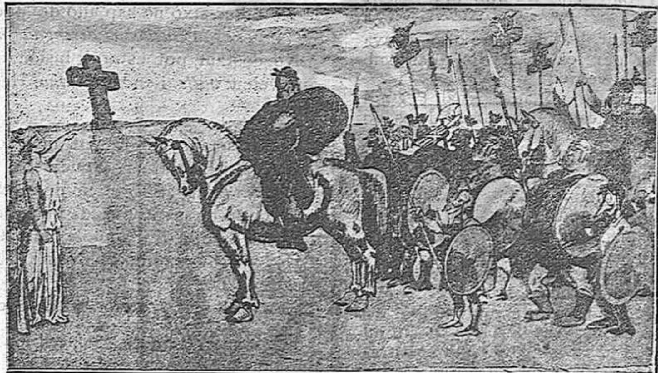
Dibuix de Pasquino (Turín).

Heu's aquí que Atila cavalca acompanyat de les seves hordes, planes enllà. No naixerà més l'herba per on hagi passat l'home vil, el freturós de poder, l'assassí d'ofici. No reviuran les viles i ciutats rera