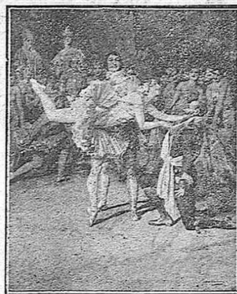
La Pavlova en la revista del «Covent Garden» de Londres.

Els espanyols es queixen de que se'ls cregui al estranger una gent tan pintoresca i ridícula. Però, inconscientment, no fan més que fomentar l'espanyolada. El dia que la península ibèrica tingui menys color local, menys ambient i menys caràcter, i més fàbriques, més escoles i més biblioteques públiques, a l'estranger ja no faran més espanyolades, ja no en podran fer més.