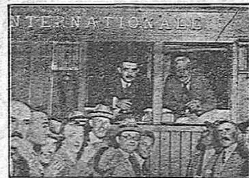
L'Herriot i en Macdonald a l'arribar a París

Però les dones i els infants alemanys!..