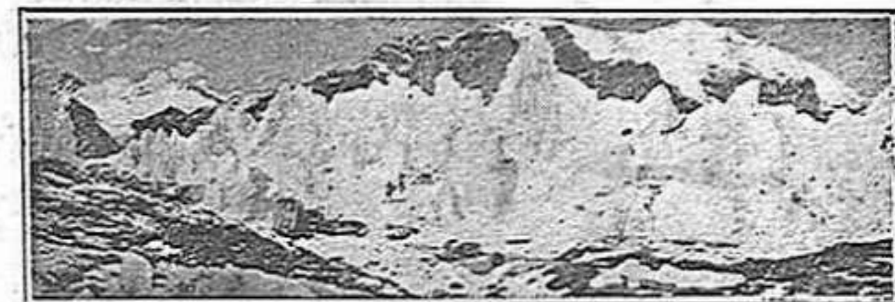
El mont Eoerest.

guem també inexplorades, ja que són raríssim els estrangers que hi han pujat, que s'han atrevit a pujar-hi. Ara s'han atrevit uns anglesos. Aquests anglesos són els reis!