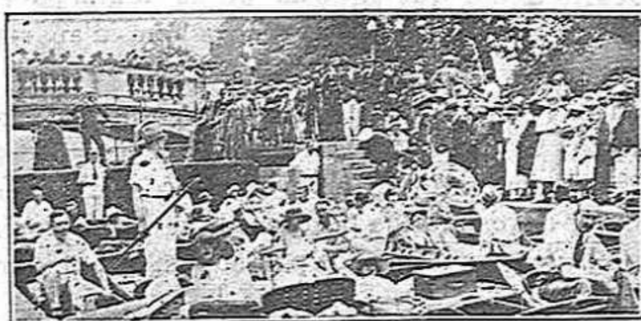
Les regates de Brighton.

Crec que tots estarem conformes en que s'ha de fer de la vida una cosa bella, fàcil, elegant, amable. L'eforç de tot individu de temperament i esperit normals ha de tendir an això, an aquest embelliment de la vida que aquí es preconitza, ja que és lletja i antipàtica i miserable de sí. Oblidem-nos doncs avui dels tristíssims problemes obrers, de la llastimosa qüestió del Marroc