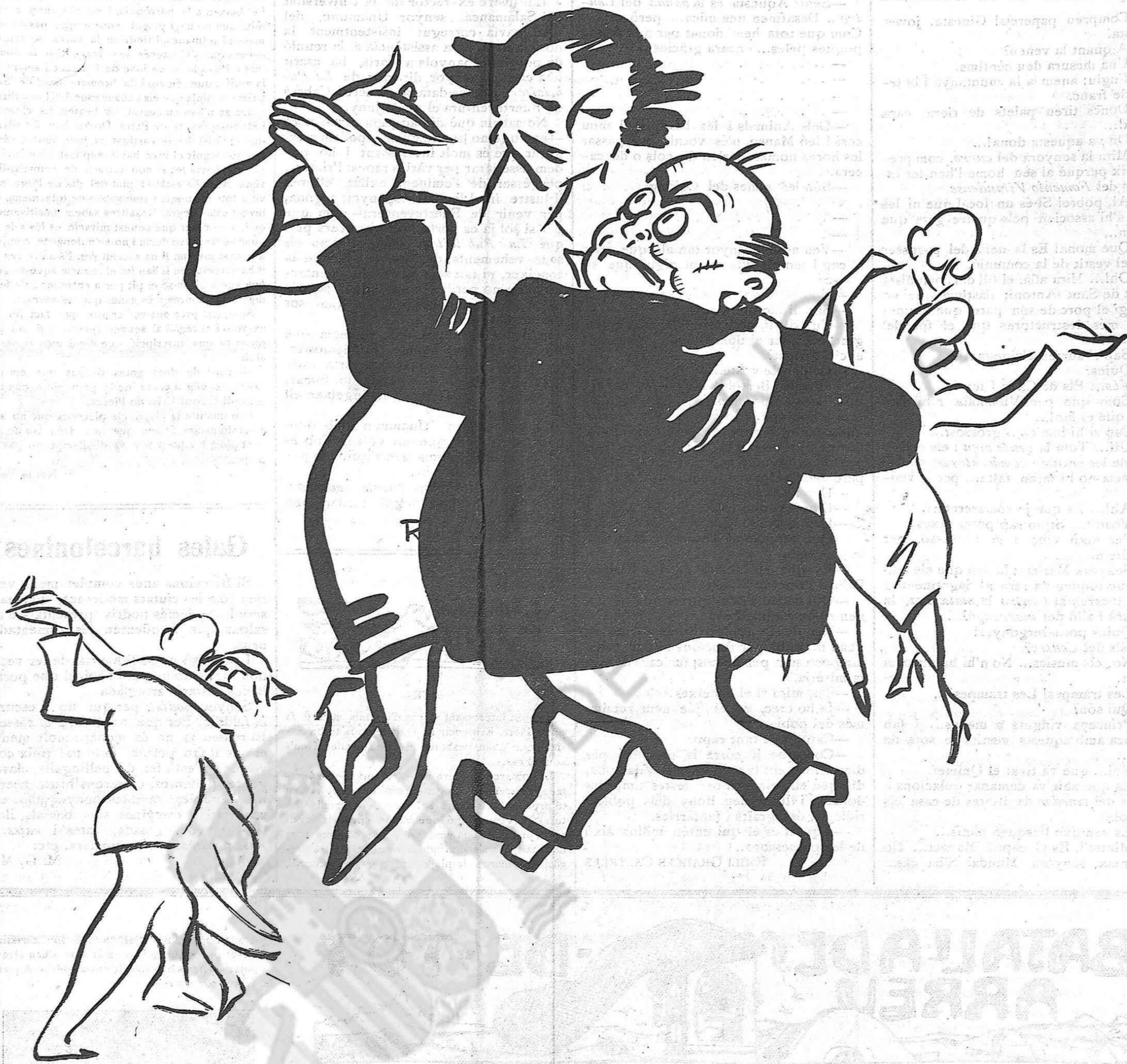
—Sembla que En Mussolini la balla!