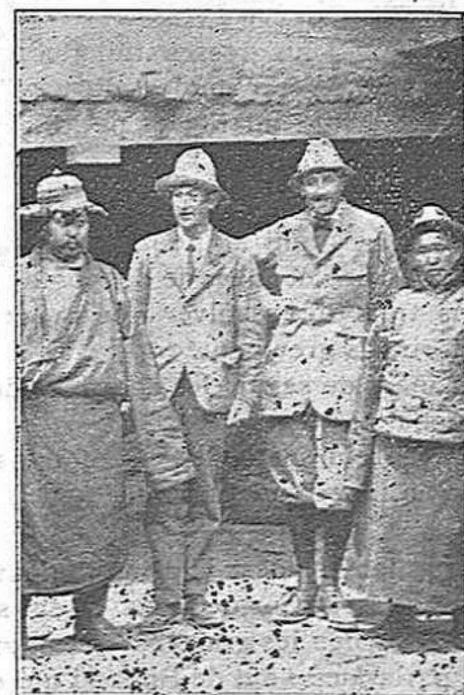
El governador del Tibet.

Són capaços de colonitzar la muntanya aquesta i endur-se'n la neu a Londres per a fer-ne mantecados !