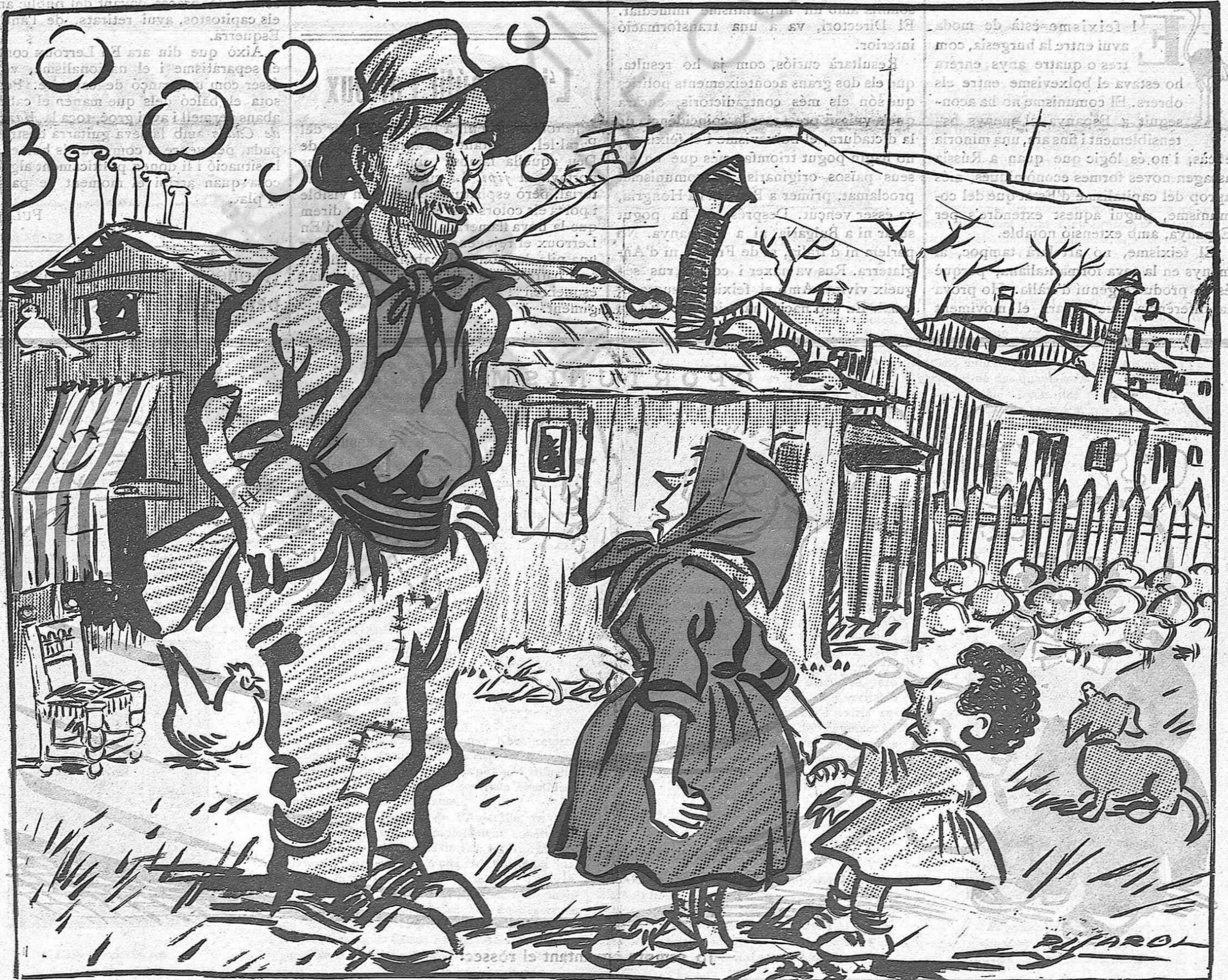
—A veure si s'oblidarà de venir a la casa humil!