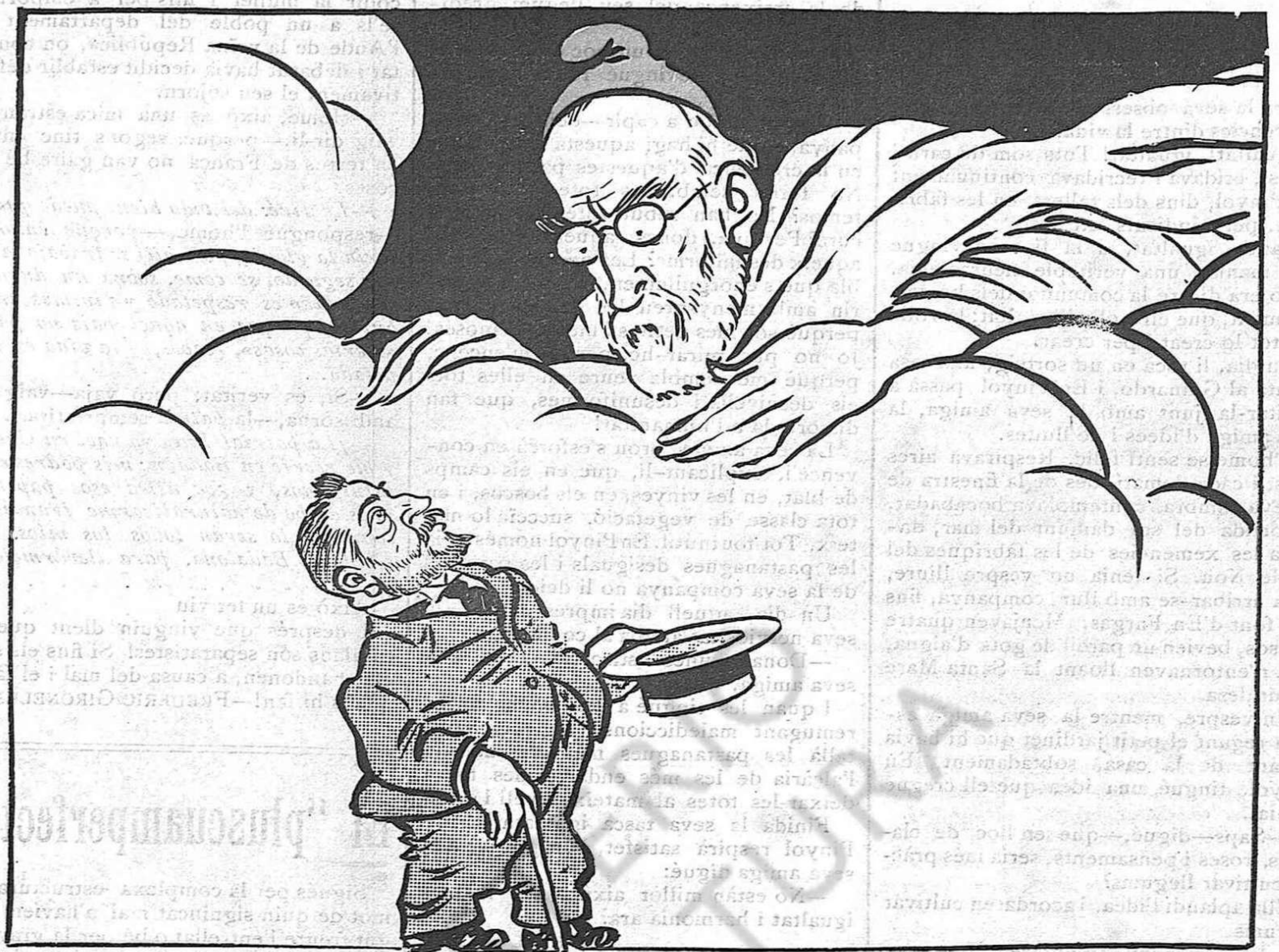
L'OMBRA D'EN PI I MARGALL. - Fas molt bé, fill meu, en no volguer res de l'Estat. Les prebendes són pels descastats.

Com a escriptor, com a periodista i com a re-