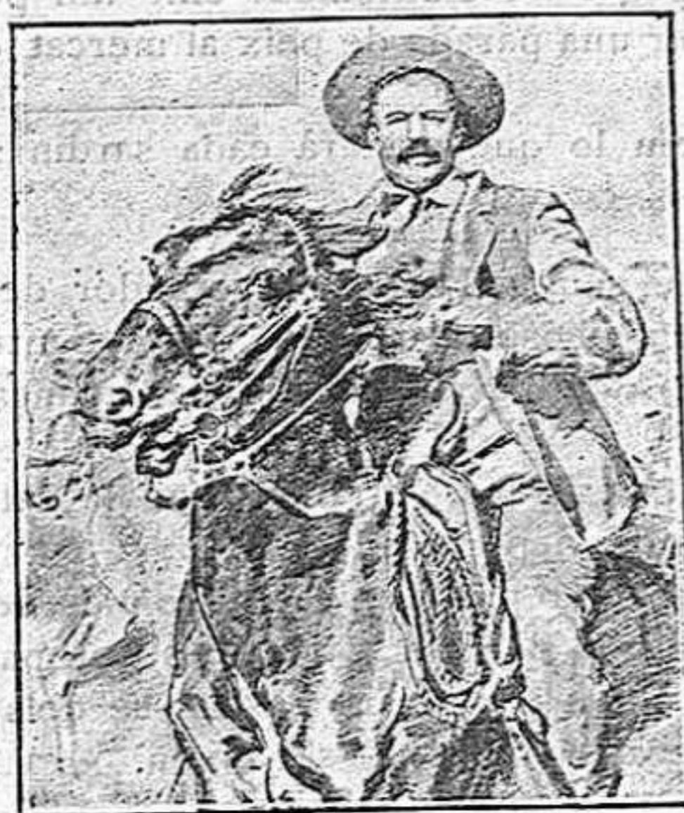
Panxo Villa, bandoler mexicà assassinat pels seus adeptes

Uns li diran heroï, els altres només capdill, nosaltres, sempre, assassí. No ho diem tan sols an En Panxo Villa, al mexicà, sinó a tots els Villas que hi han per aquest món de Déu, a tots els que com ell, amaguen sota els galons, els trajos llampants i la quincalla, els seus instints de fera.