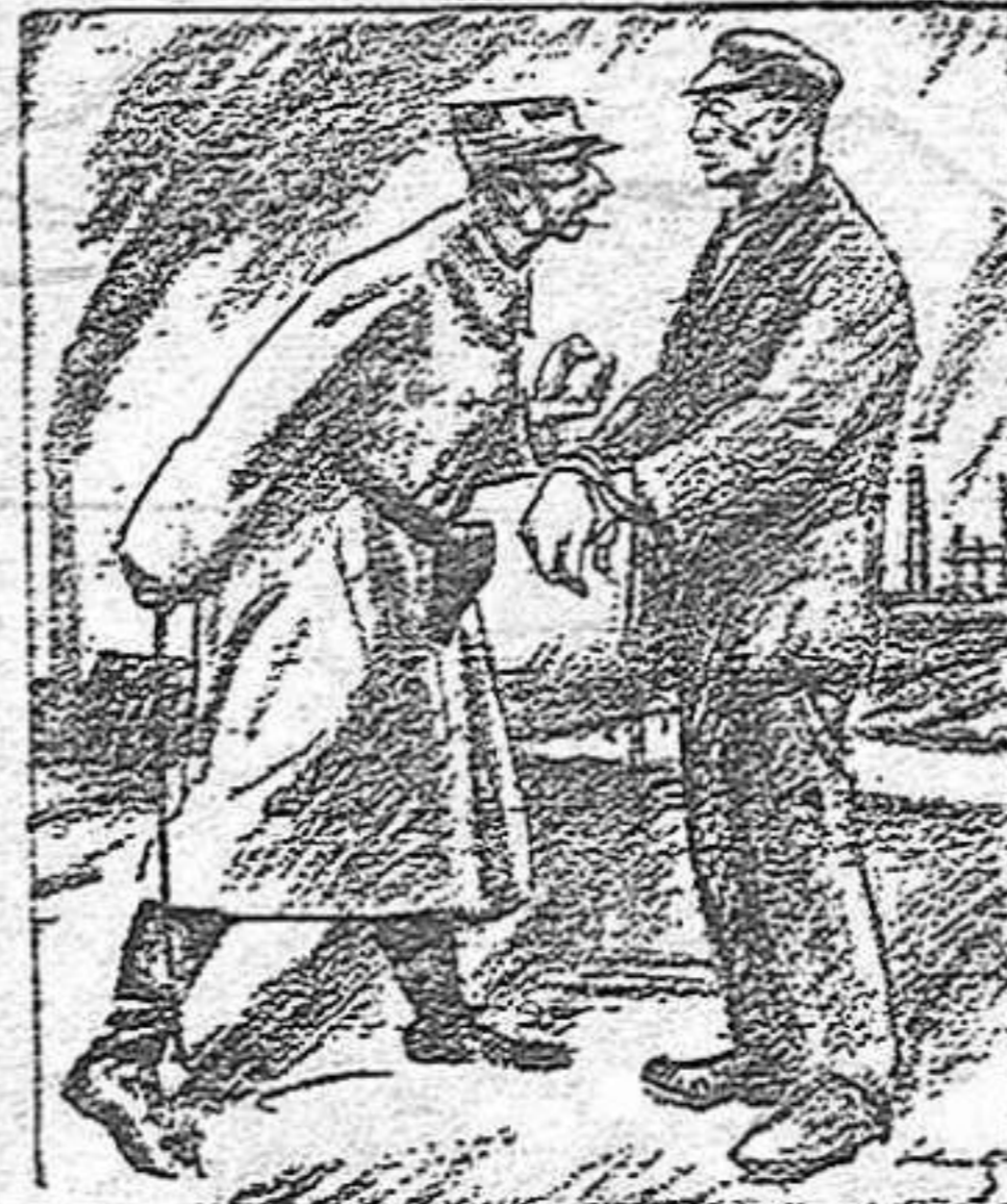
L'alemany.—Si em deixeu treballar, pagaré.

Tenen raó els francesos? La tenen els alemanys? Els primers diuen que reclamen lo que és seu; els segons diuen que no poden pagar. Ve't aquí dues raons de força. Es molt serio això de no poder pagar; però potser encara ho és més el no poder cobrar. Qui vol cobrar, espera una cosa que no té; qui no pot pagar, s'estalvia de