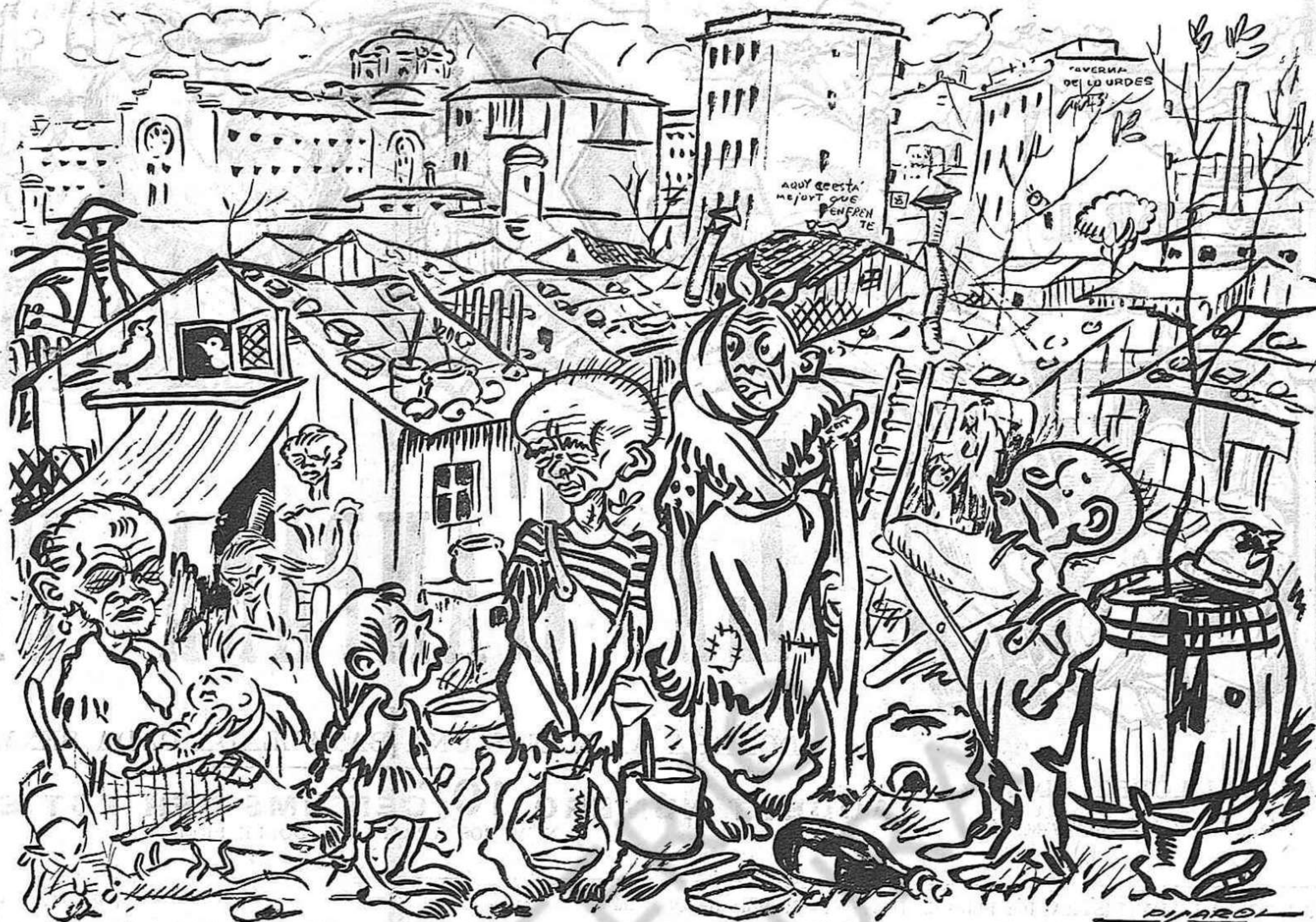
— Nosaltres també som a Les Hurdes i cap personatge vé a visitar-nos.

Amb En Blasco Ibáñez, varen emigrar moltes possibilitats. Per a la República, i qui sap, si per a Catalunya. Jo un dia li vaig sentir dir que s'estimava més Ulises, el mediterrà, que Don Quixot, el manxec. I això ja era el començament d'un credo nostre.—PARADOX