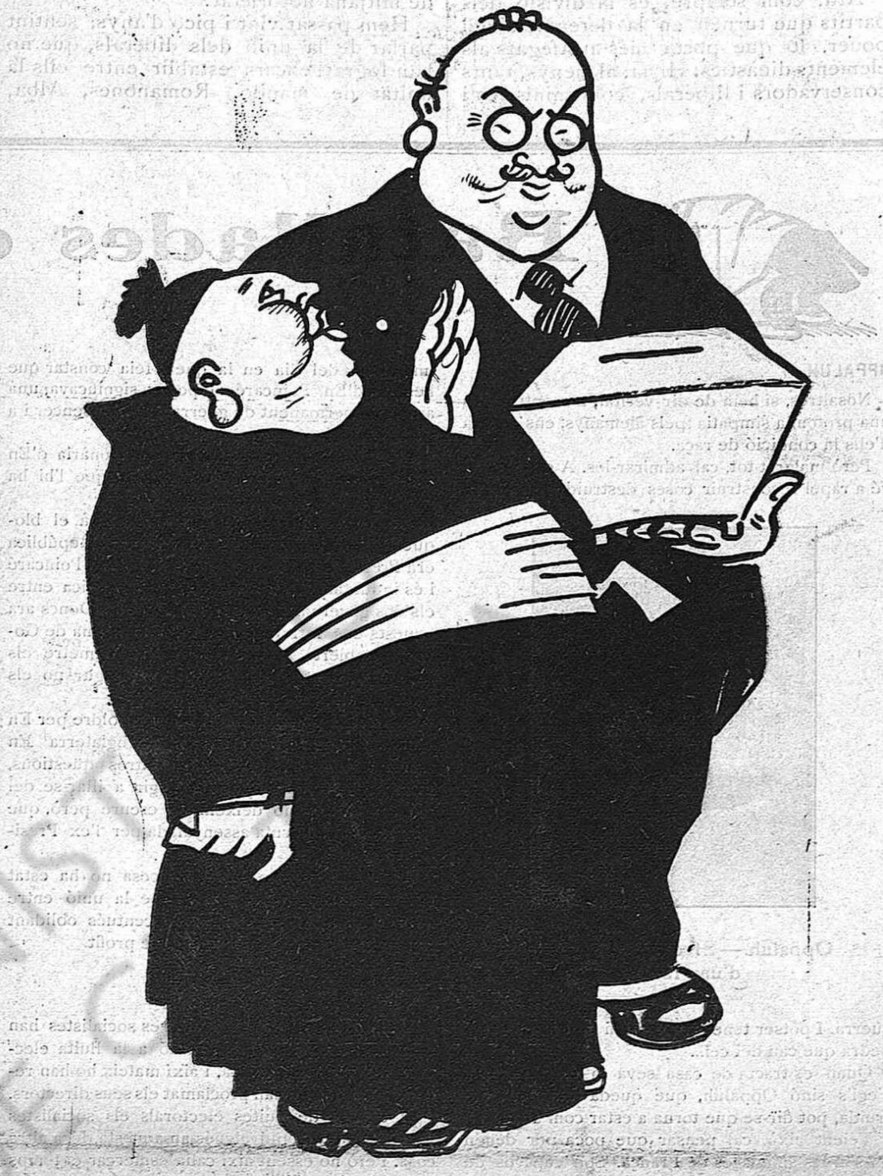
—Vostres : l'urna per motiu d'un mort; nosaltres alcem els morts per motiu de la urna

volen ésser primers seran els últims. L'home encara no ha obert la boca. El tró petarà quan hagi de petar. Ara com ara, tots al tanto i esperar ordres.