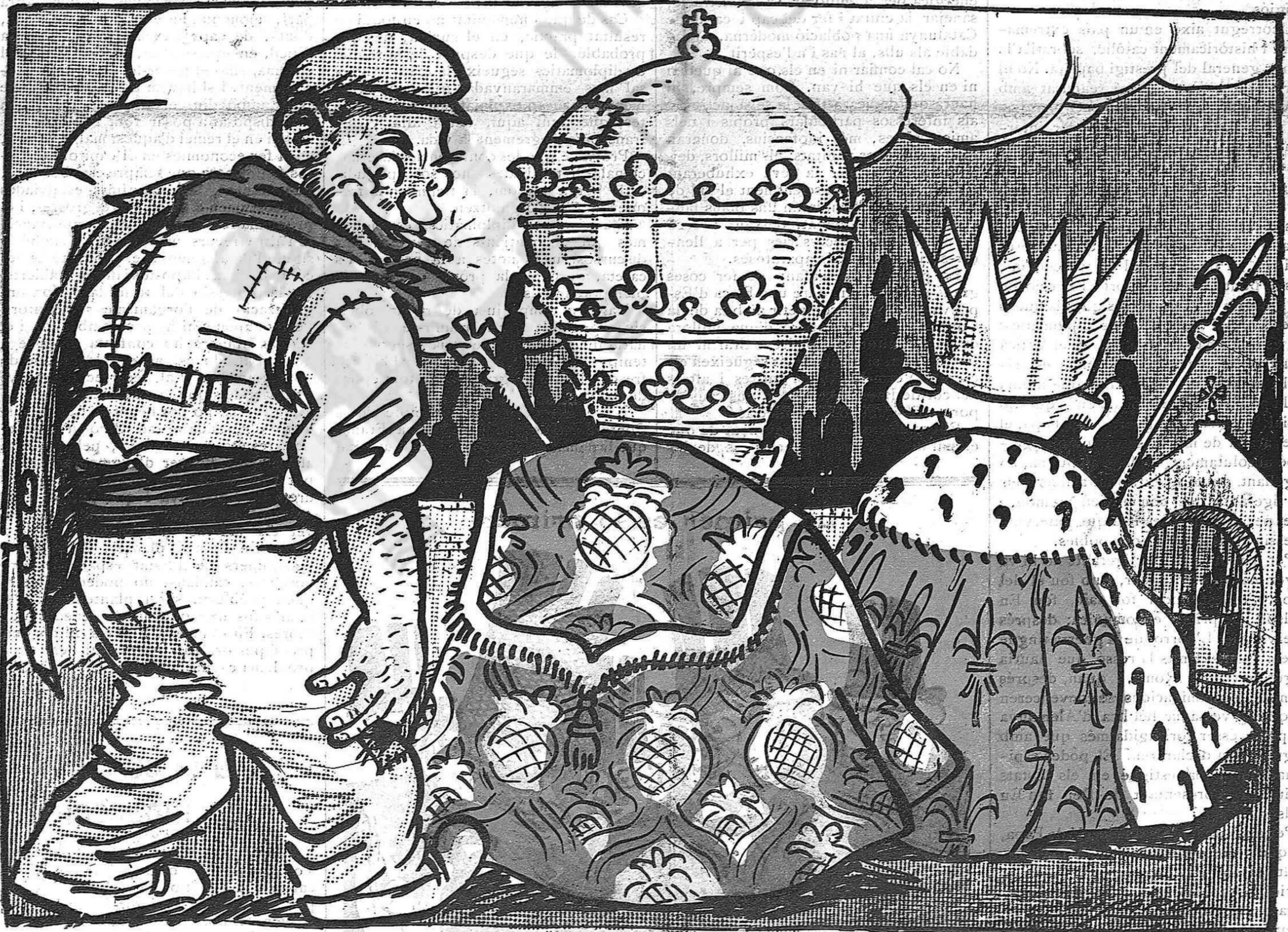
Tant hi va el rei, com el Papa, com aquell qui no té capa