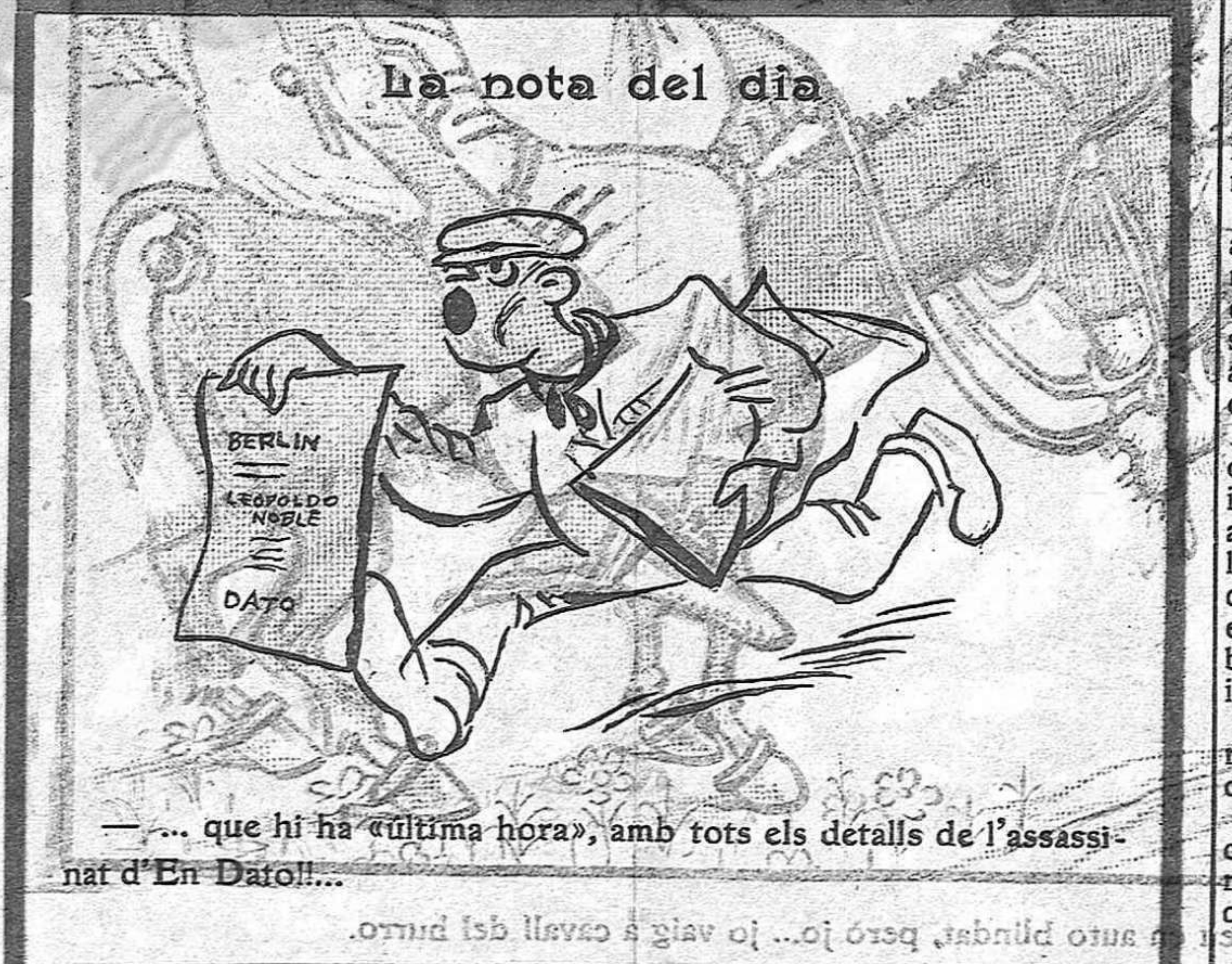
... que hi ha «última hora», amb tots els detalls de l'assassinat d'En Dato!!...