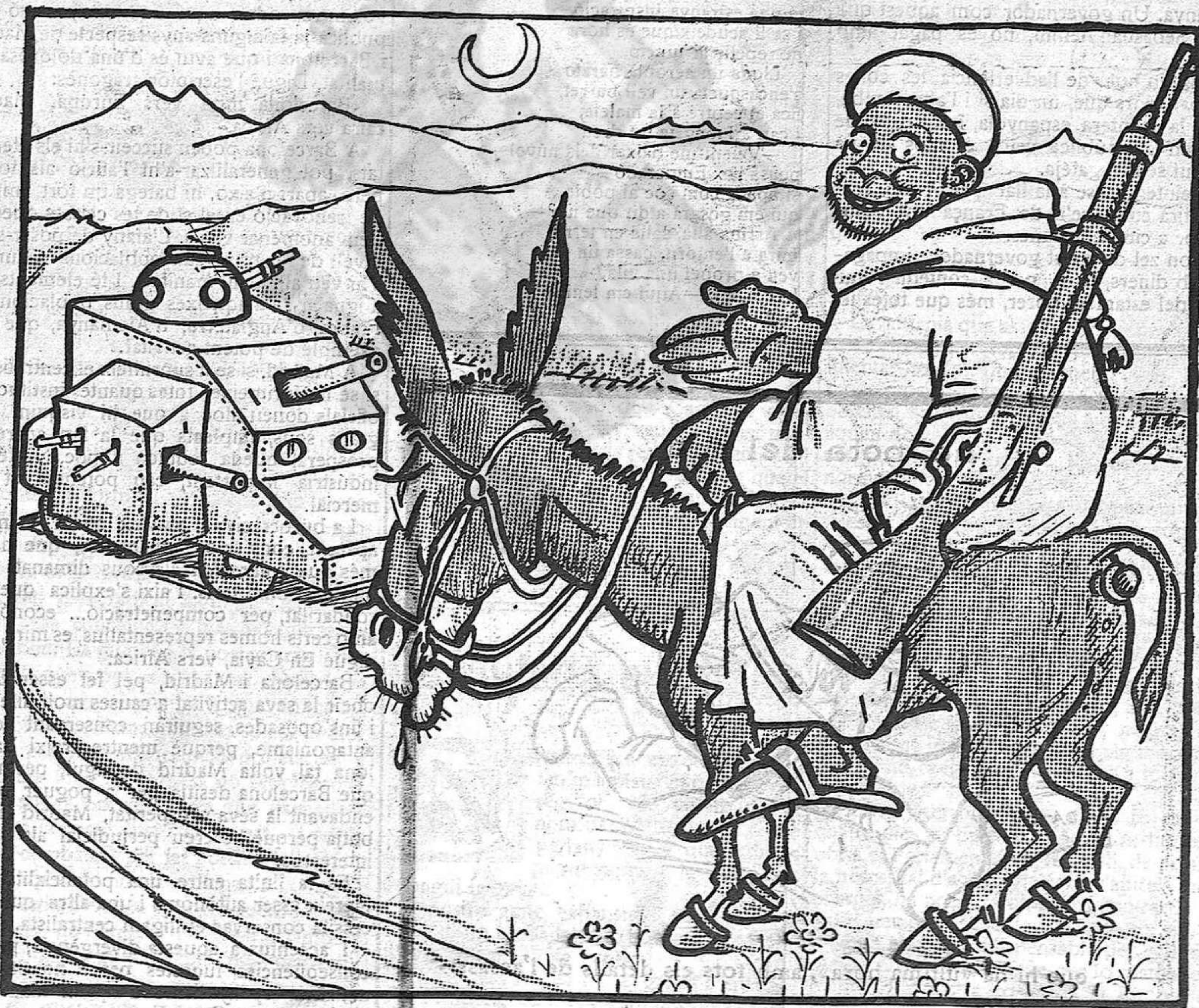
—Vosaltres aneu en auto blindat, però jo... jo vaig a cavall del burro.