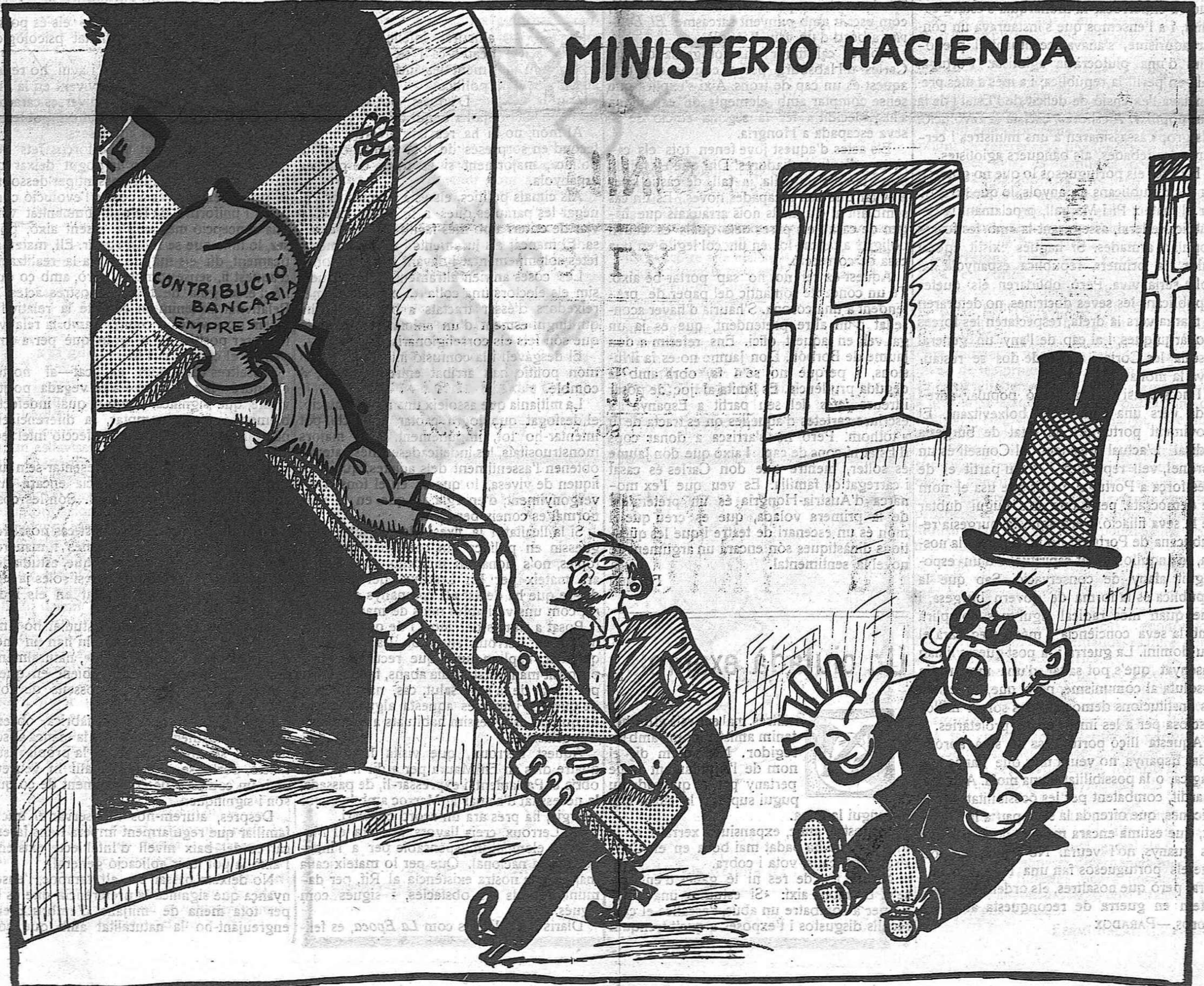
—Ha arribat l'hora de treure el «sant-cristo gros».