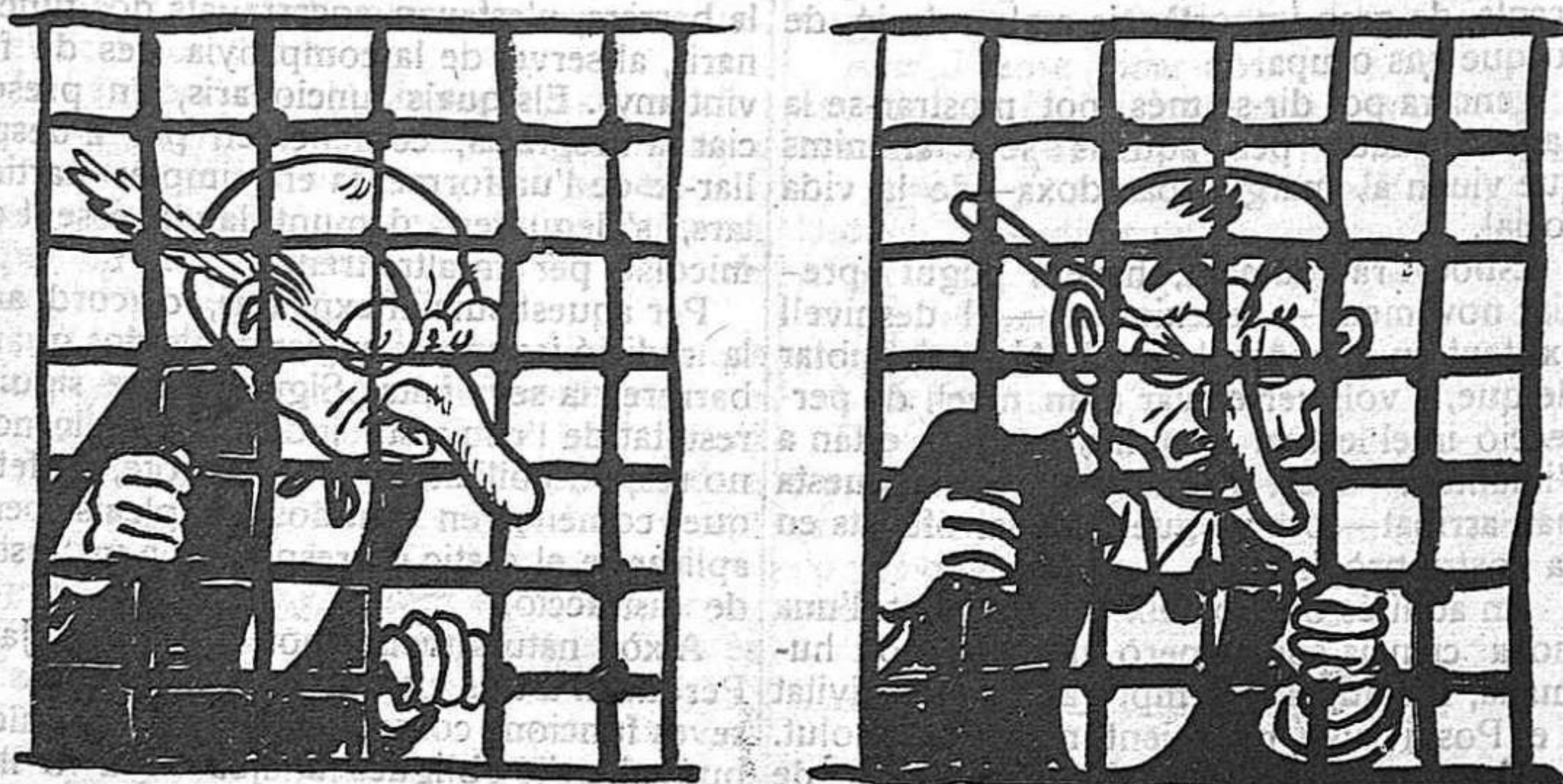
Els que voldrien que resplendís la veritat