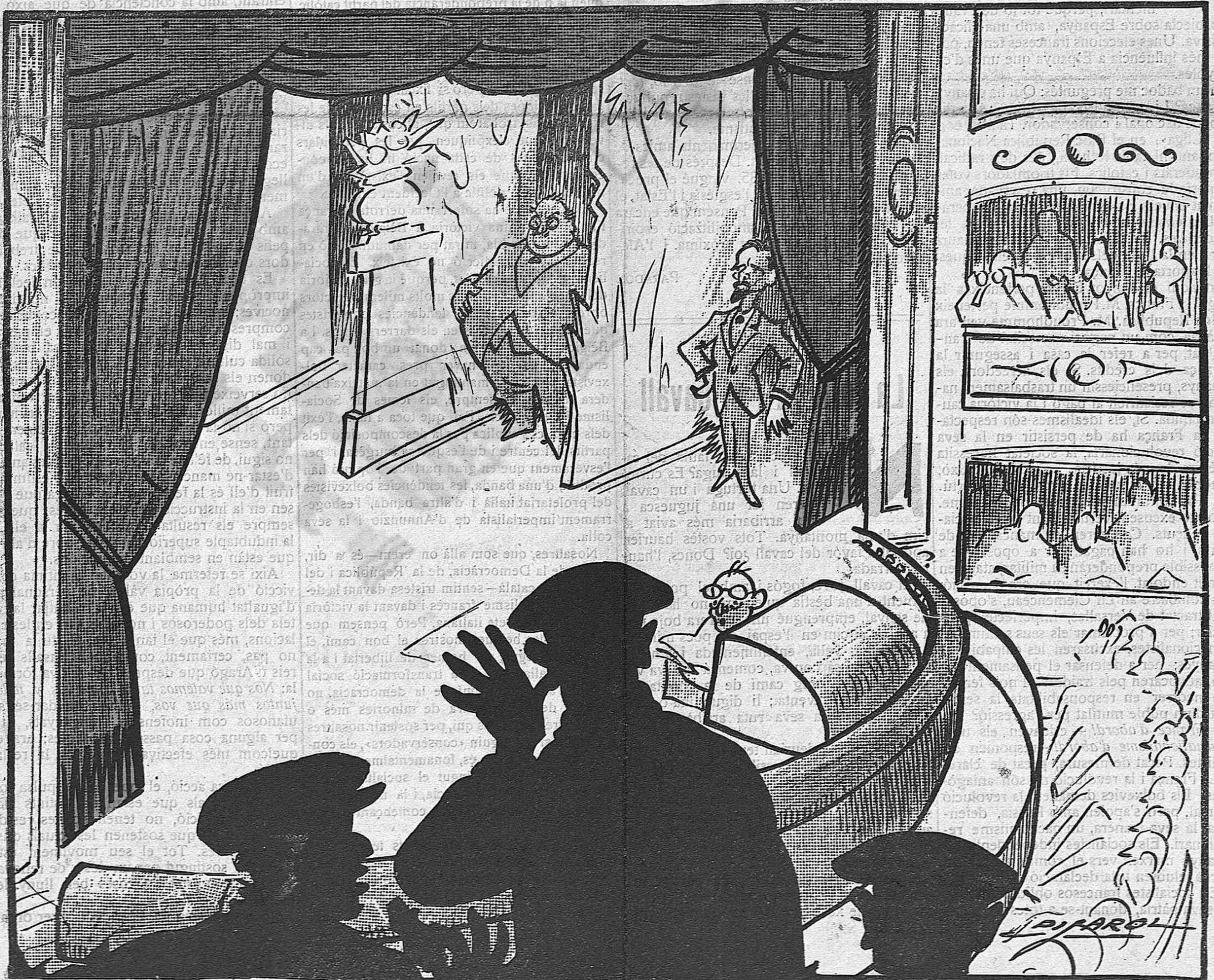
Els artistes (al traspunt).—Que sortim? Un del públic.—No!... No sortiu mai més.