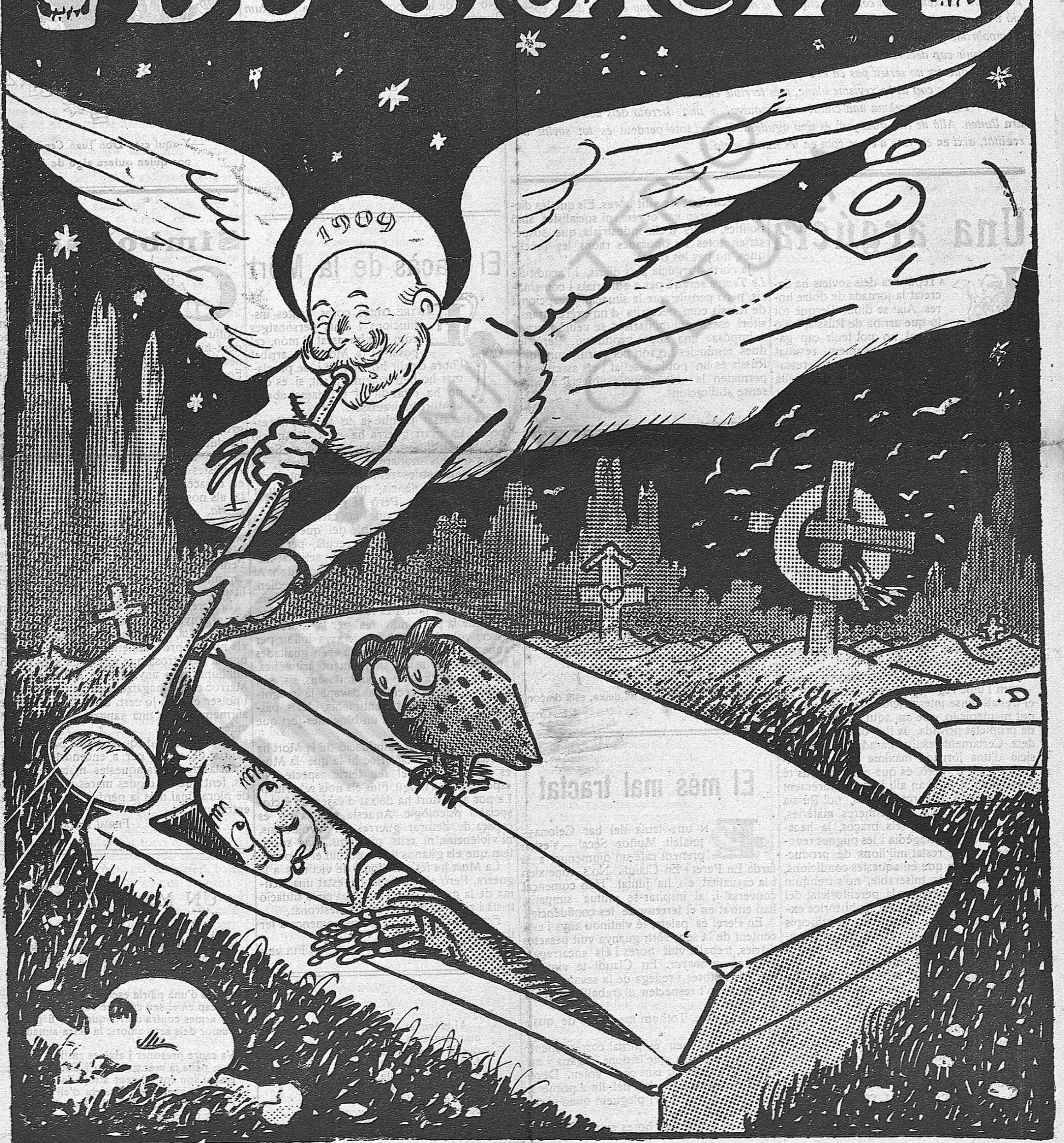
L'àngel trompeter.—Ànsia, desperteu-vos que ja és hora.