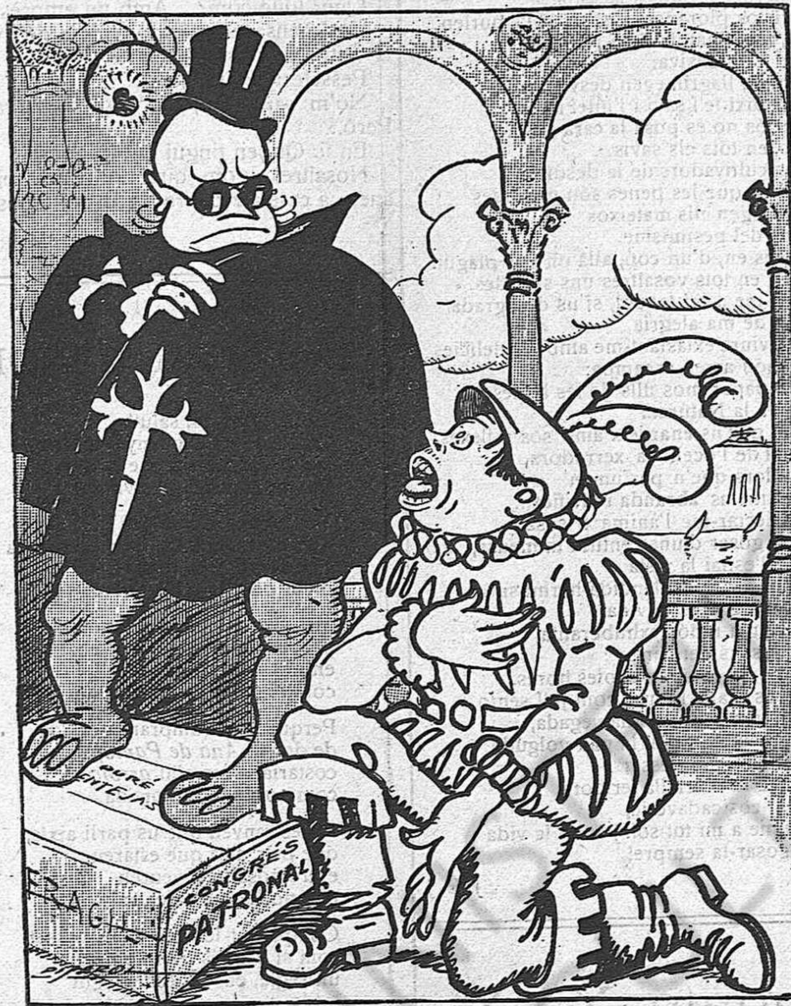
— Comendador,... que me pierdes!