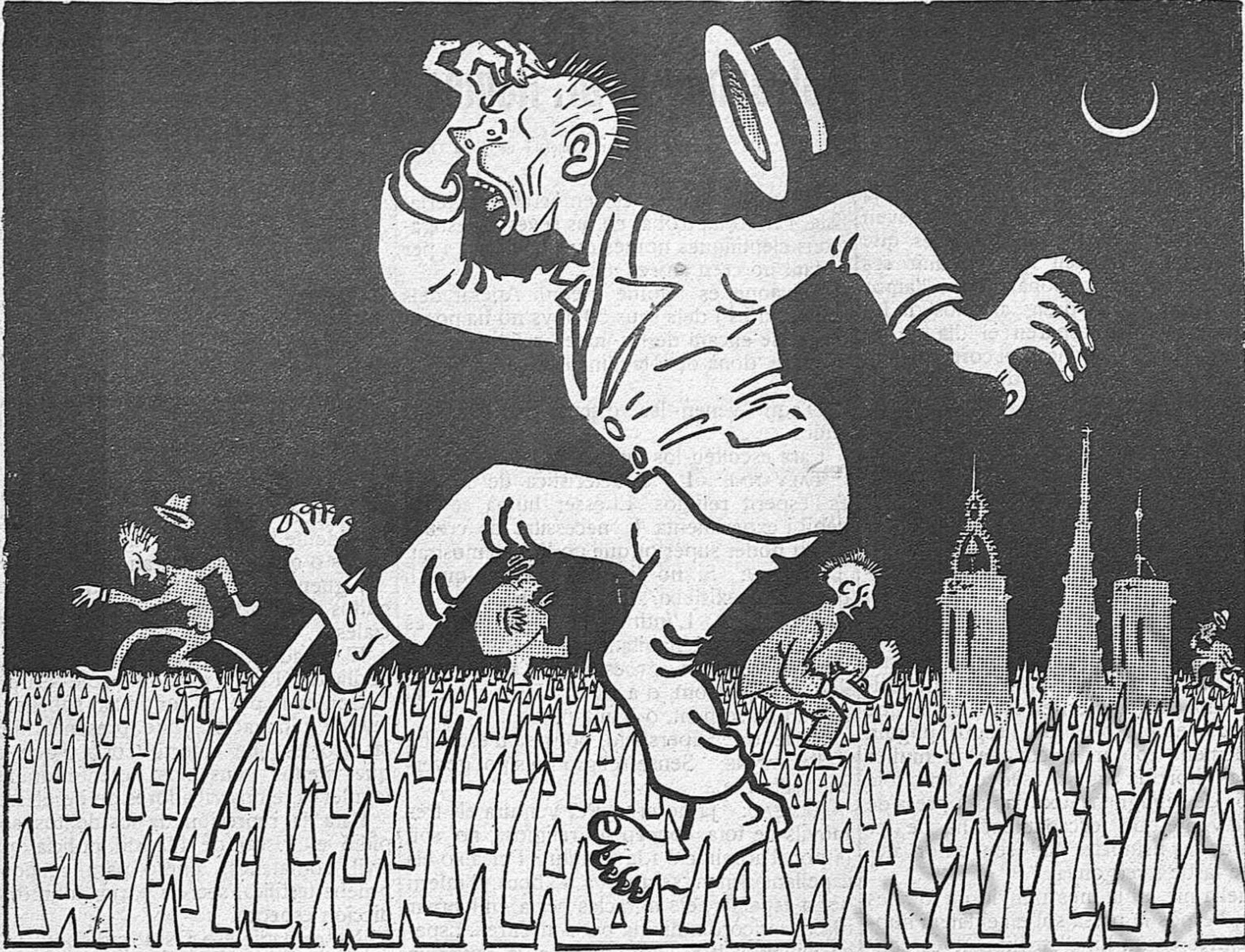
— Quins empedrats més dolents hi ha a Barcelona!...

Demà, diumenge tindrà lloc el ja tradicional Rosari de la Mercè, moixiganga que deuria fer-se a dins de l'església, però que les sagra-des llibertats , que a Espanya no més s'apliquen pels carques, permeten que els desvagats xarrrupa-ciris interrompin, al mig del carrer, la vida ciutadana.