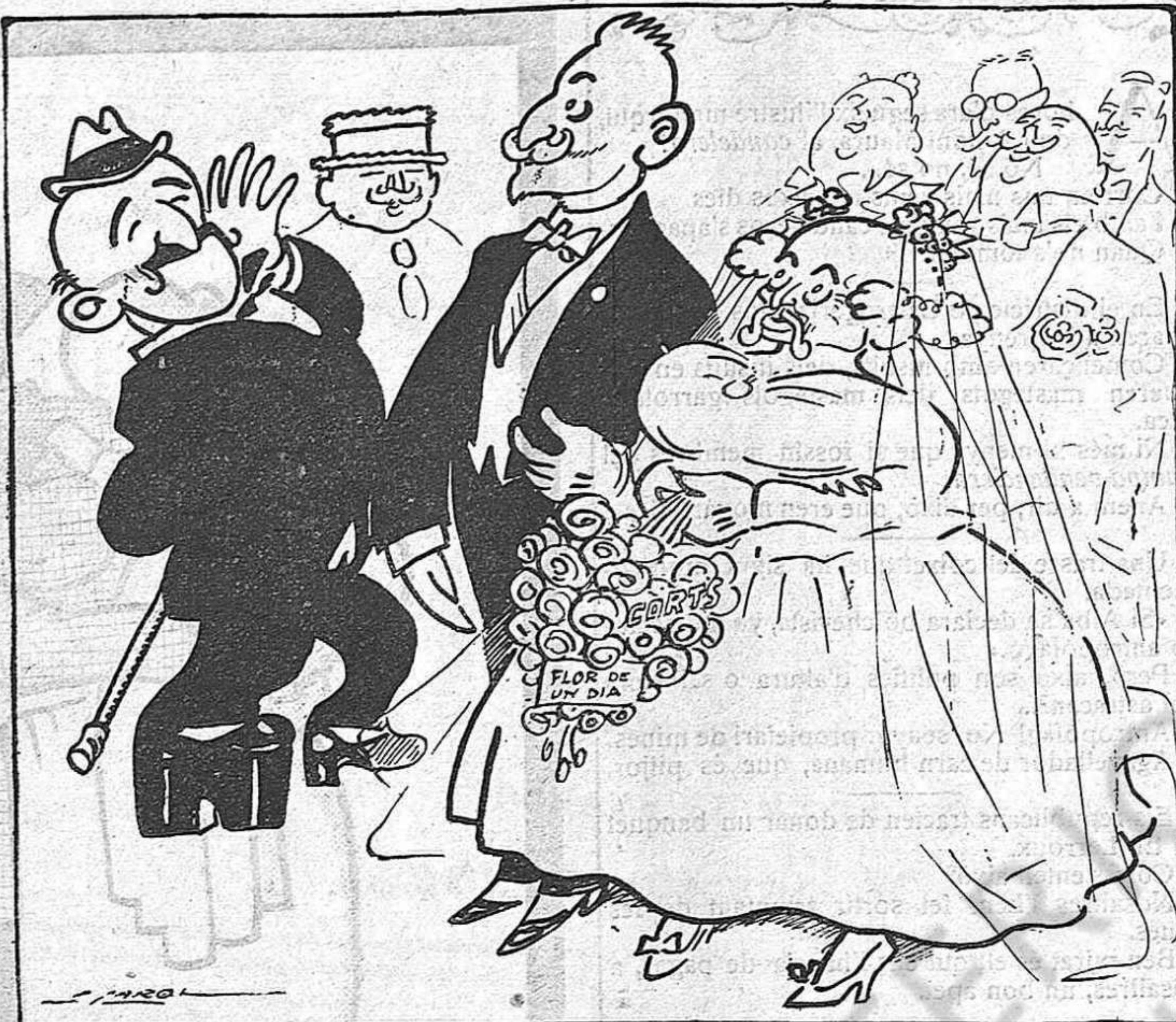
—Desa't concol!... Que no ho veus que no faràs cap criatura.

Ull, doncs, que al pare no li passi per la barretina fer ballar a les criatures, que com vostè i nosaltres sabem de memòria tenen mals jocs i són molt entremaliades.