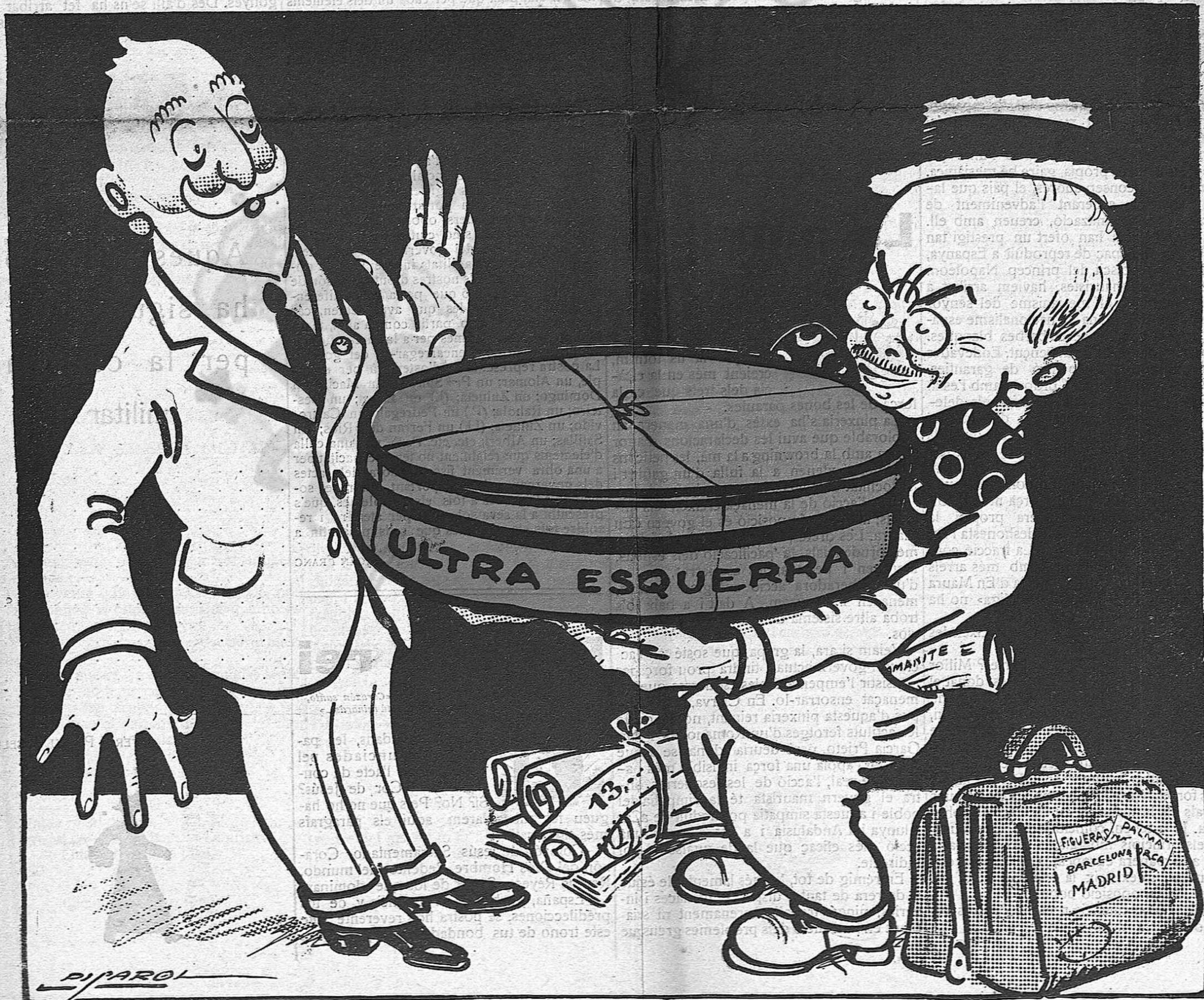
—Ei, mestre Bieló!... Voleu dir que això no explota?...