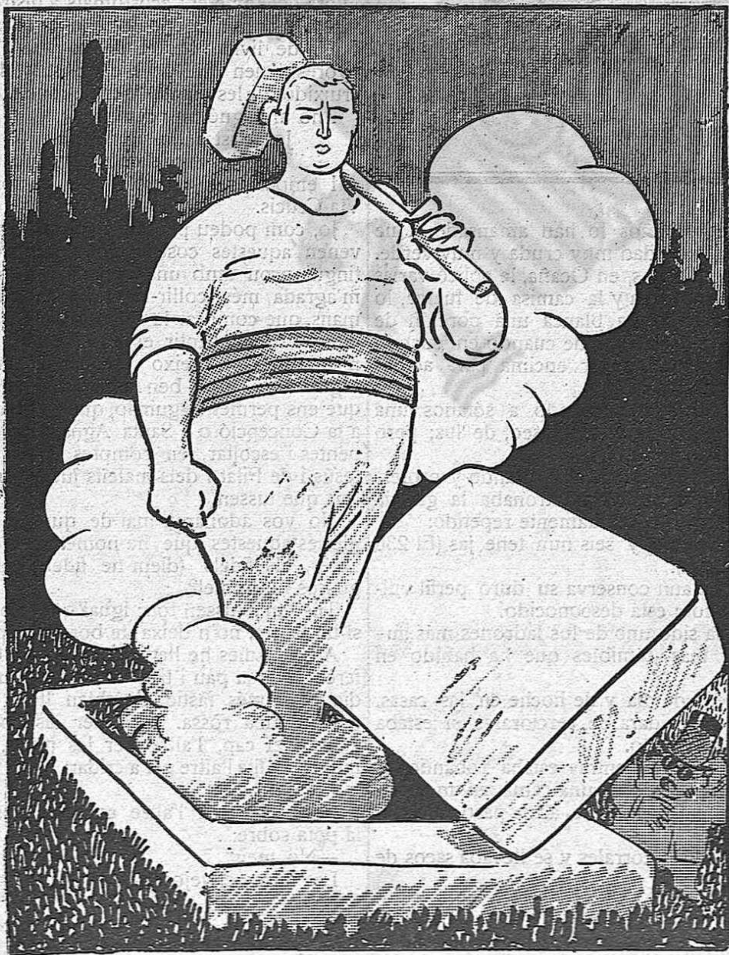
La Ressurrecció del Treball

que també miren, no's mosseguen ells amb ells.