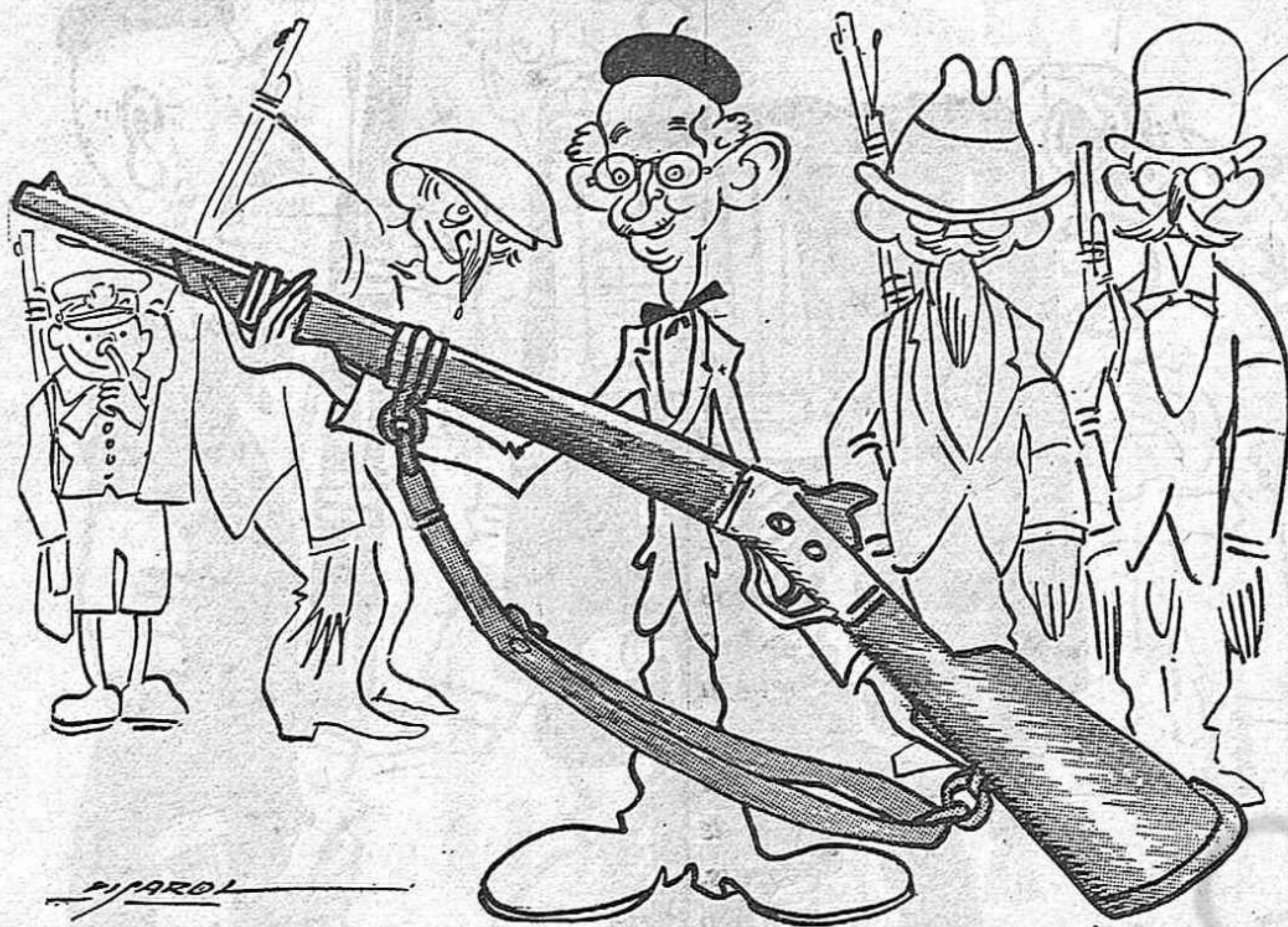
— A mi rai! No'm venen de nou les escobres. Ja ens coneixem fa temps.

puguen pendrer-ne comiat, vull que cantin com sa mare a la Santa Llibertat. Què qui soc? jo, Catalunya. Què pretenc?... tan sols lluitar, jo vull veure com s'allunya del meu poble el mal-estar.