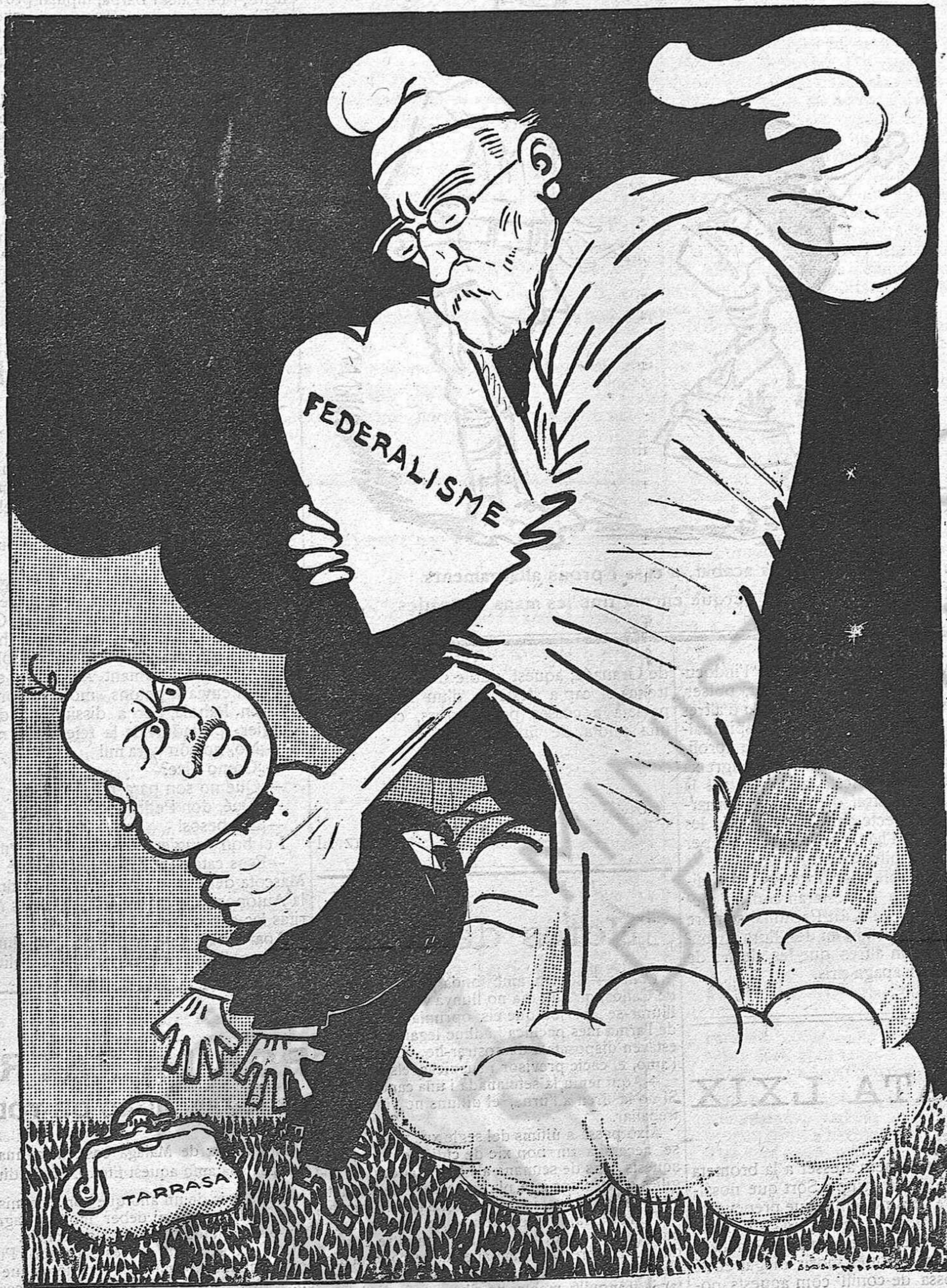
Ets un mal fill de la terra catalana