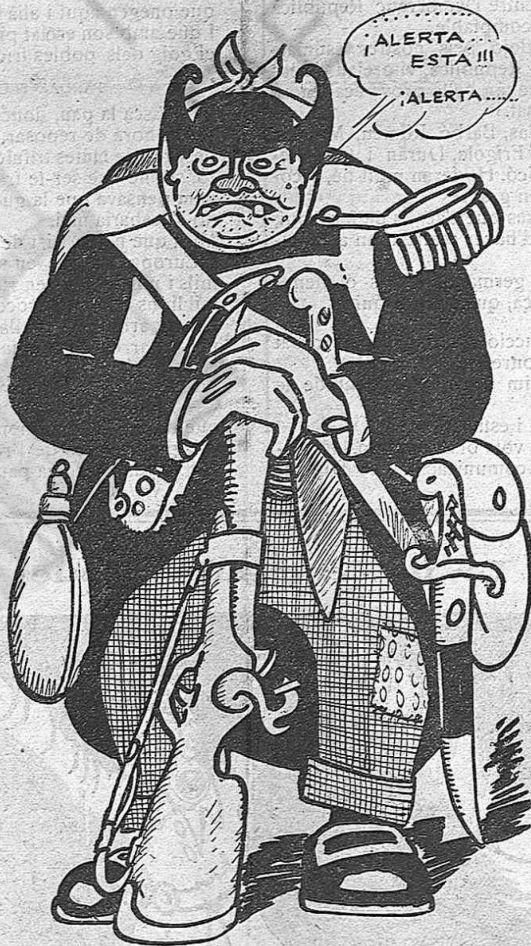
El defensor de les Dretes.

La Cambra francesa unànimement ha aclamat als voluntaris catalans, assentint amb visques i aplaudiments a les paraules xardoroses del il·lustre diputat.