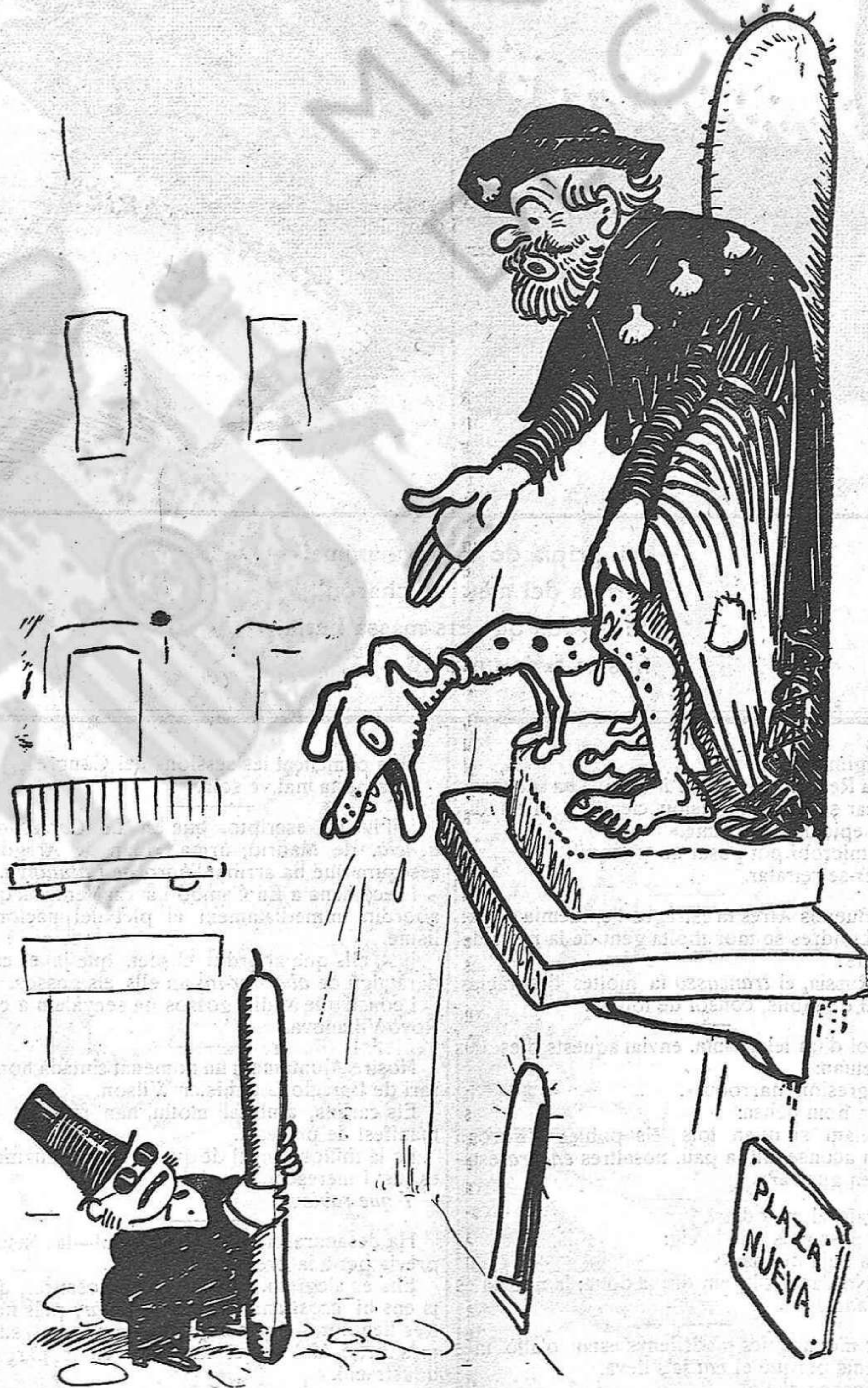
Sant Roc. —Hala!... Feu-vos repicar!... Perquè sou tan bruts; que aviat me la fareu agafar a mi i tot, la pesta.