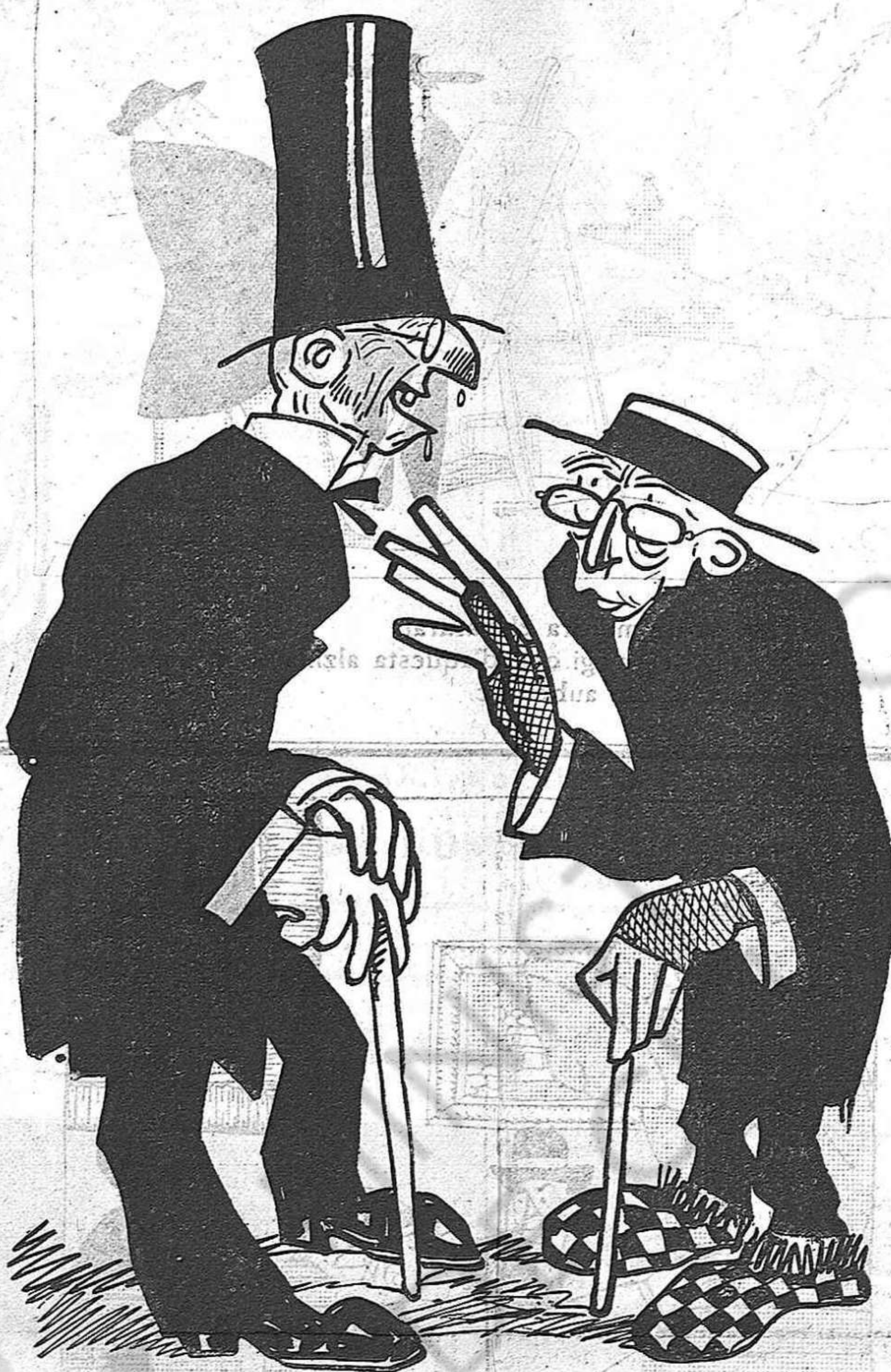
—Ai don Josep que'n trigarem d'anys a tornar a veure una guerra tan horrosa com aquesta.