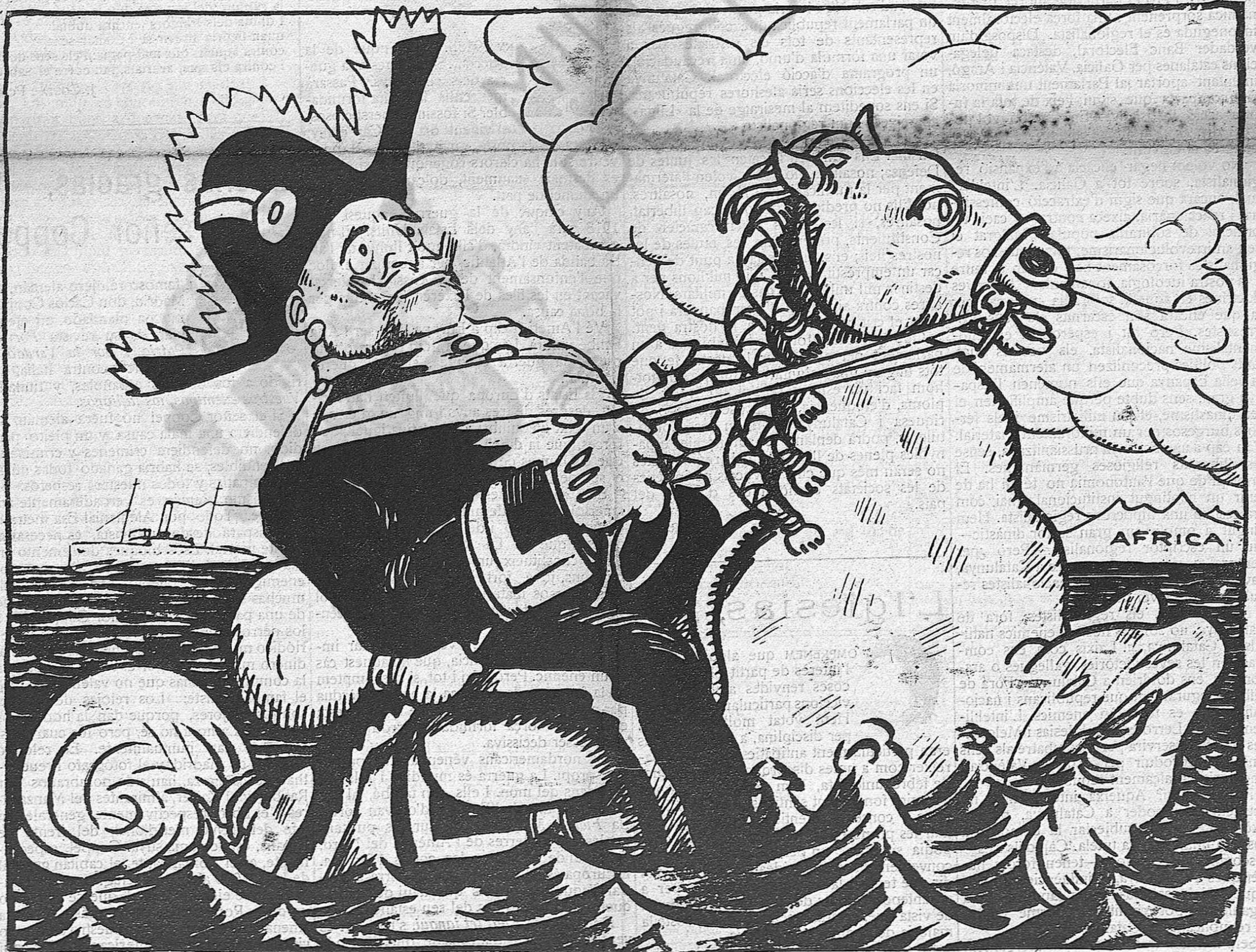
Dalt d'un cavall sicilià cap al Marroc se'n vol anà.