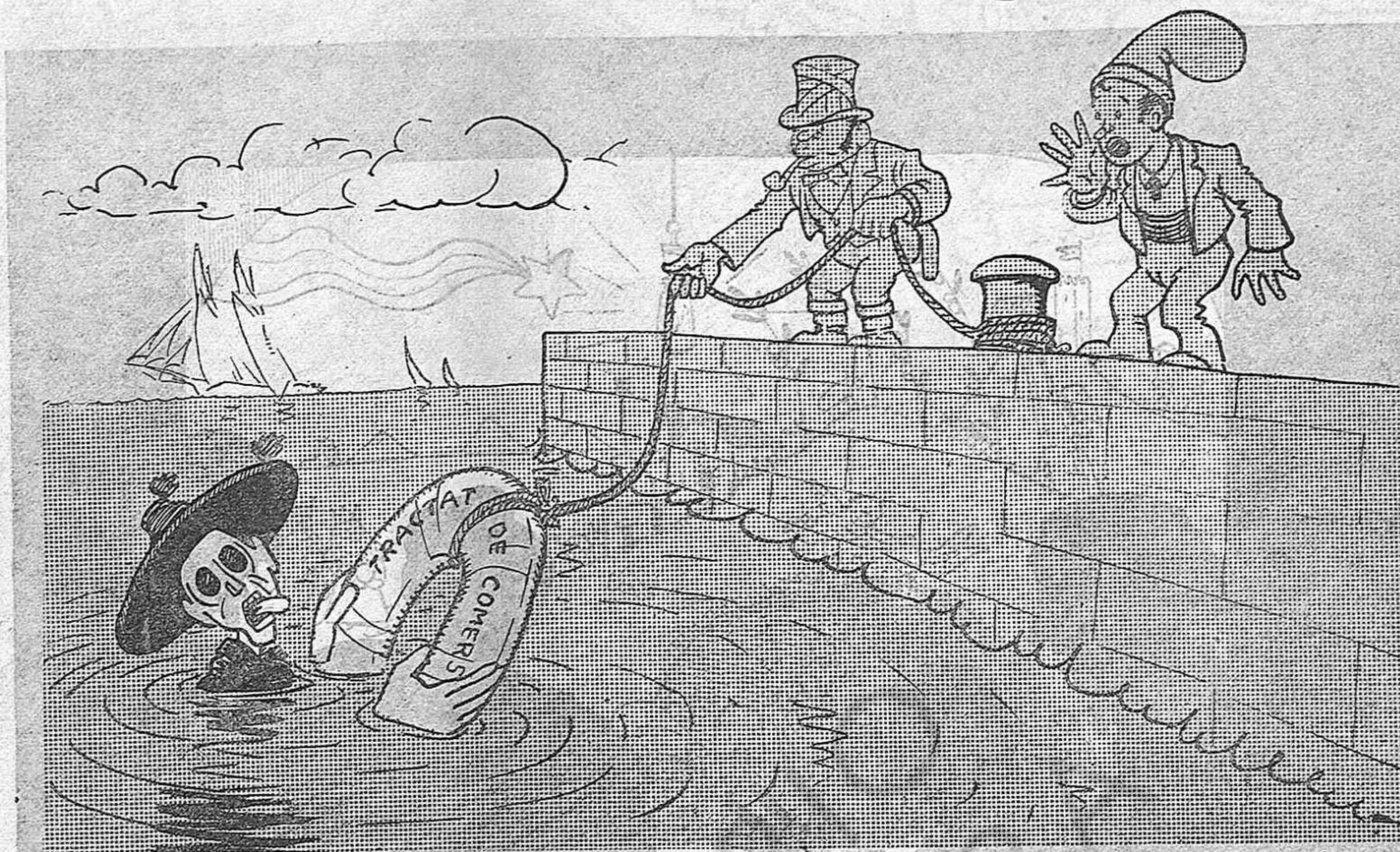
El catal6. — Encara ets german6fil?...