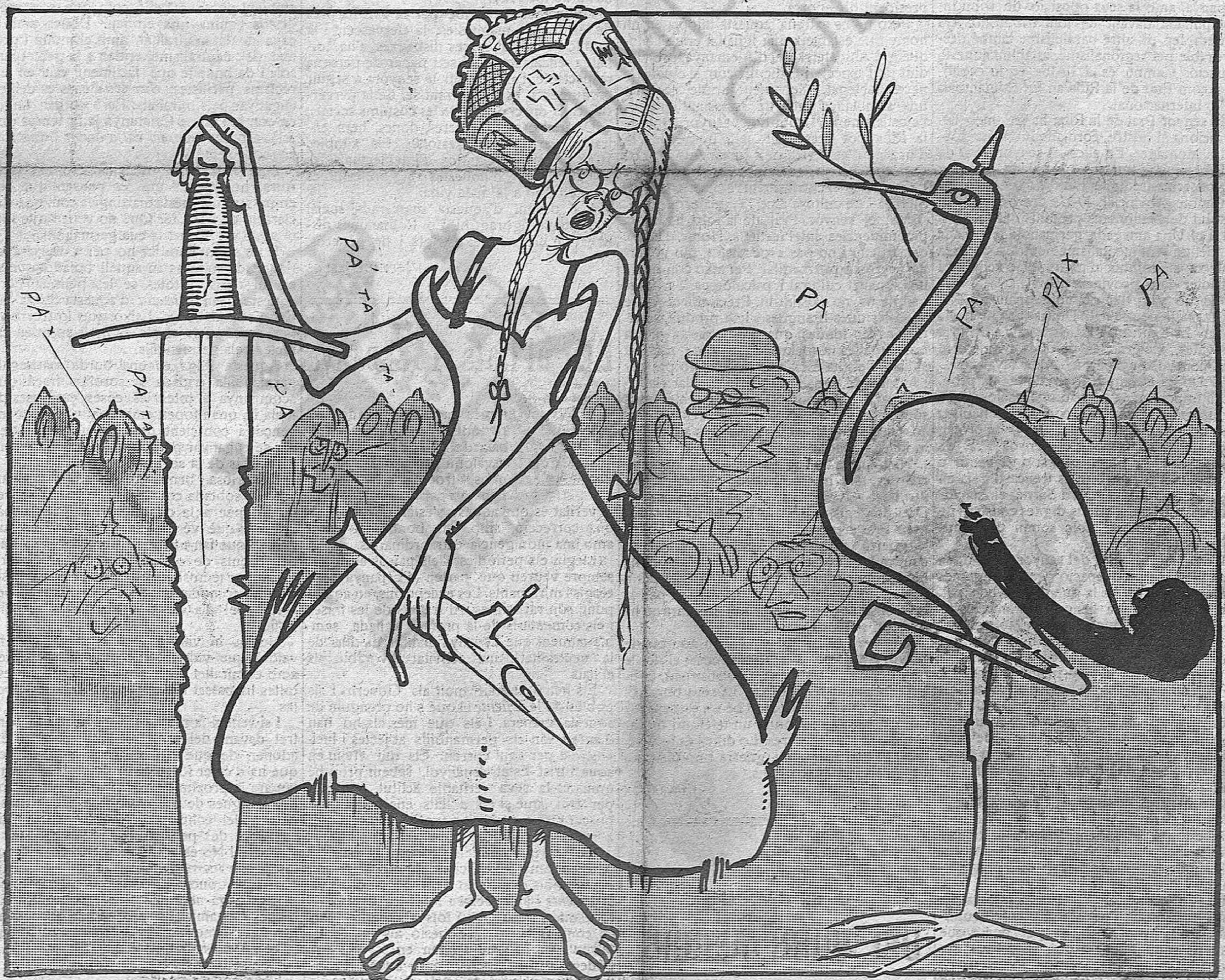
—Ja és ben trist. Tan poderosa, i veure'm precisada a menjar peix de aquest de ferro que en diuen submari.