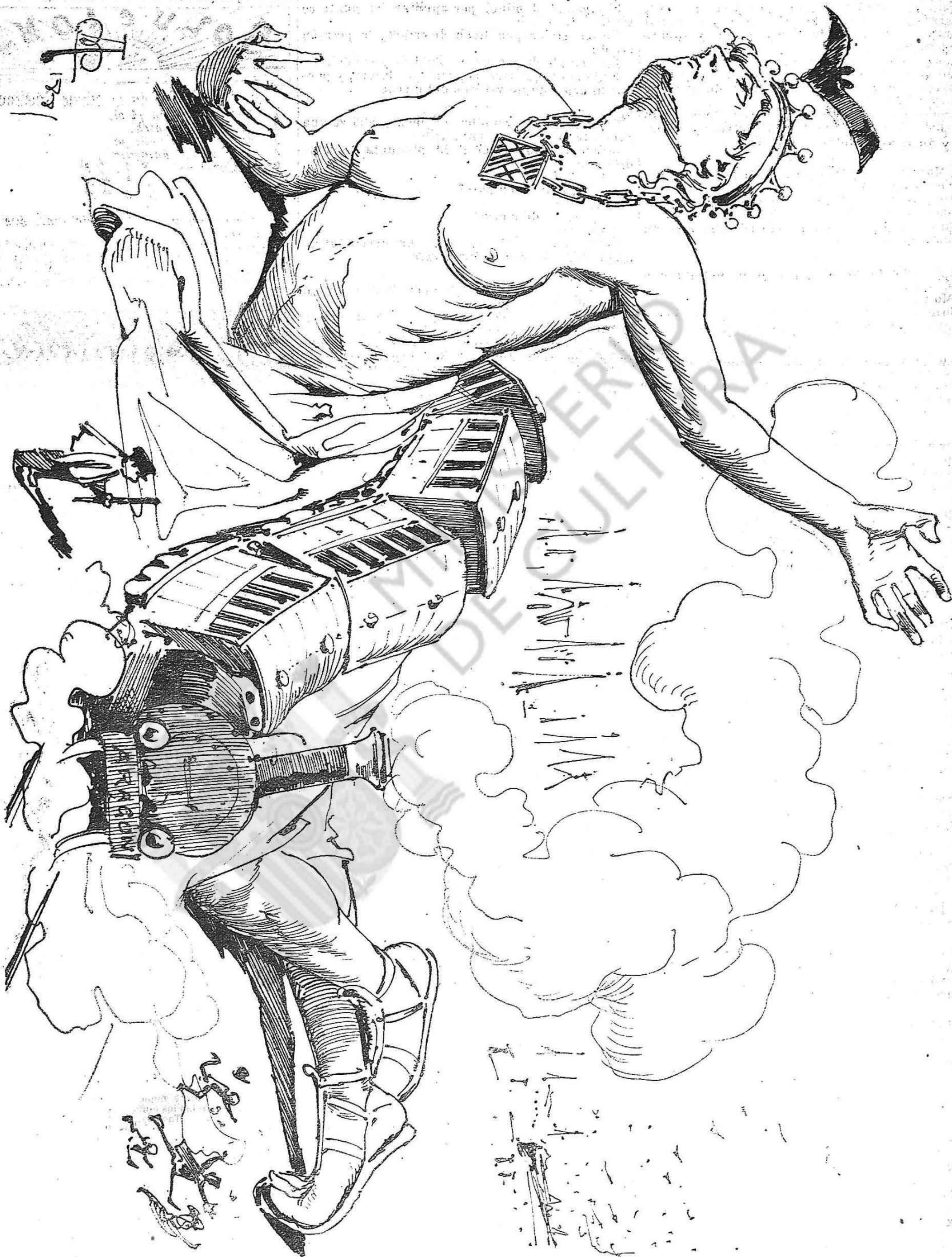
!Partida per la meytati!