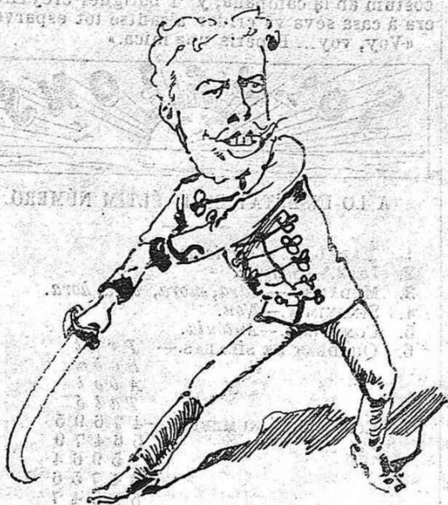
Los húsars se preparan per las elecciones; pero com que 'ls han desmontat, no son temibles.