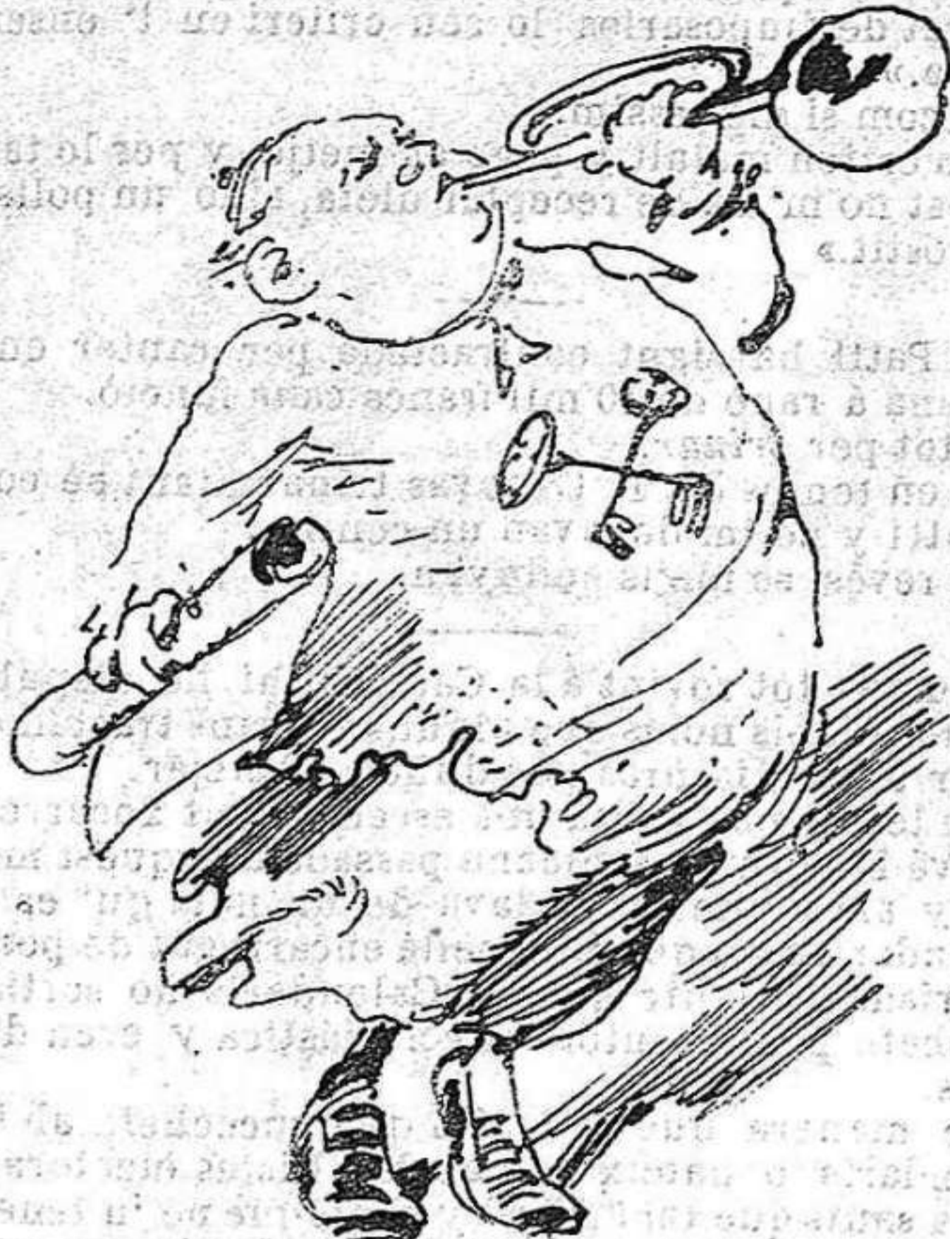
Lo Nunci d' Espanya crida una protesta. Tant es que risqui com que rasqui.