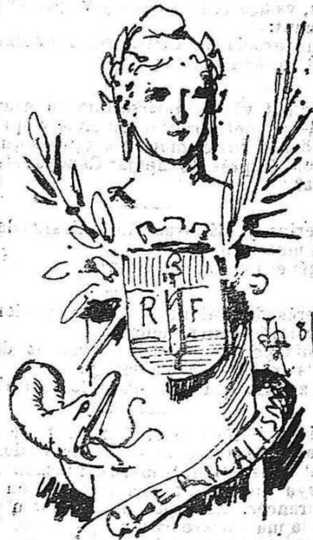
Perque, per més que 'l clericalisme vulga cargolarse al pilar de la República, per xo no 'l tirarà á terra.