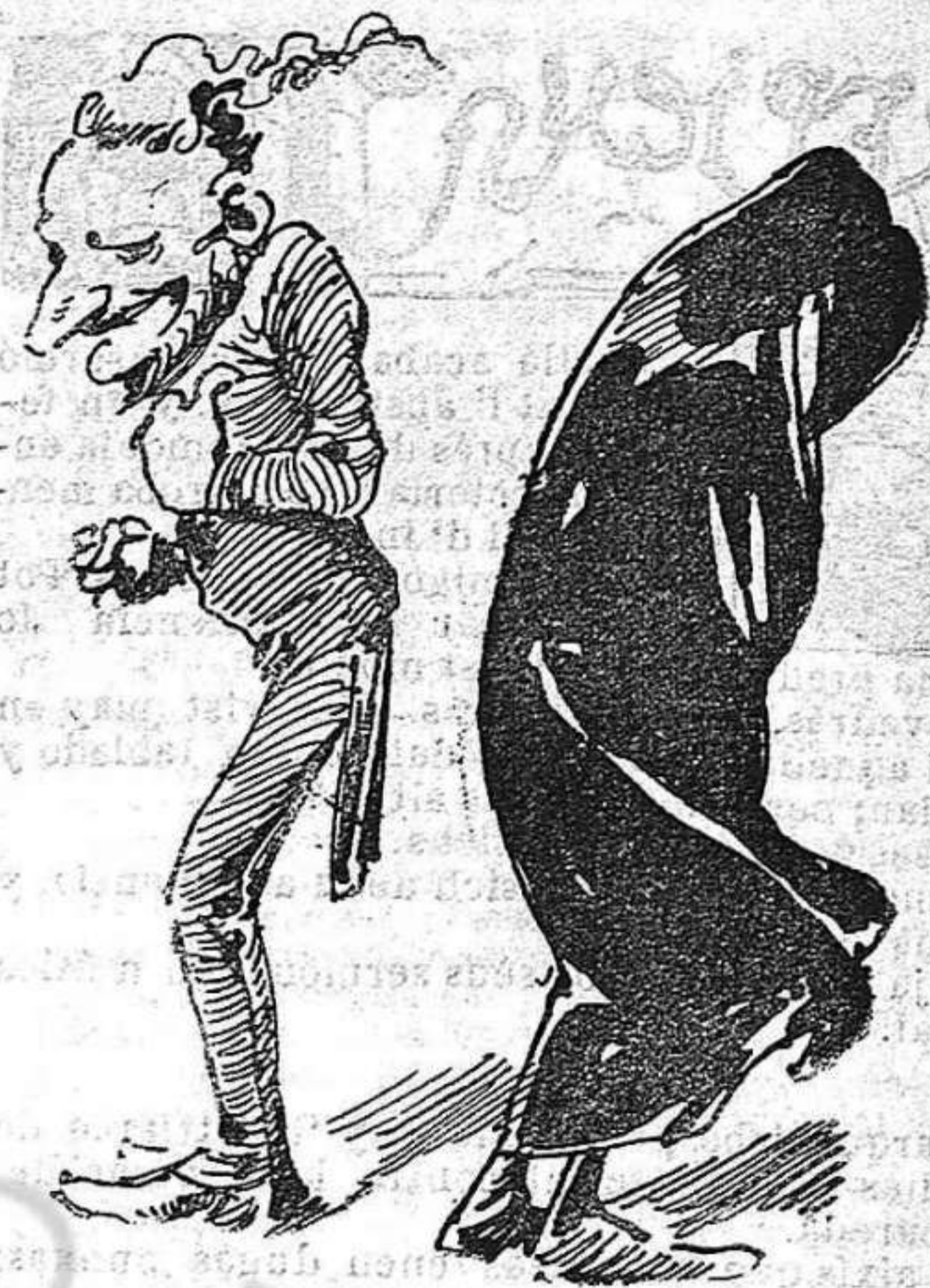
—Si restableixo 'l matrimoni civil me devorcio ab l' Iglesia; pero en cambi 'm caso ab la llibertat.