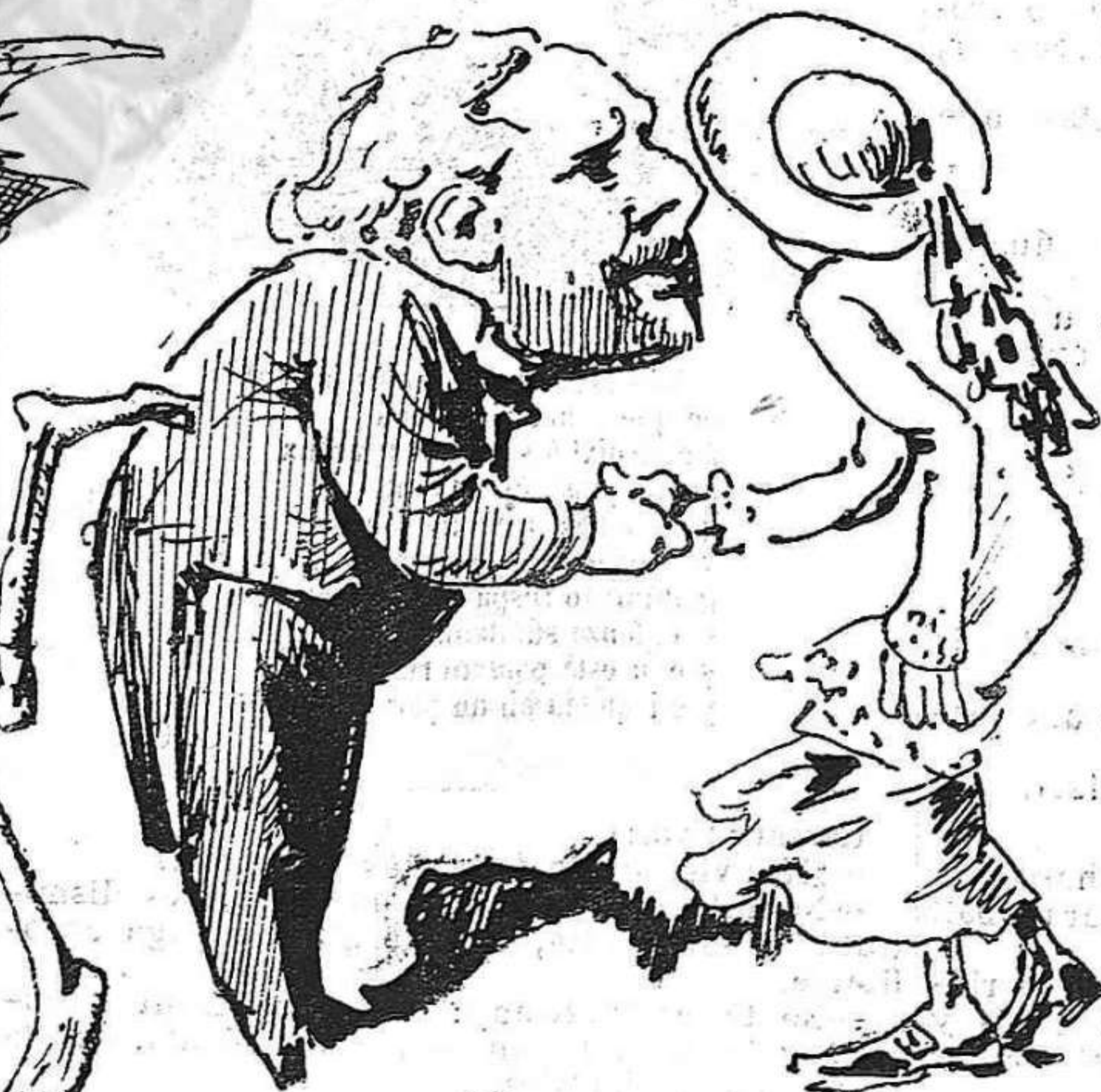
Lo Nunci de Fransa dona la mà à n' en Gambetta. Tant es que rasqui com que risqui.