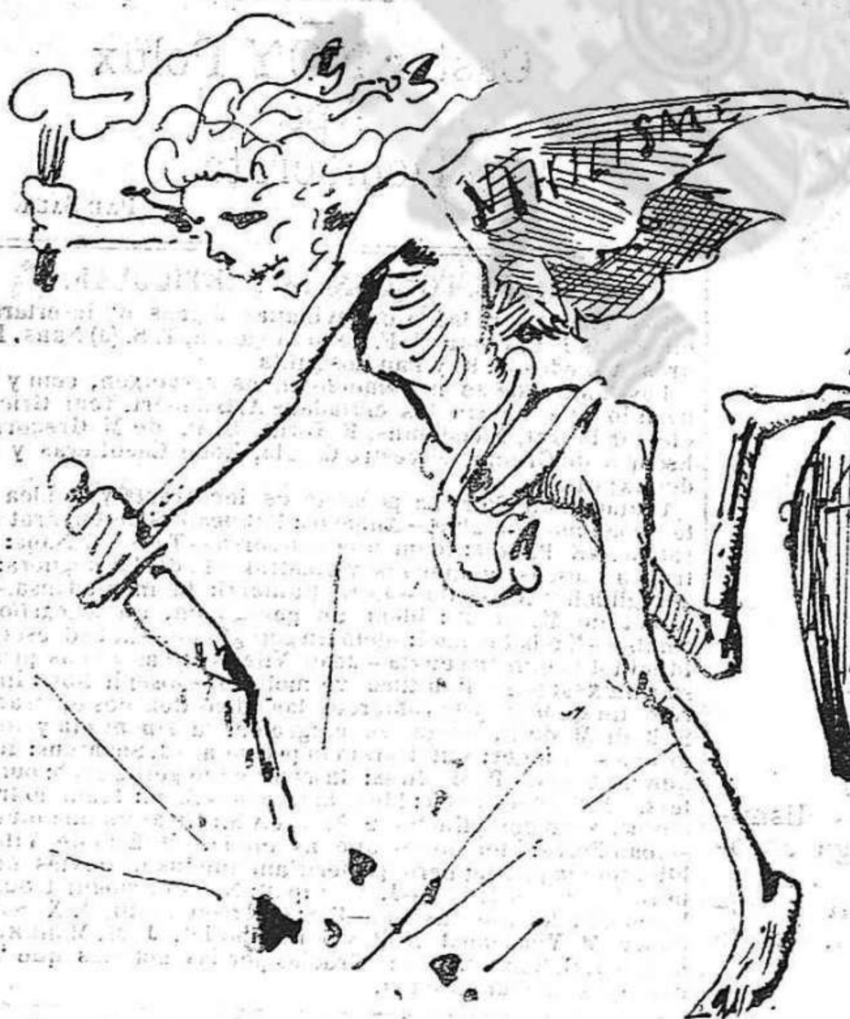
Al mónstruo de la tiranía, respon lo mónstruo del nihilisme. La llibertat es la cura del un y del altre.