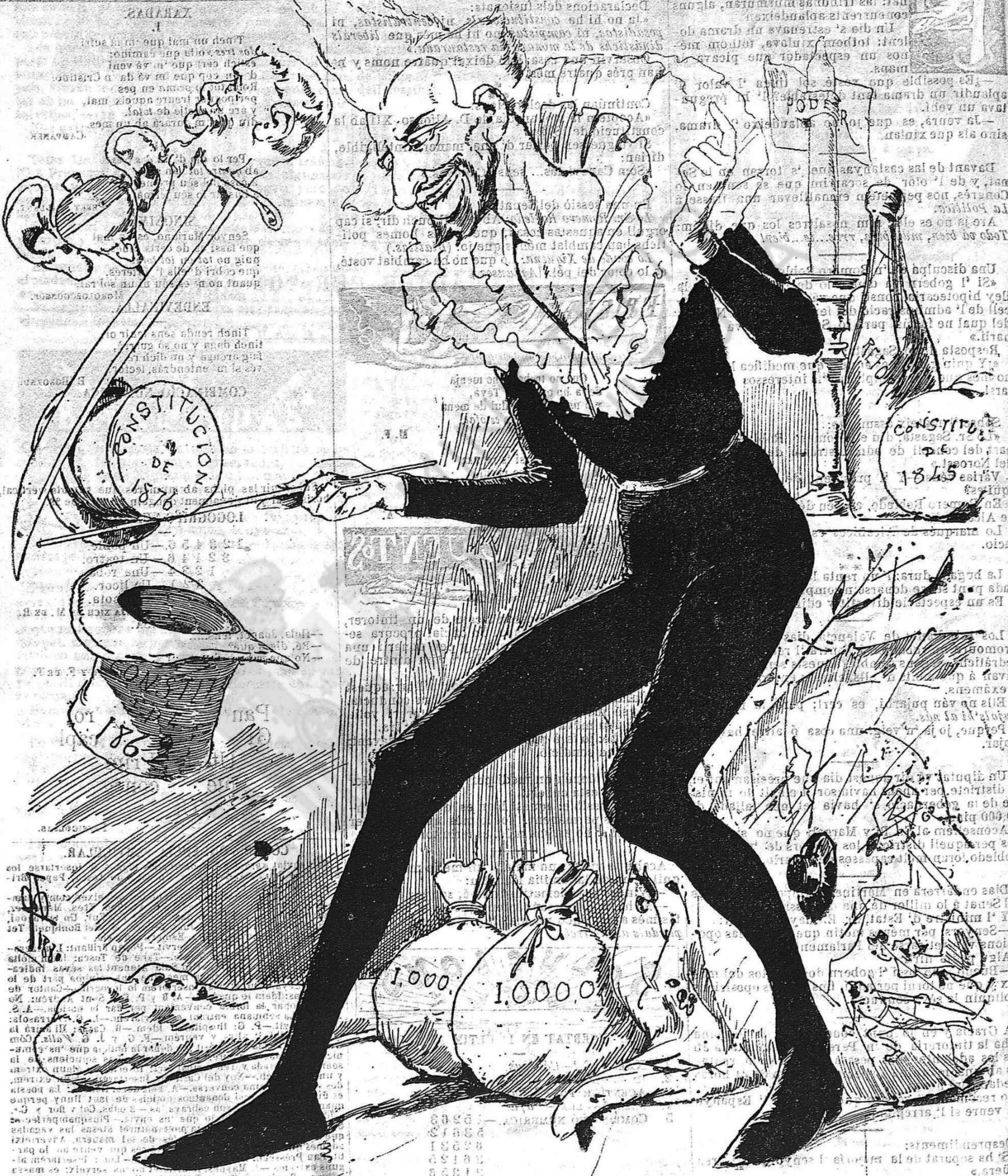
Molta habilitat! pero d' aixó á fer ballar á D. Anton encara hi ha molta distancia.