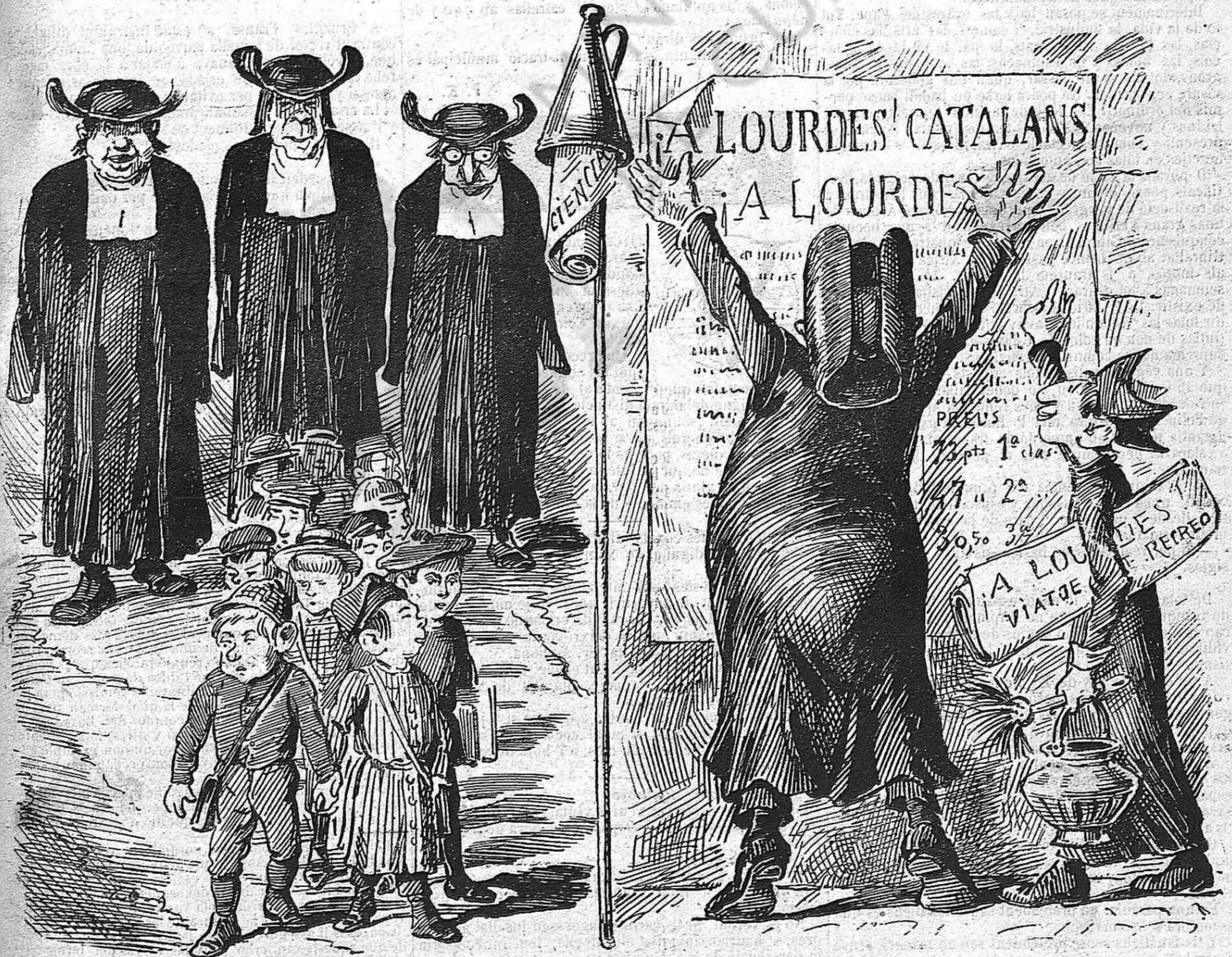
Els erian la llana y després la passejan.