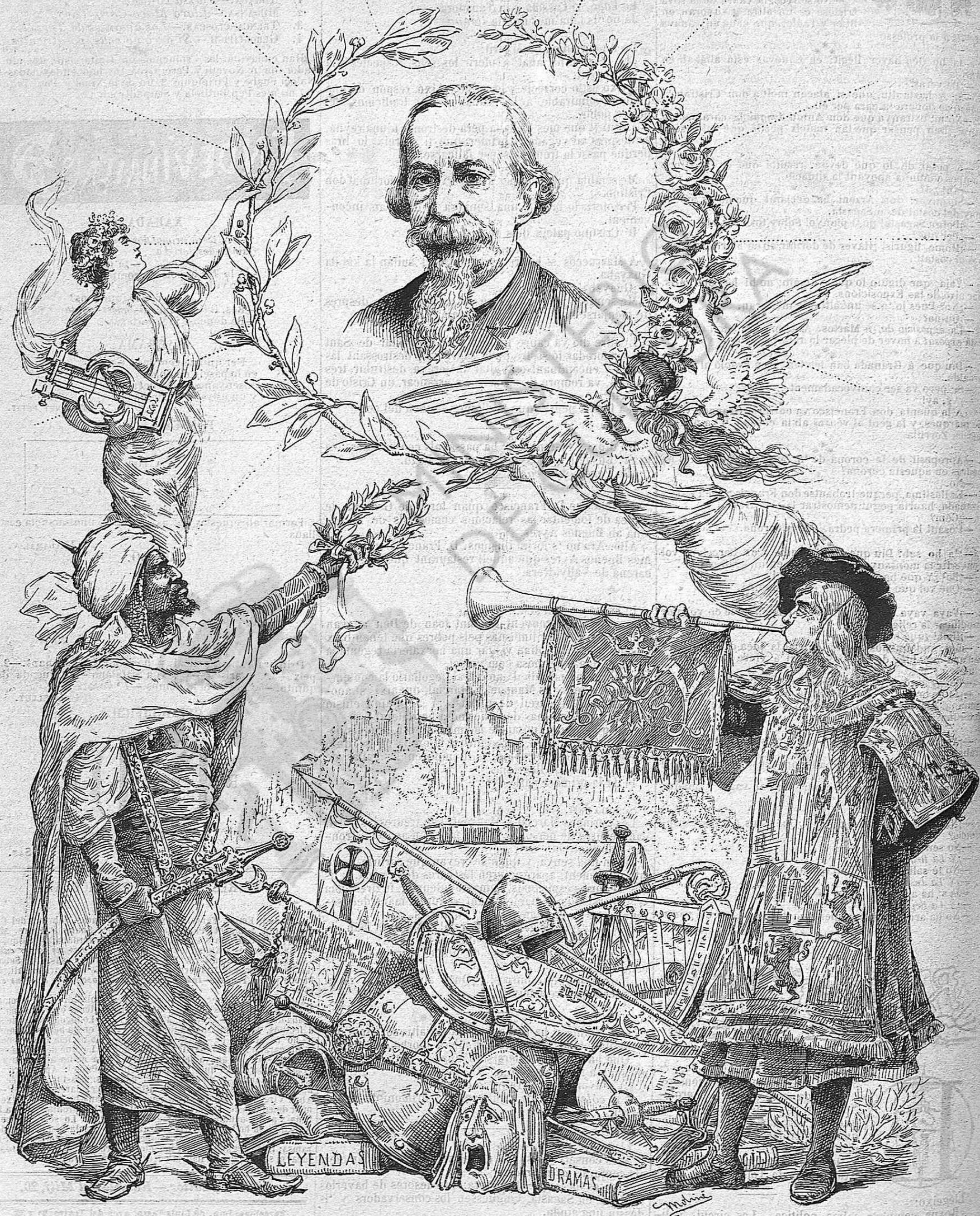
LA CAMPANA DE GRACIA envía l' expressió del seu afecte y de la seva admiració al immortal autor de D. Juan Tenorio .