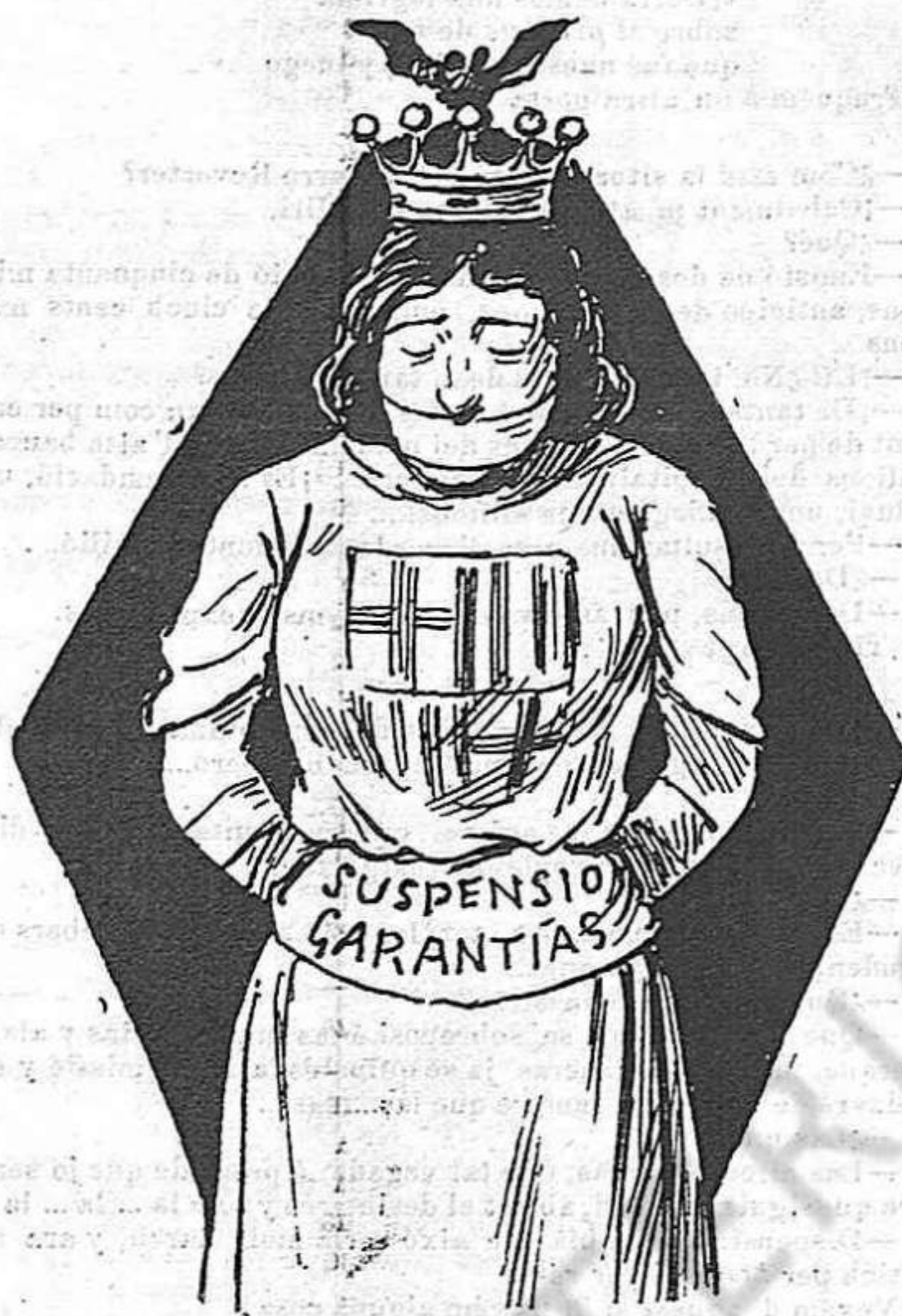
Barcelona segueix molt bé, y sense dir aquesta boca es meva.