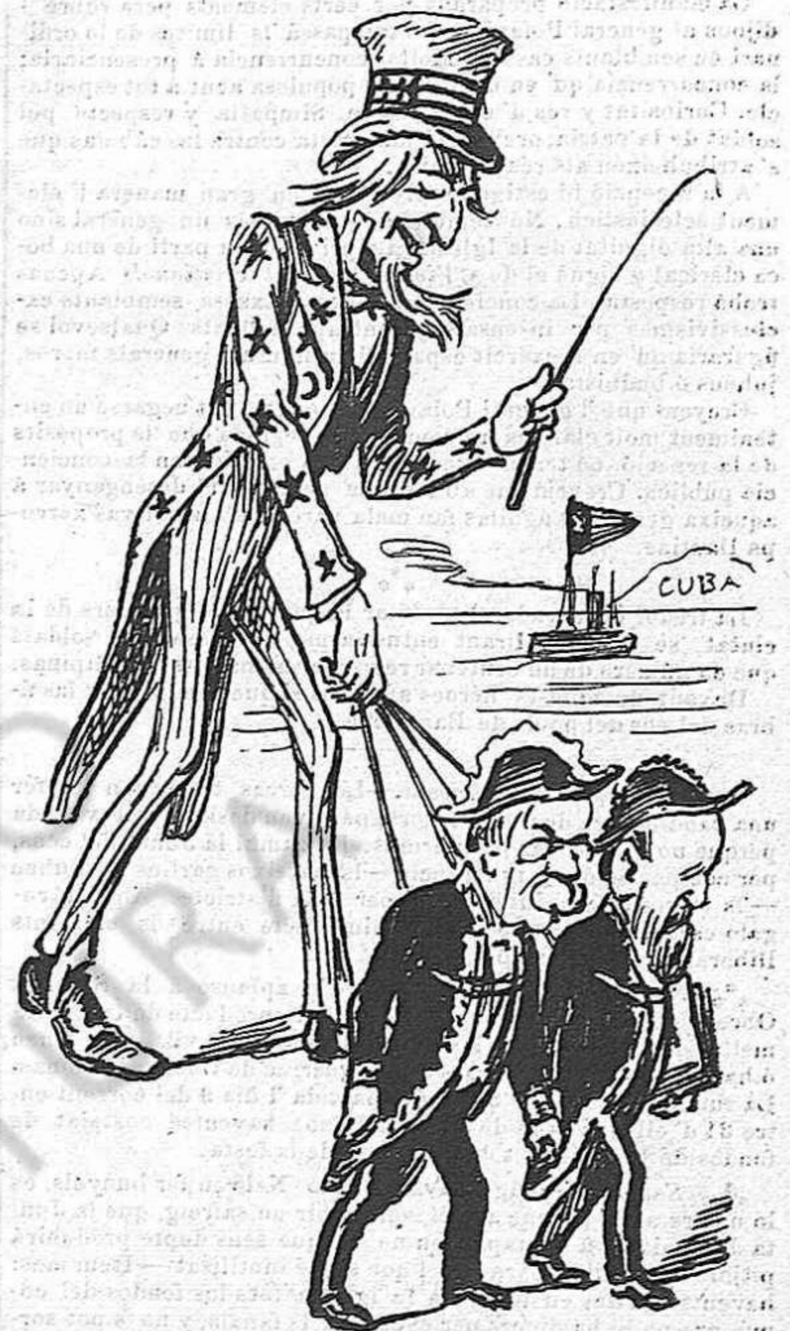
L'ayo amorós dels nostres grans polítics.

pulsat del partit republicà á causa dels seus procediments poch correctes. Algú, no obstant, va creure que posantli mitjas solas y talóns podria tornar á servir y fins proclamarse'l candidat. Aixís va ferse; pero á la primera proba ha fet ayguas.