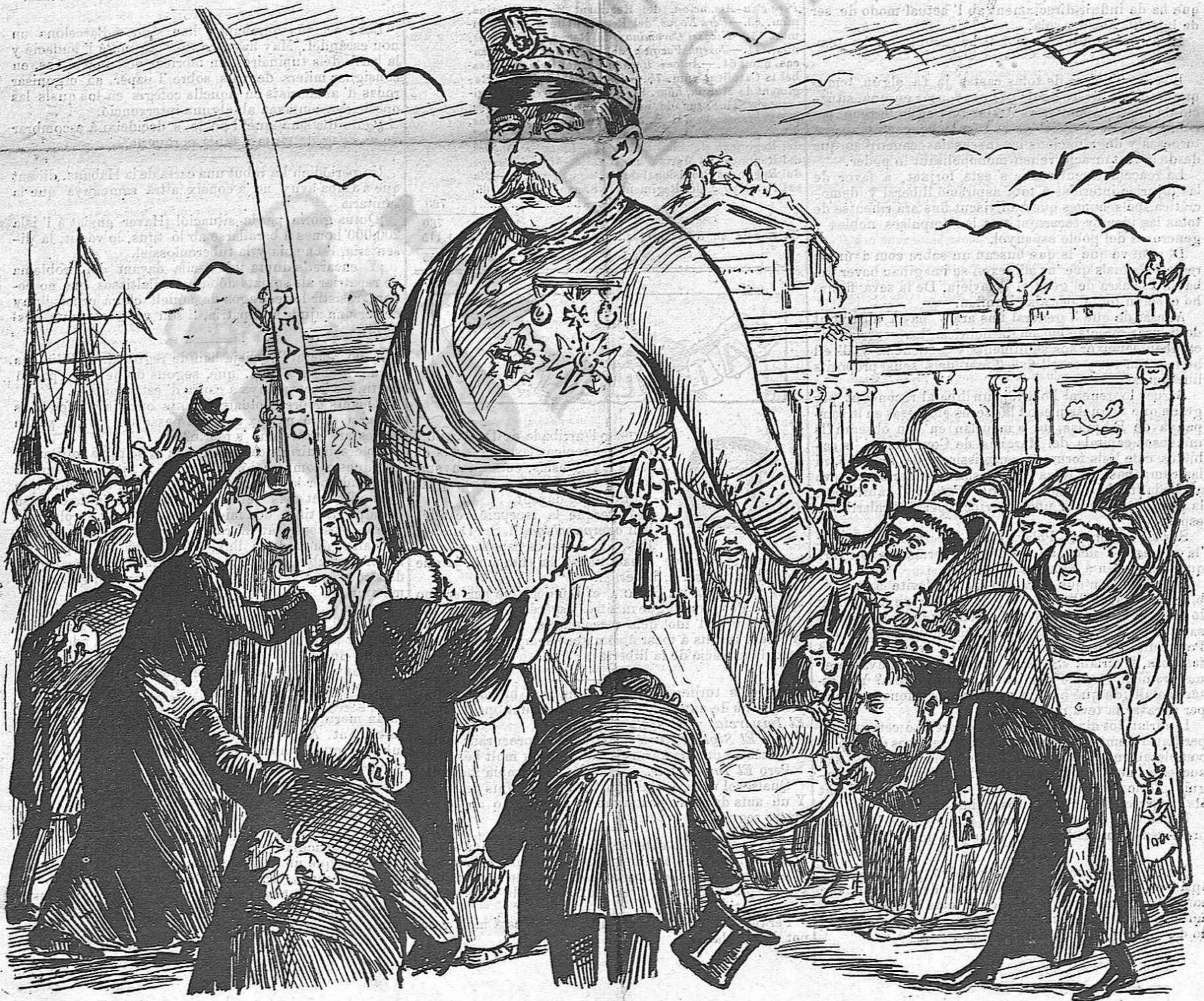
Pitjor per ell si 's deixa inflar.