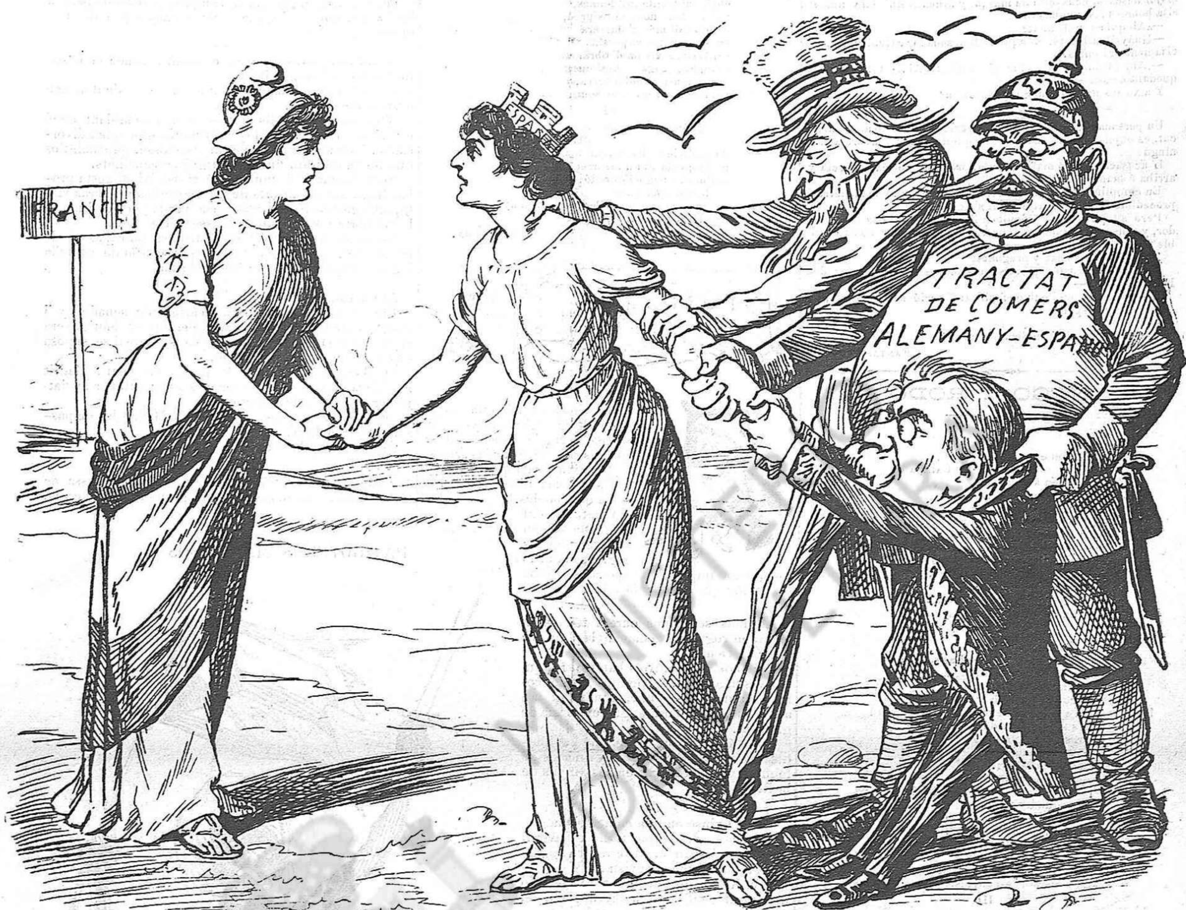
Aixó vols, aixó no haurás

S' estava celebrant una novellada, y un torero xanfis vá ferho tan malament, ab tanta torpesa y cobardia, que alguns aficionats van saltar á l' arena y allí mateix, punt en blanch, varen tallarli la coleta.