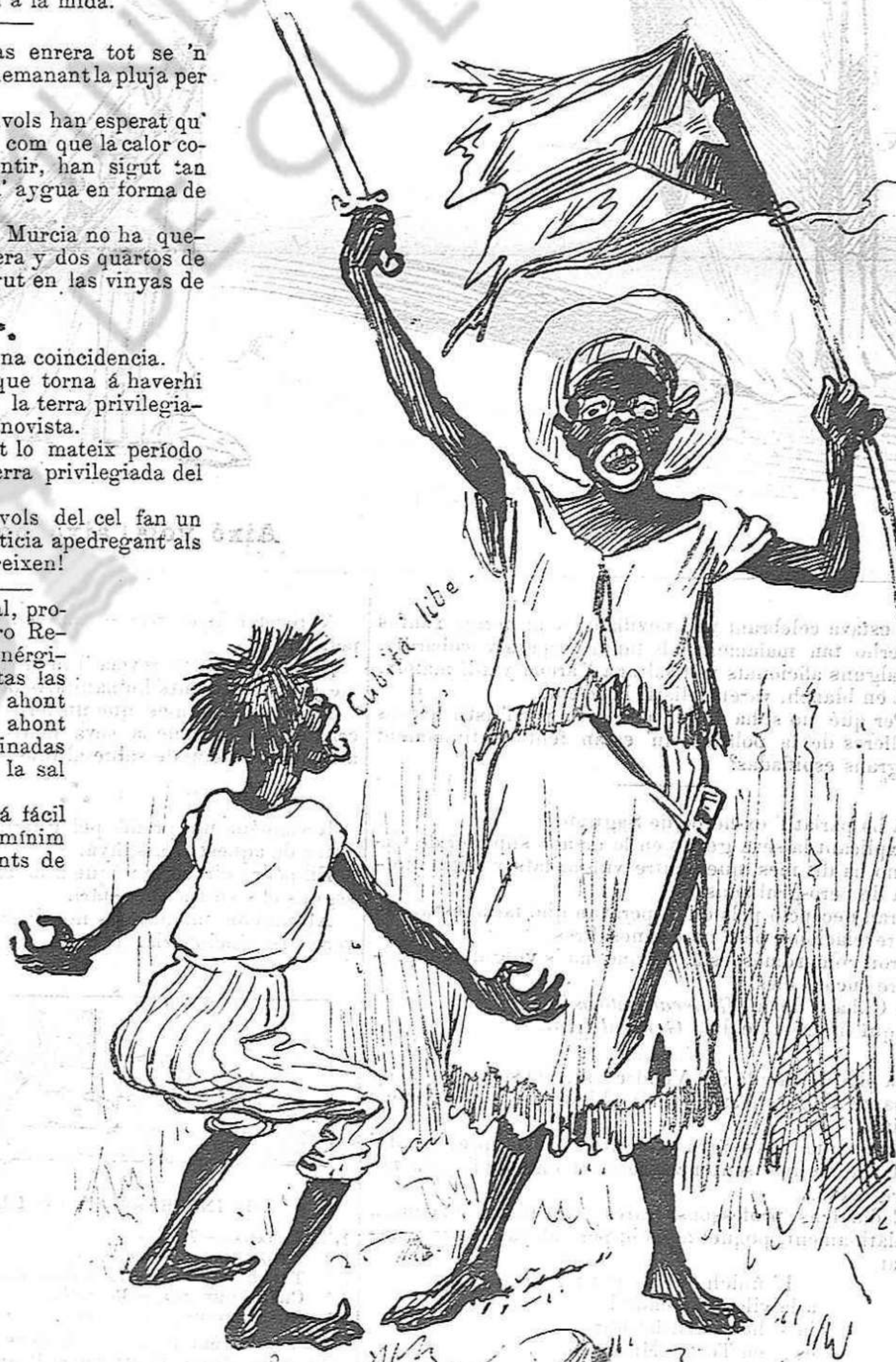
Cubita libe proclaman y tan libe la tindrán,