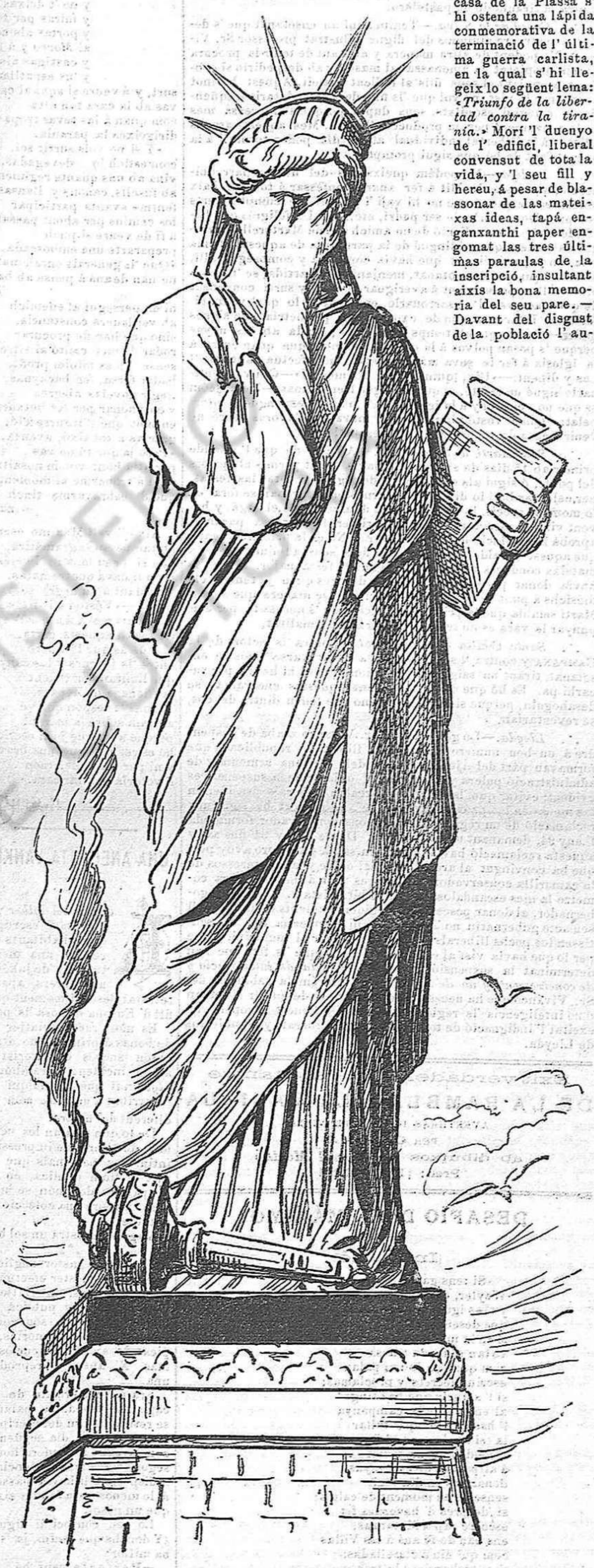
La antorxa que resplandia li ha caygut y s' ha apagat: avuy la llibertat plora los errors de un poble ingrat.

CARTAS DE FORA. — Calaf. — En una casa de la Plassa s' hi ostenta una lápida conmemorativa de la terminació de l' últi- ma guerra carlista, en la qual s' hi lle- geix lo següent lema: «Triunfo de la liber- tad contra la tira- nia.» Morí l' duenyol de l' edifici, liberal convensut de tota la vida, y l' seu fill y hereu, á pesar de bla- ssonar de las matei- xas idees, tapá en- ganxanthi paper en- gomat las tres últi- mas paraulas de la inscripció, insultant aixís la bona mem- oria del seu pare.— Davant del disgust de la població l' au-