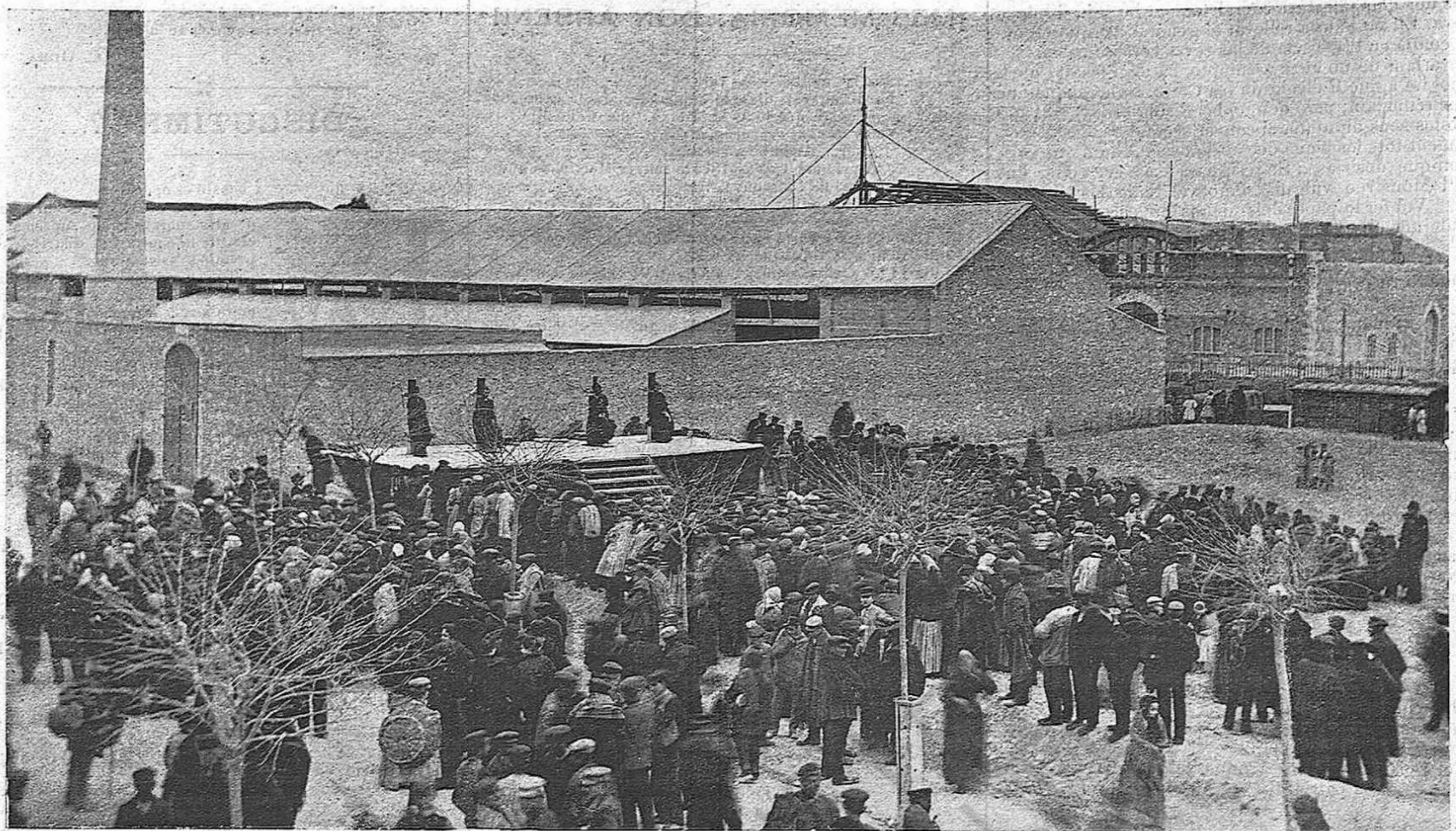
(Inst. de RUS, feta expressament per LA CAMPANA.)

VILAFRANCA DEL PANADÉS.—Lo camp de 'n Sariols, poch després de la execució dels reos de Sta. Maria de Foix.