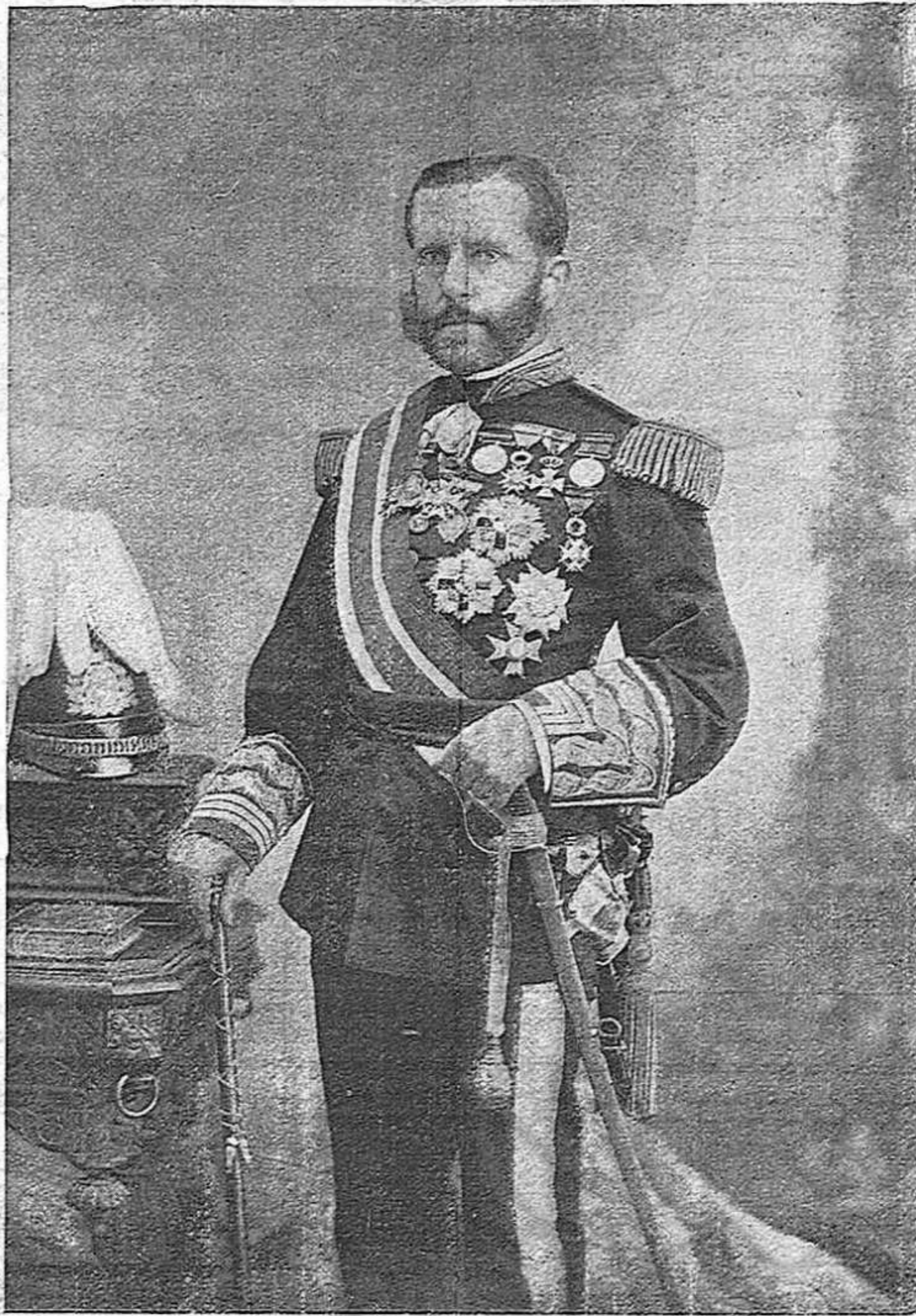
EXCM. SR. D. VALERIA WEYLER, gobernador general de la Isla de Cuba, y general en jefe del exèrcit de operaciones

Confessi tots aquests pecats: proclami en veu alta que la seva vida pública es una serie de faltas irrepa- rables, quals conseqüències pesan sobre'l país y lla- vors no tindrém cap inconvenient en dir: