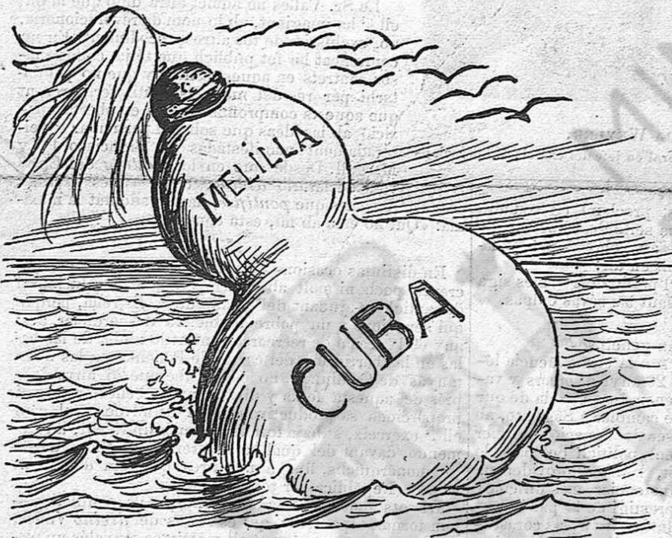
La tornada de 'n Titó.