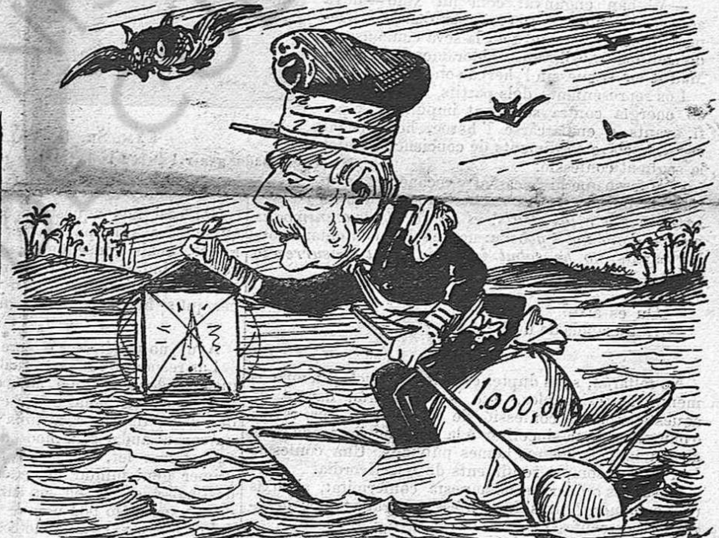
Ja que no fá res, sería convenient enviarlo á Cuba en busca dels barcos que han de vigilar las costas.