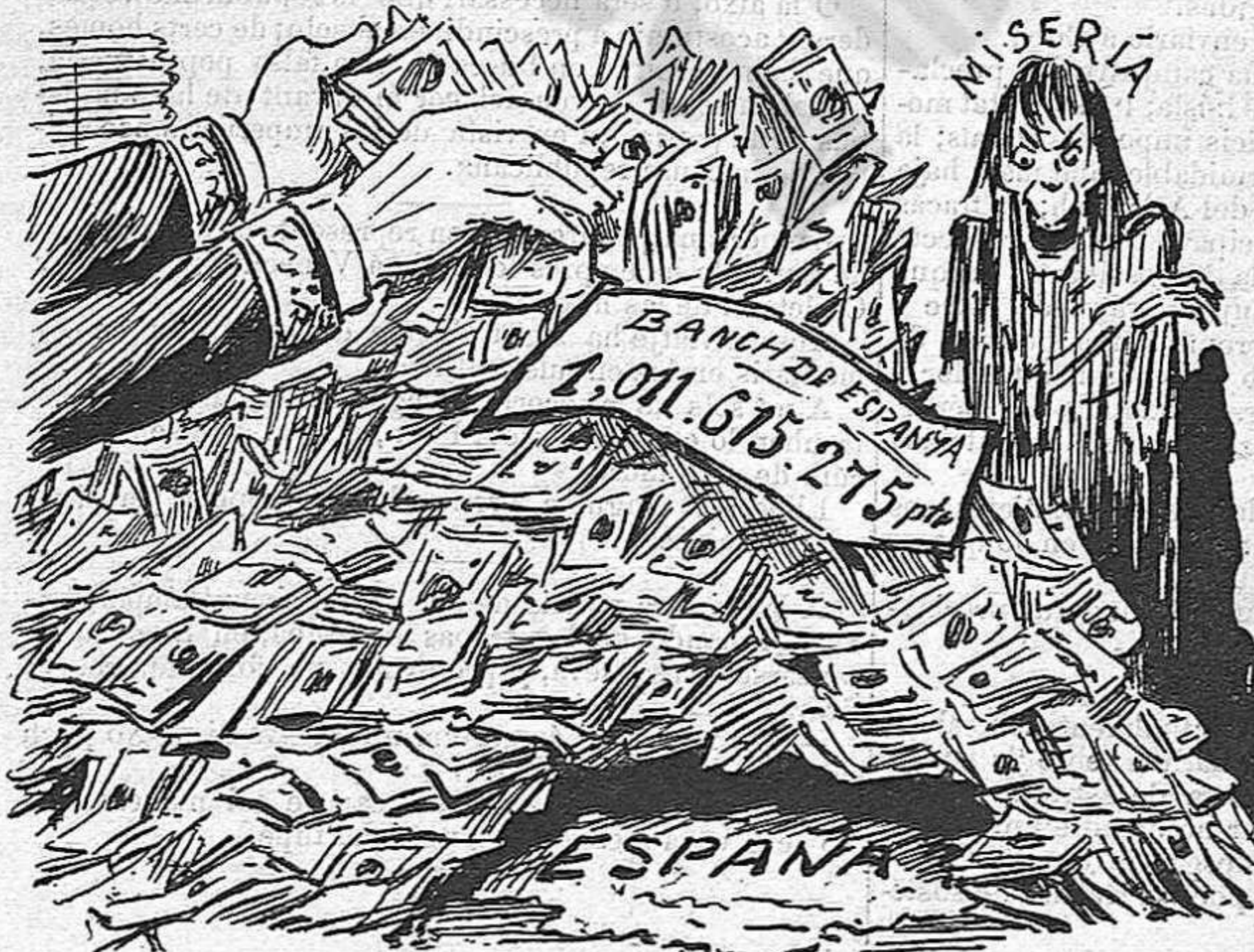
Inundació pernanent, que acabarà per ofegar á la pobra Espanya.