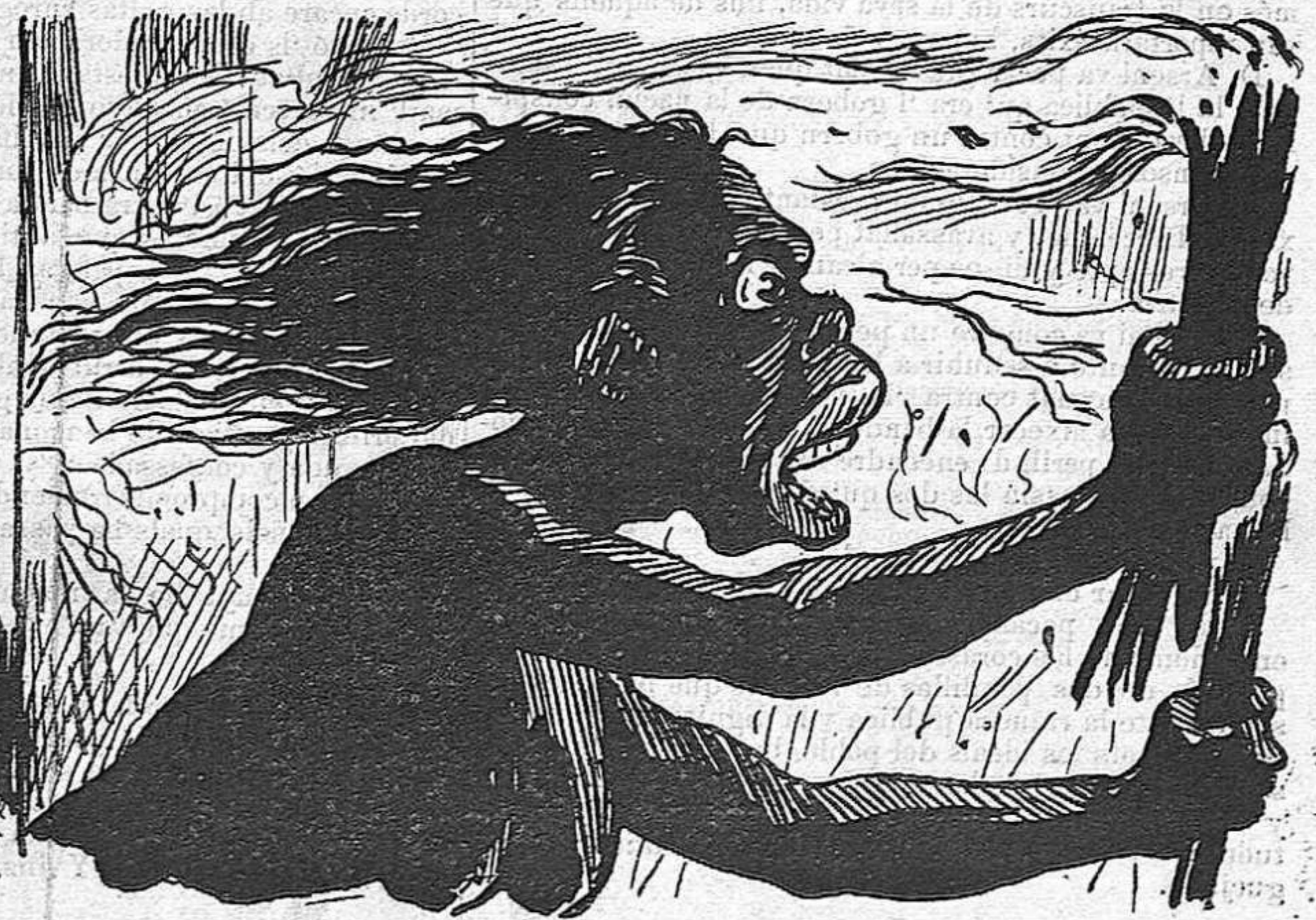
¡¡Aixís ho ha deixat!!