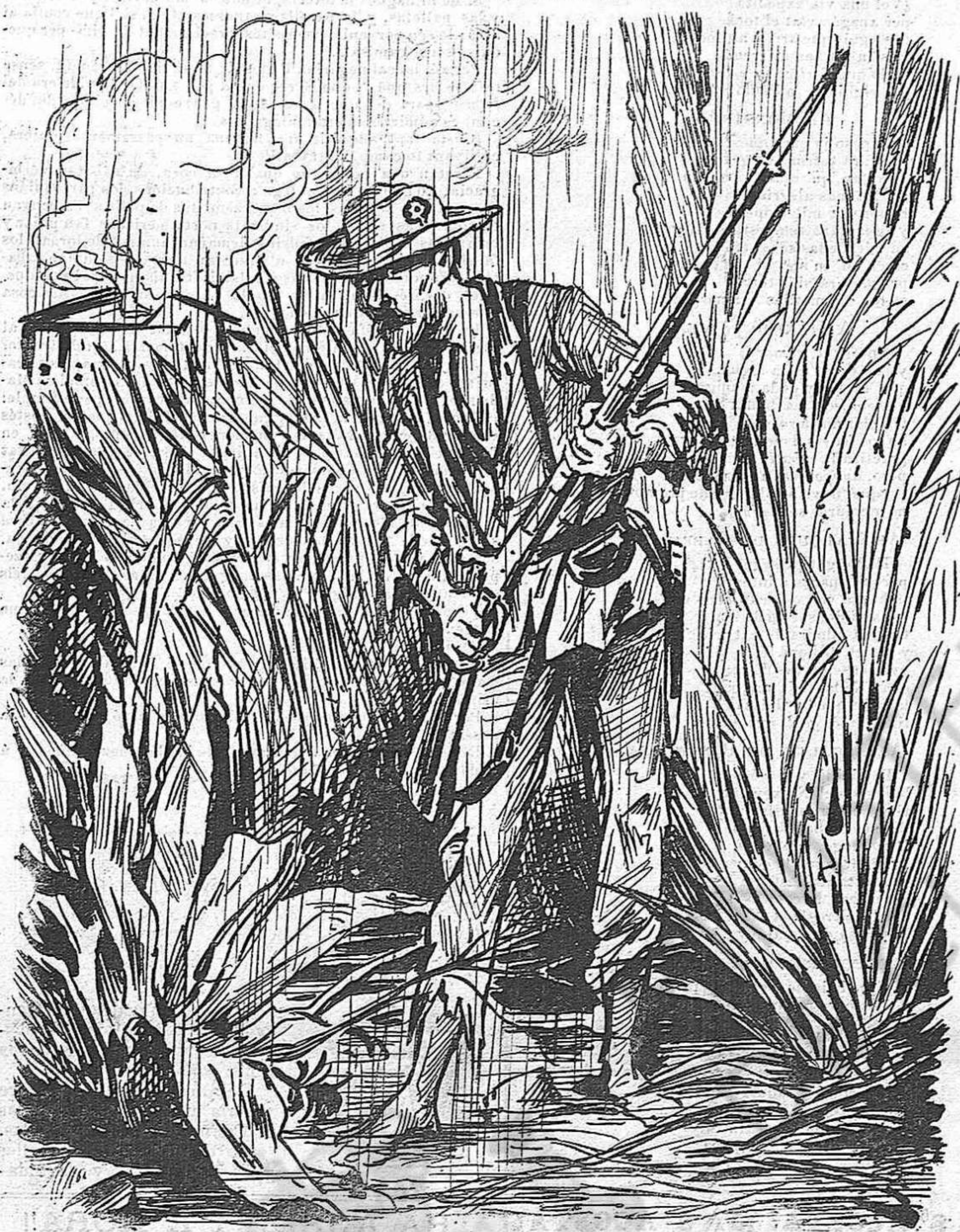
Espanyols: recordemnos dels héroes de la patria.

ment gran alegria entre 'ls rivals y 'ls padrins al xaruparse amistosament lo contingut de las botellas.