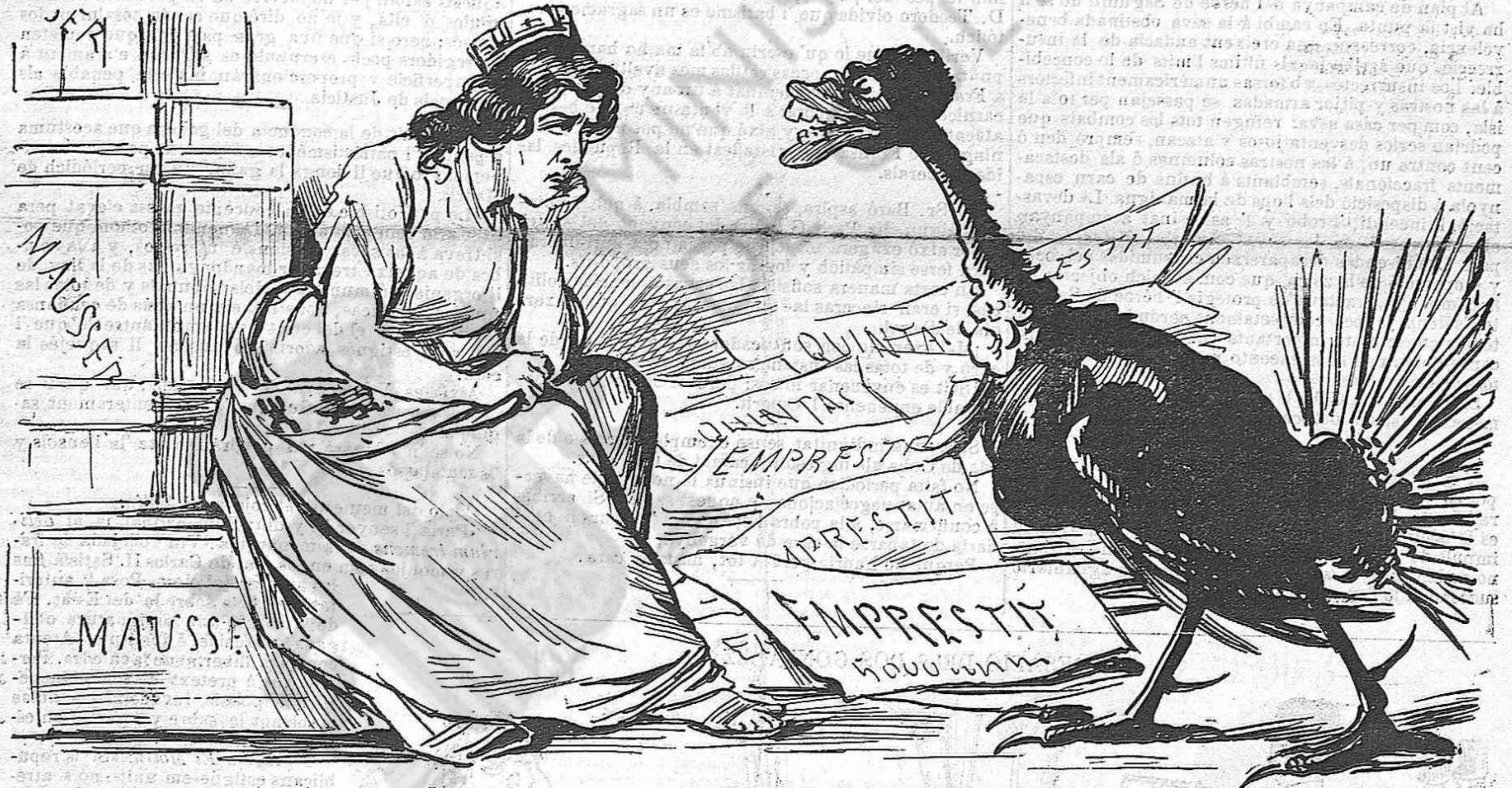
Las décimas, el gall y 'ls turróns que li regalan aquest any.