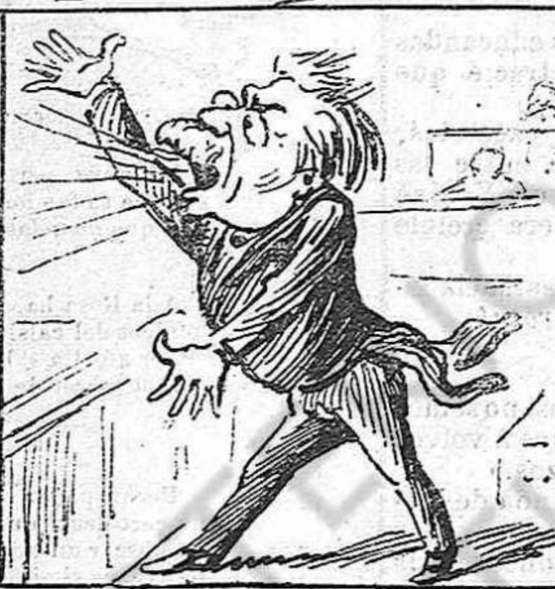
Pero'l mónstruo li arma un vol y diu ab tota la boca que lo que allí passa es molt.