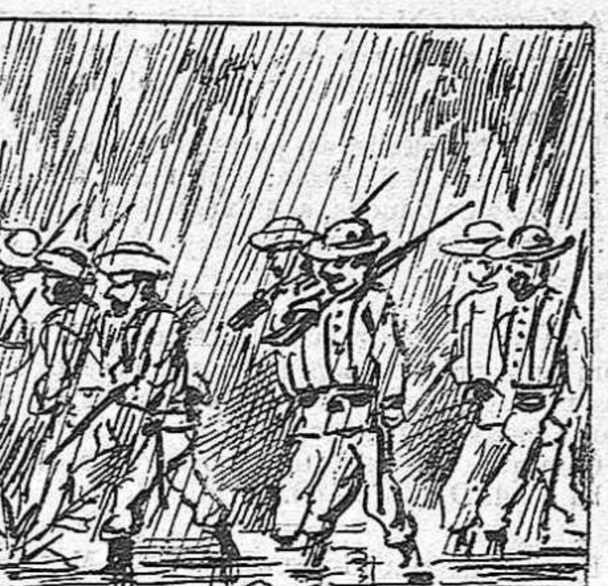
Vé l' época de la pluja, y las tropas espanyolas fan com los de Sanahuja.