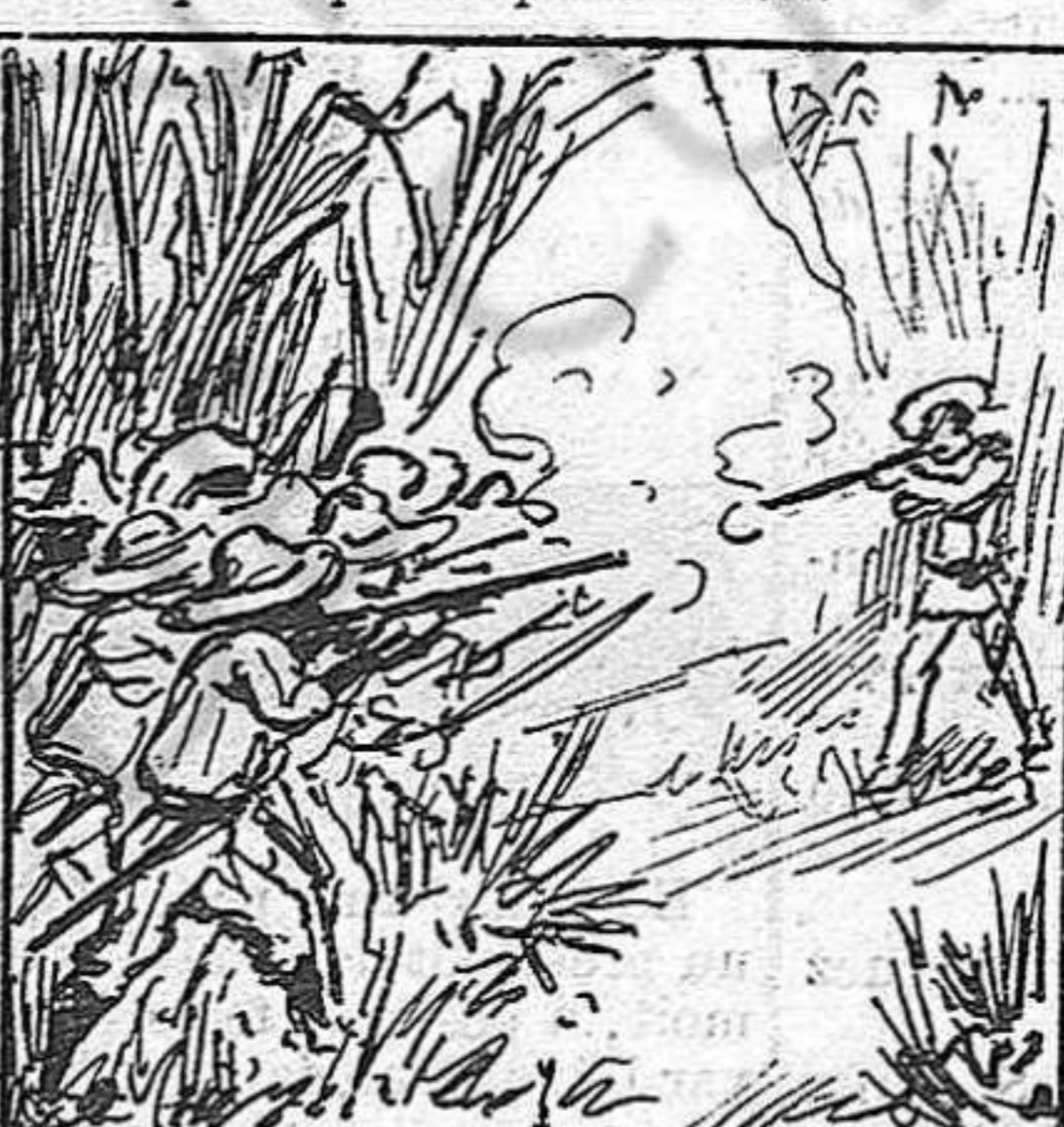
Quan veuhen sol a un soldat, los mambissos l' embesteixen ab boja temeritat.