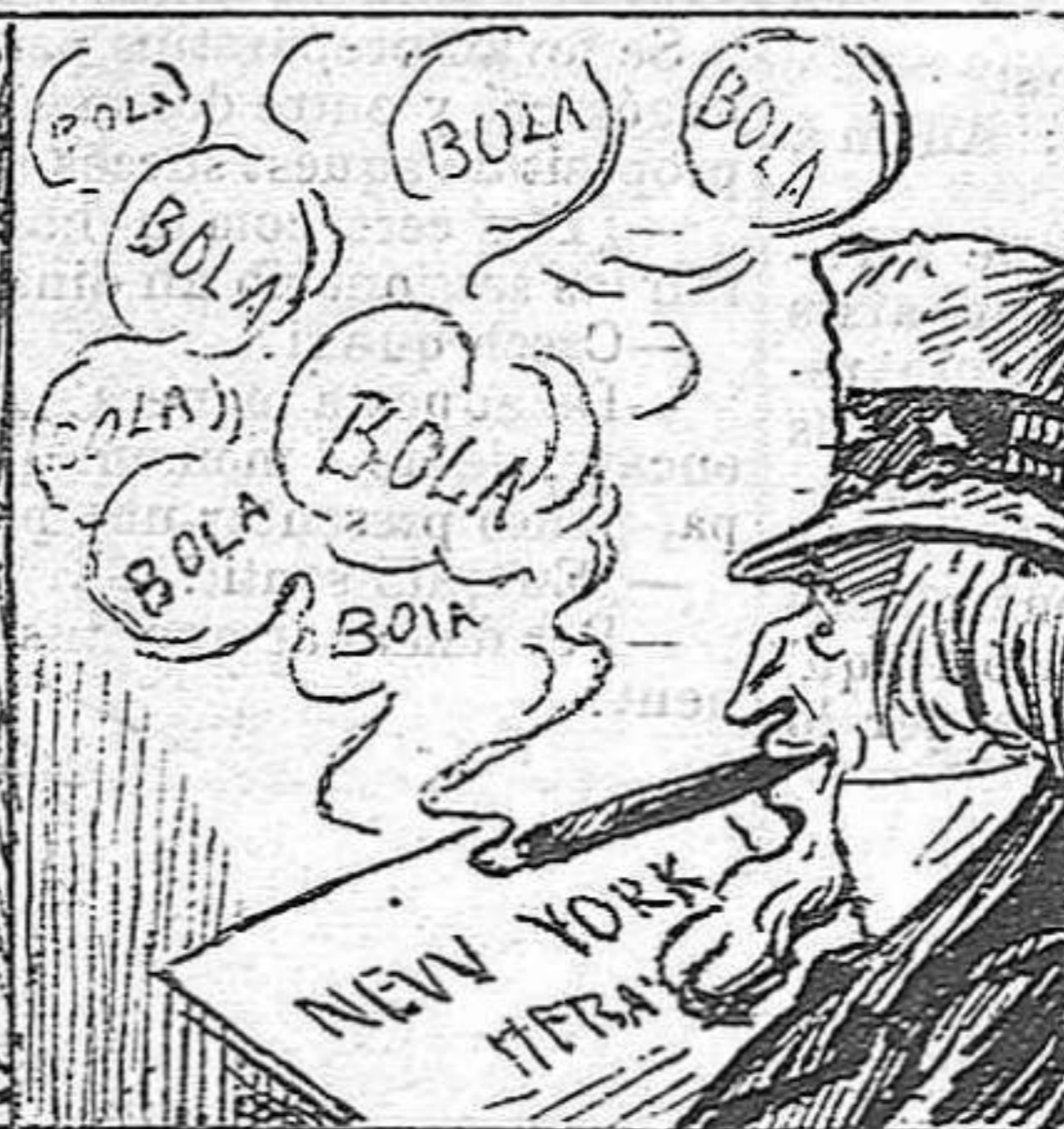
La gent nort-americana no fa sino escampar bolas de la insurrecció cubana.