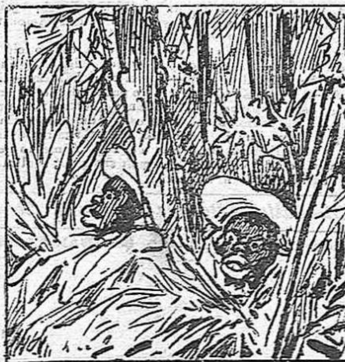
Resguardantse dels perills, los insurrectes s' amagèn pel bosc igual que conills.