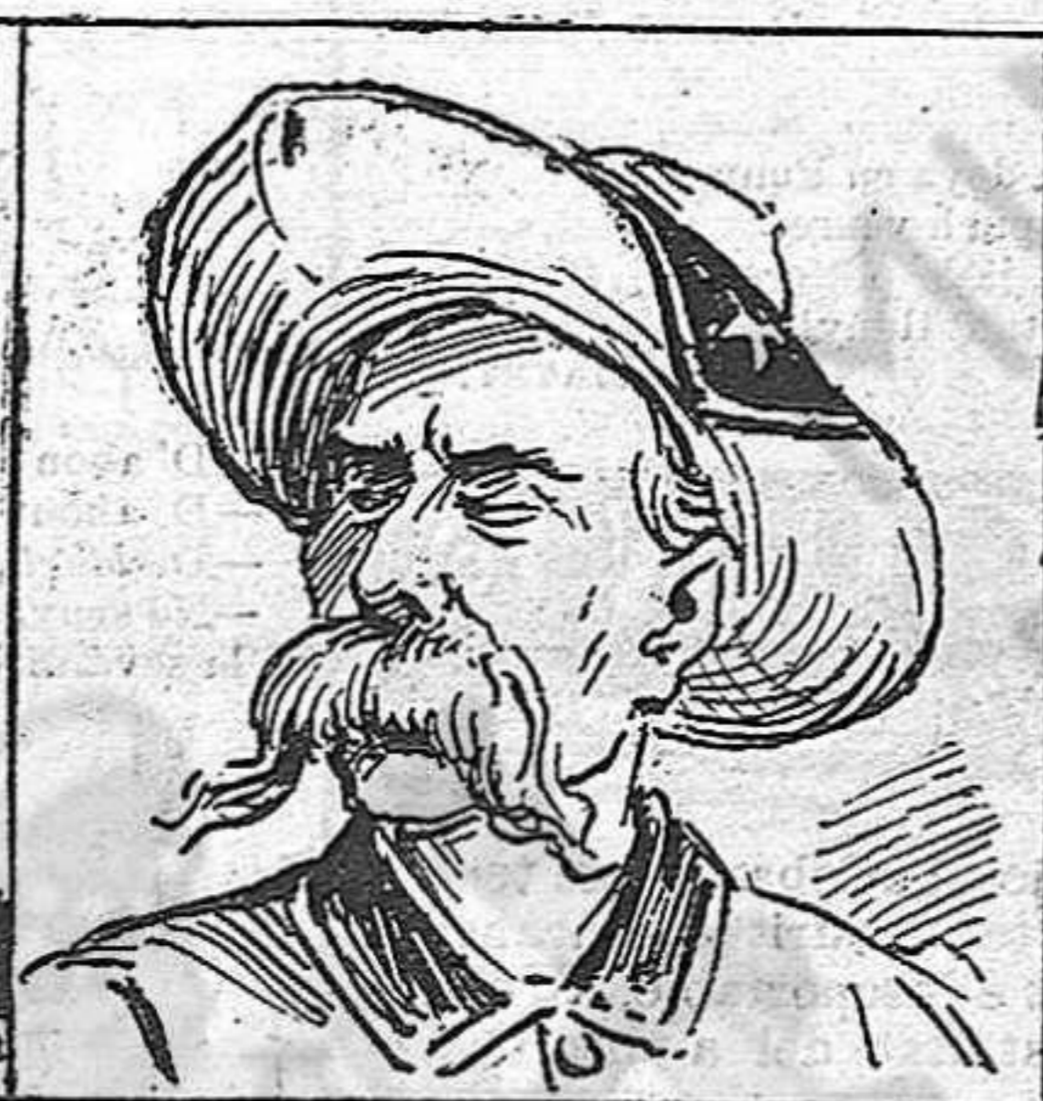
En Gómez, un altre tío que a briga la pretensió de ferse amo d' aquell llo.