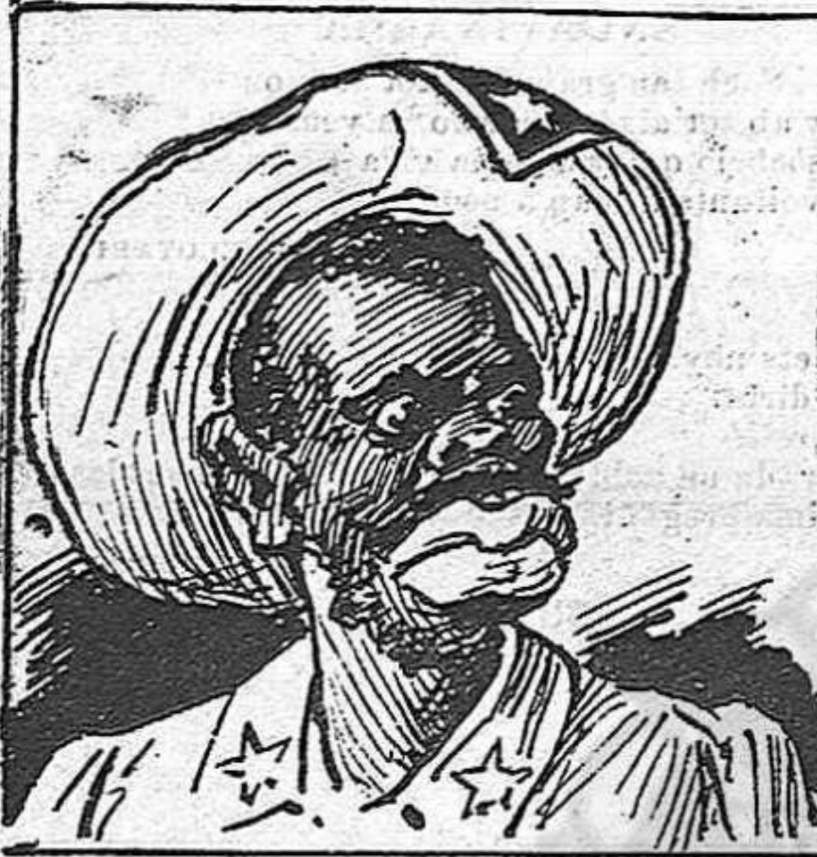
En Maceo, general de la cuadrilla insurrecta de la provincia Oriental.