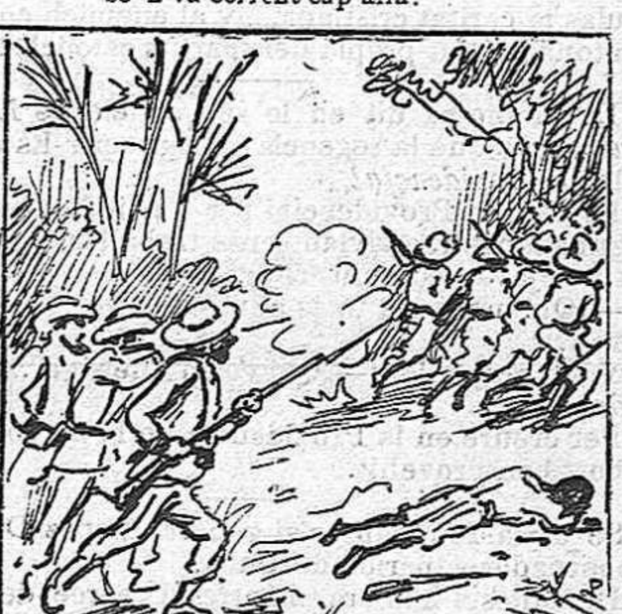
Pero quan ne troban tres, encara qu' ells siguin mil ja no s' deturan per res.