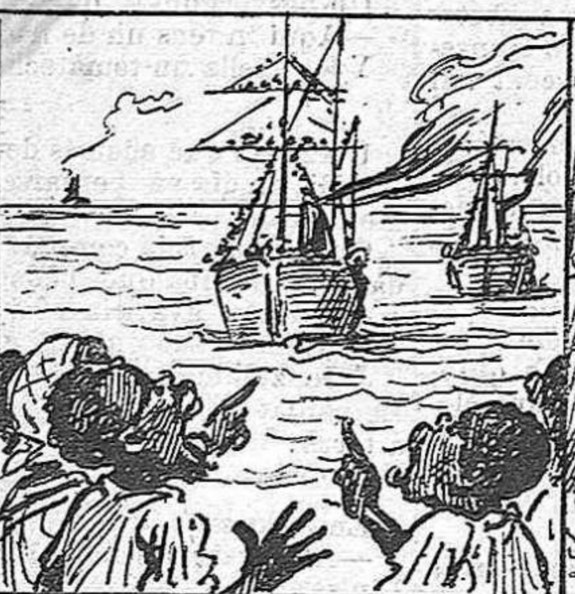
Los negres, fets uns babaus, al veure tanta gent nova, de negres se tornan blaus.