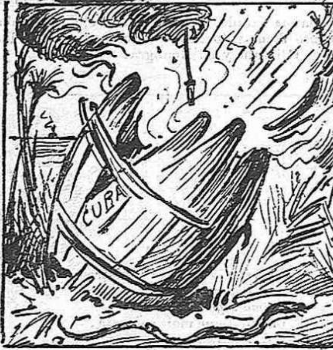
Com pedrada al mitj del ull, ens cau damunt la notícia de que Cuba e-stá que bull.