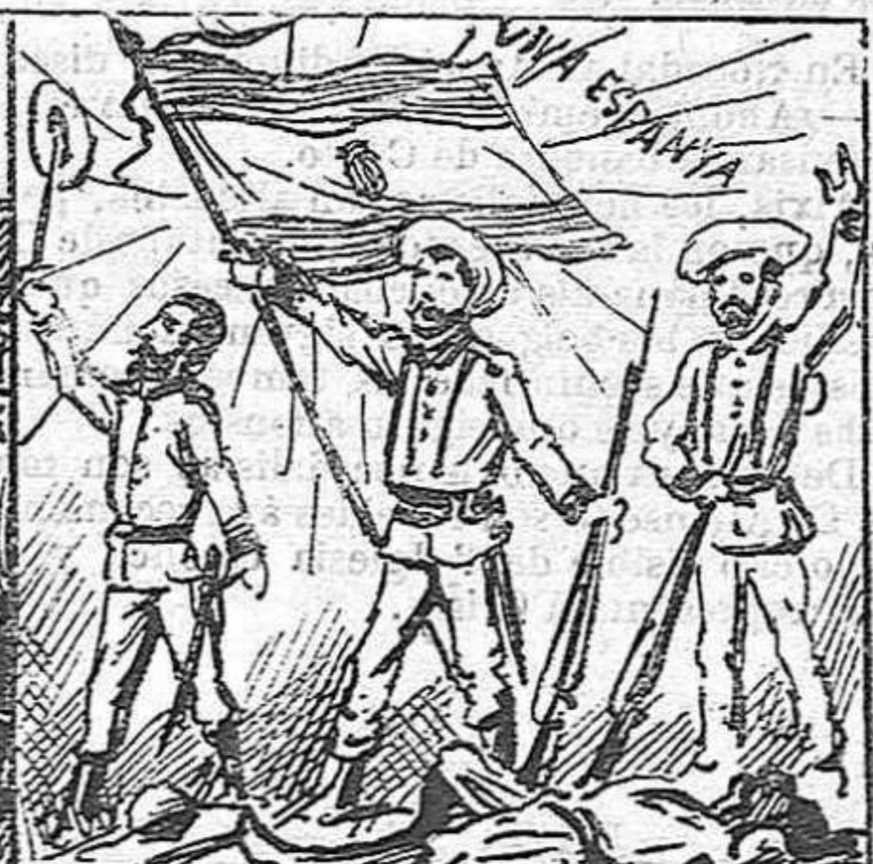
Pero'l nostre altiu pendó s' alsa rodejat de gloria dominant la insurrecció.