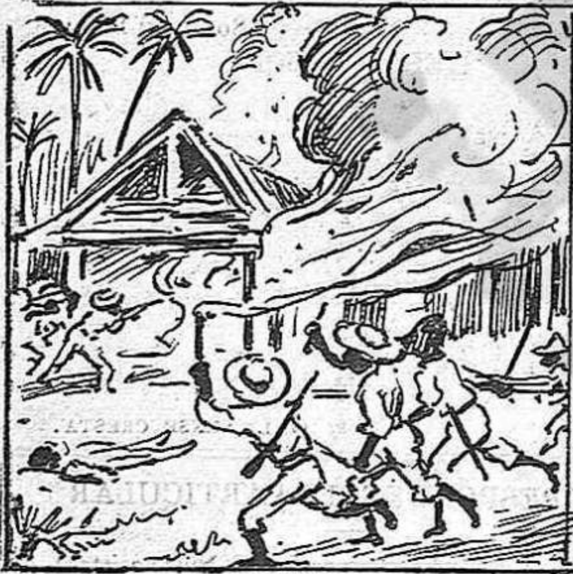
En arribant a algún lloch hont hi haja gent indefensa per fer broma hi calan foch.