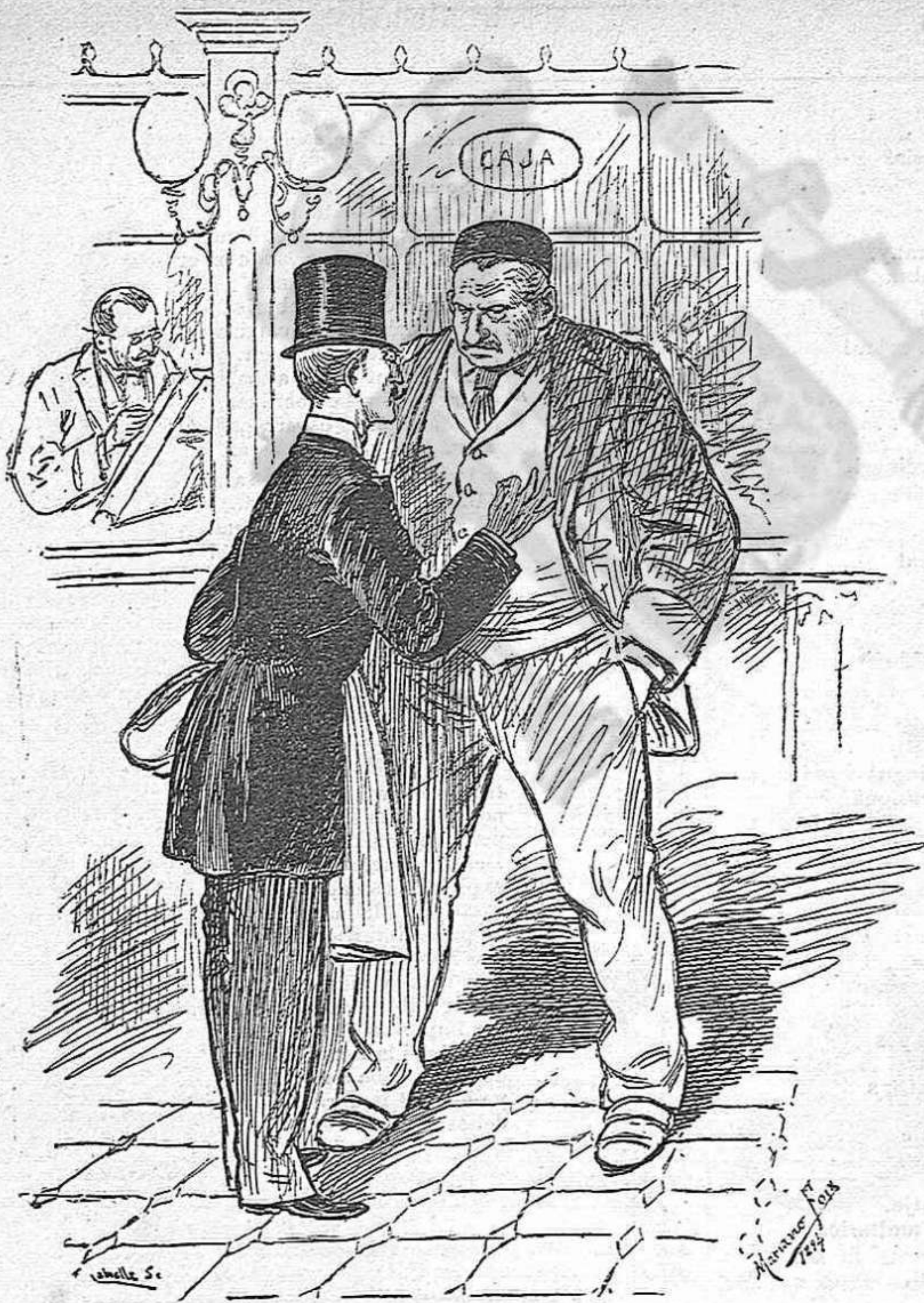
—Si vol que aquest negoci li prosperi, encengui una llantia á Santa Angelita y no hi planyi l' oli.

deixan sentir la séva veu au- torisada recullint los aplausos mes entusiastas, quan procla- man la necessitat de la unió re- publicana. Desde París s' anun- cia la publicació de un mani- fest de 'n Ruiz Zorrilla enco- miant també la idea de la unió. Y un núcleo de joves, vinguts á la vida pública, sense com- promisos personals de cap mena, sense ressabis qu' en- torpeixin l' impuls de las sévas aspiracions sincerament repu- blicanas se disposan á reunir- se en Asamblea pera procla- mar la necessitat, ja desde avuy, irresistible, de una re- fundició vigorosa de tots los elements que aspirin á la im- plantació de la República es- panyola.