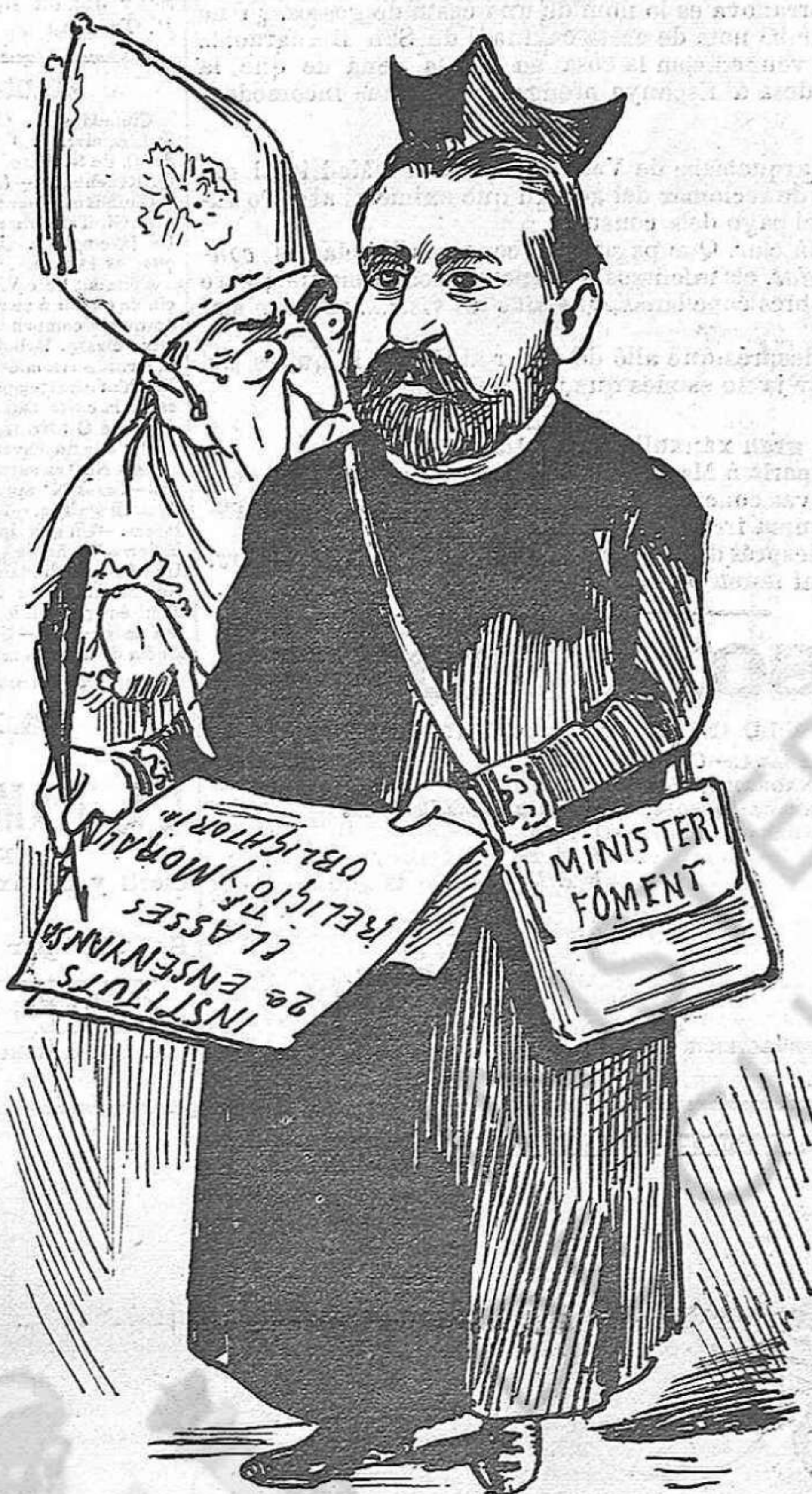
¡Ay hereus dels progressistas quinas cosas feu mes tristas!

Vos que 'ns feu venir la nona escampant dolsa quietut, y 'ns safeu de fer la feyna, que se 'ns vé tant costa amunt, feu que 'ls pares de la patria s' endormísquin un á un, que pobrets bé s' ho mereixen puig no poden dir Jesús.