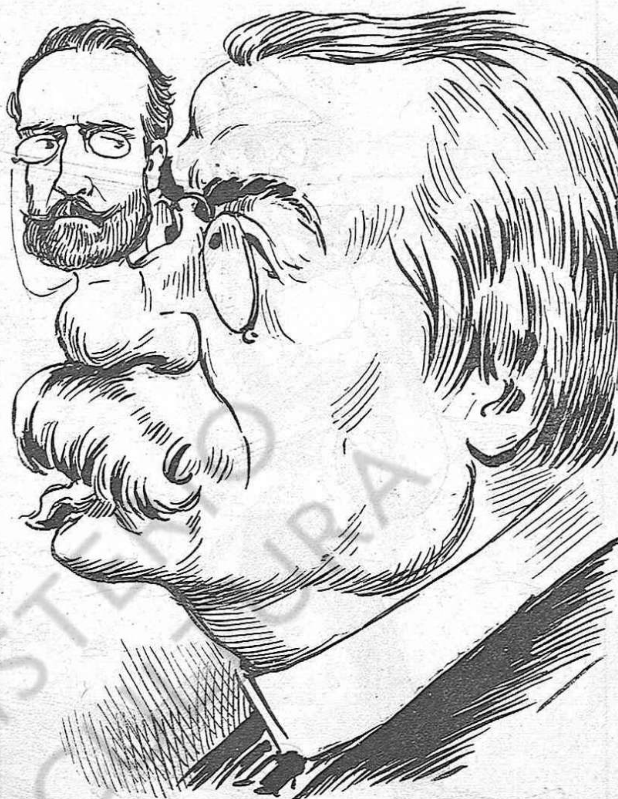
Al pobre Antonet li ha sortit un mal grà que no 'l deixa viure.