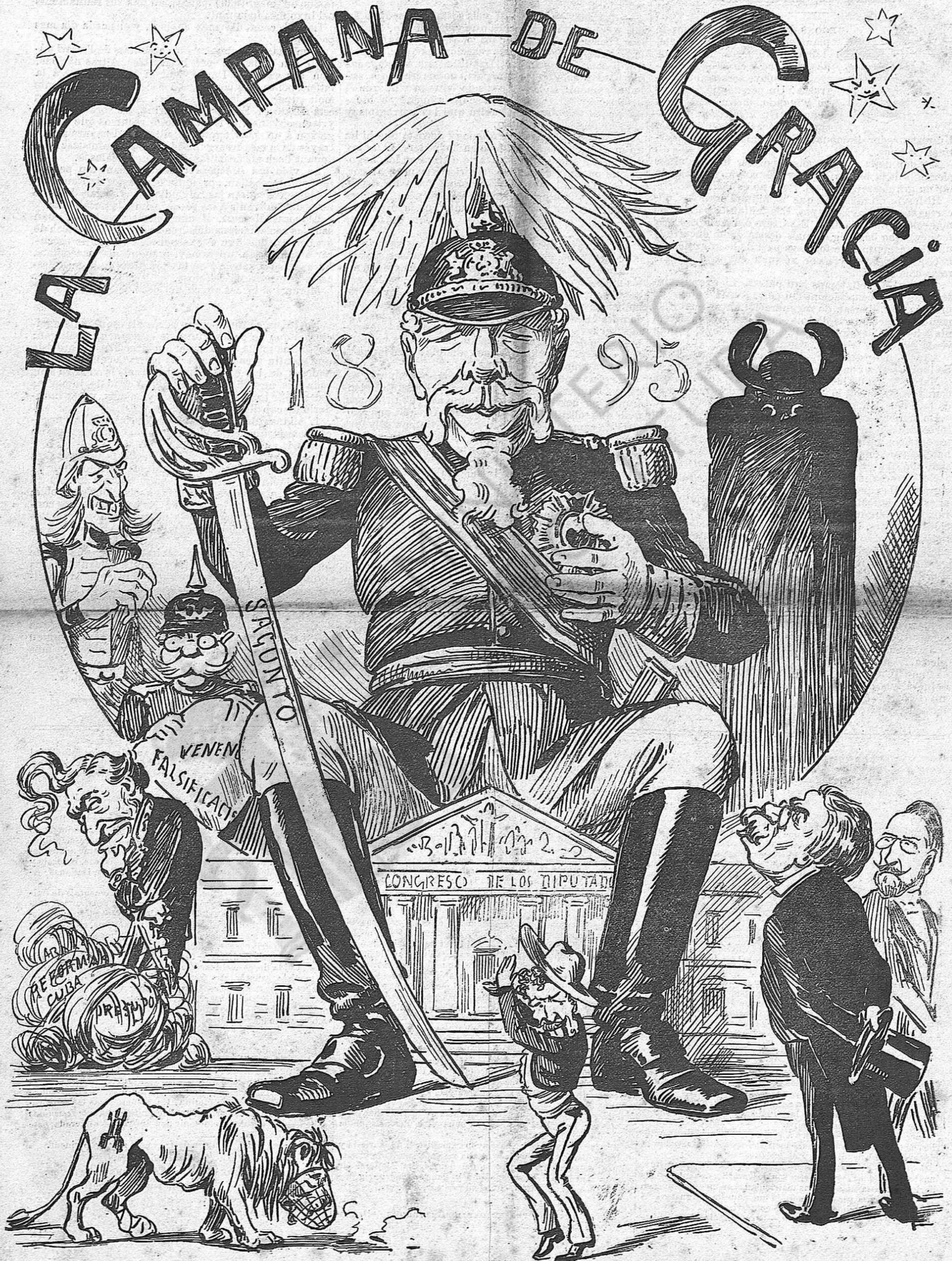
Marte Saguntí, lo planeta de aquest any.