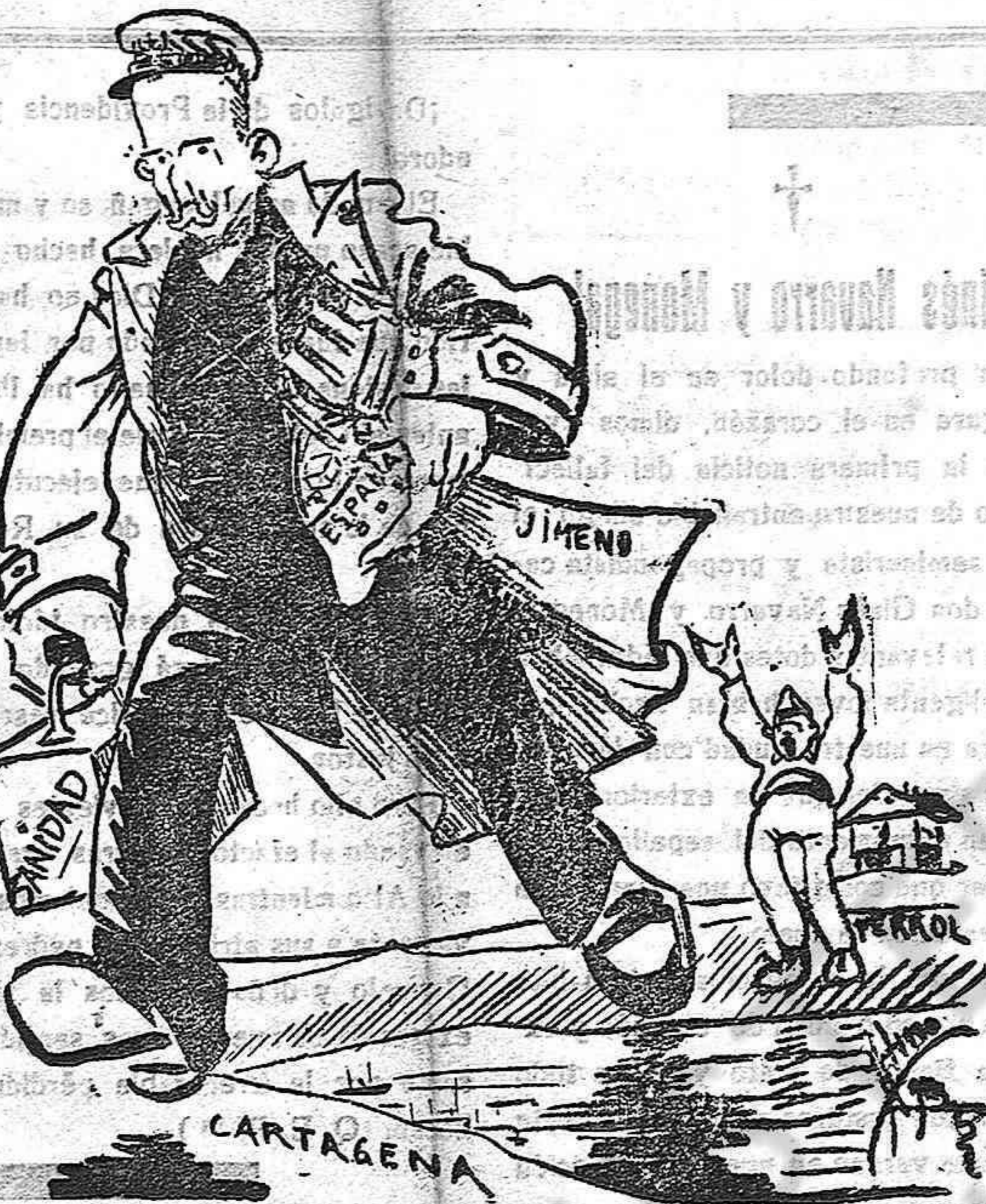
¿Eh? ¿qué? Yo demostraré que sin cañones también se pueden revistar.

hoy se lanza a reclamar del país que exija responsabilidades por cuanto ocurre en Marruecos y en ello haya culpabilidad en nuestros gobernantes.