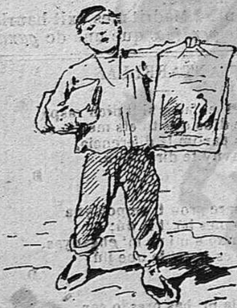
—Fá un mes venia La Campana.