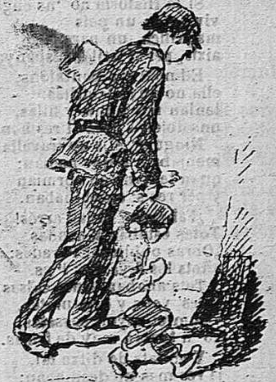
—Lo portan á la presó.