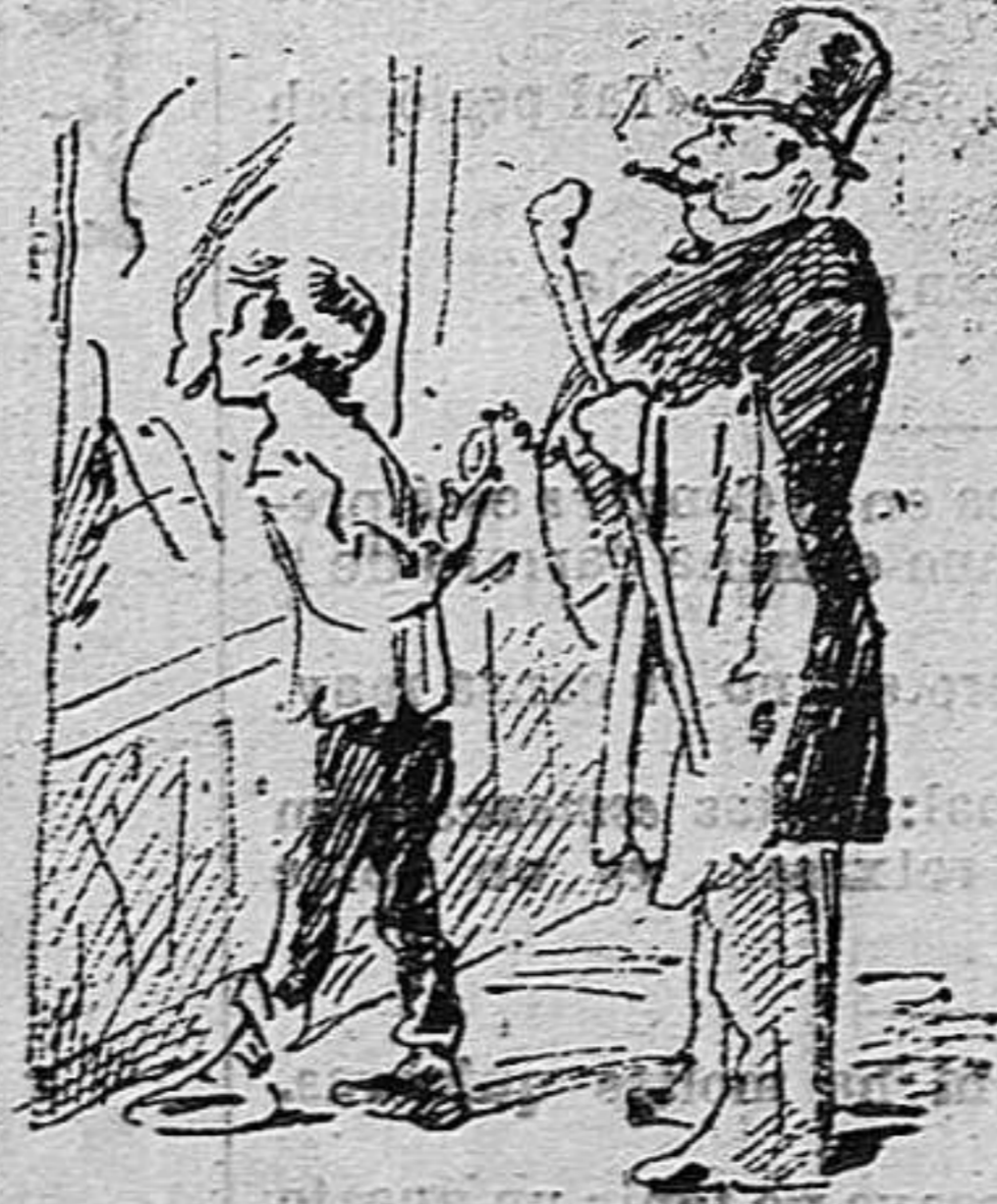
—Al dissapte vinent ja n' ha sortit.