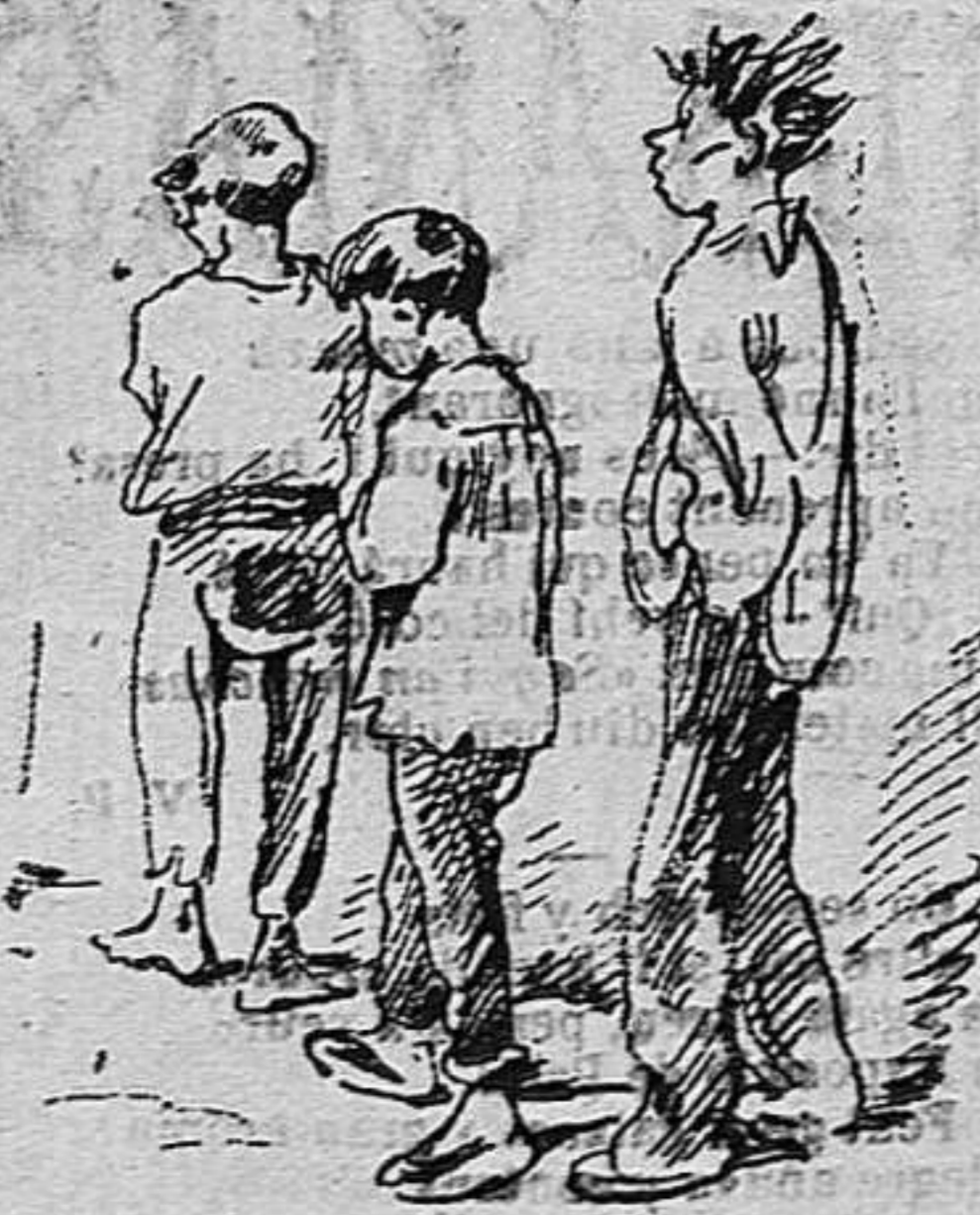
—A la presó vá á missa ab los senyorets albergats.