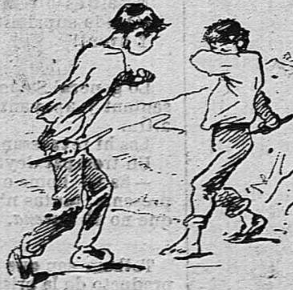
—Y escarmentat ja no ven La Campana.