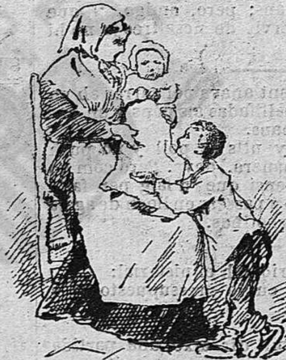
—Ab lo cual ajudava á la séva mare.