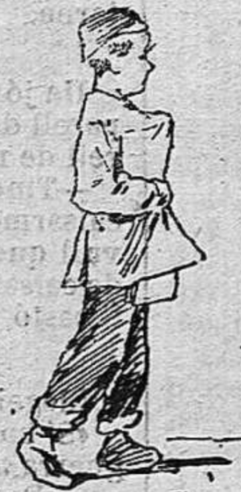
—La repartia á domicili.