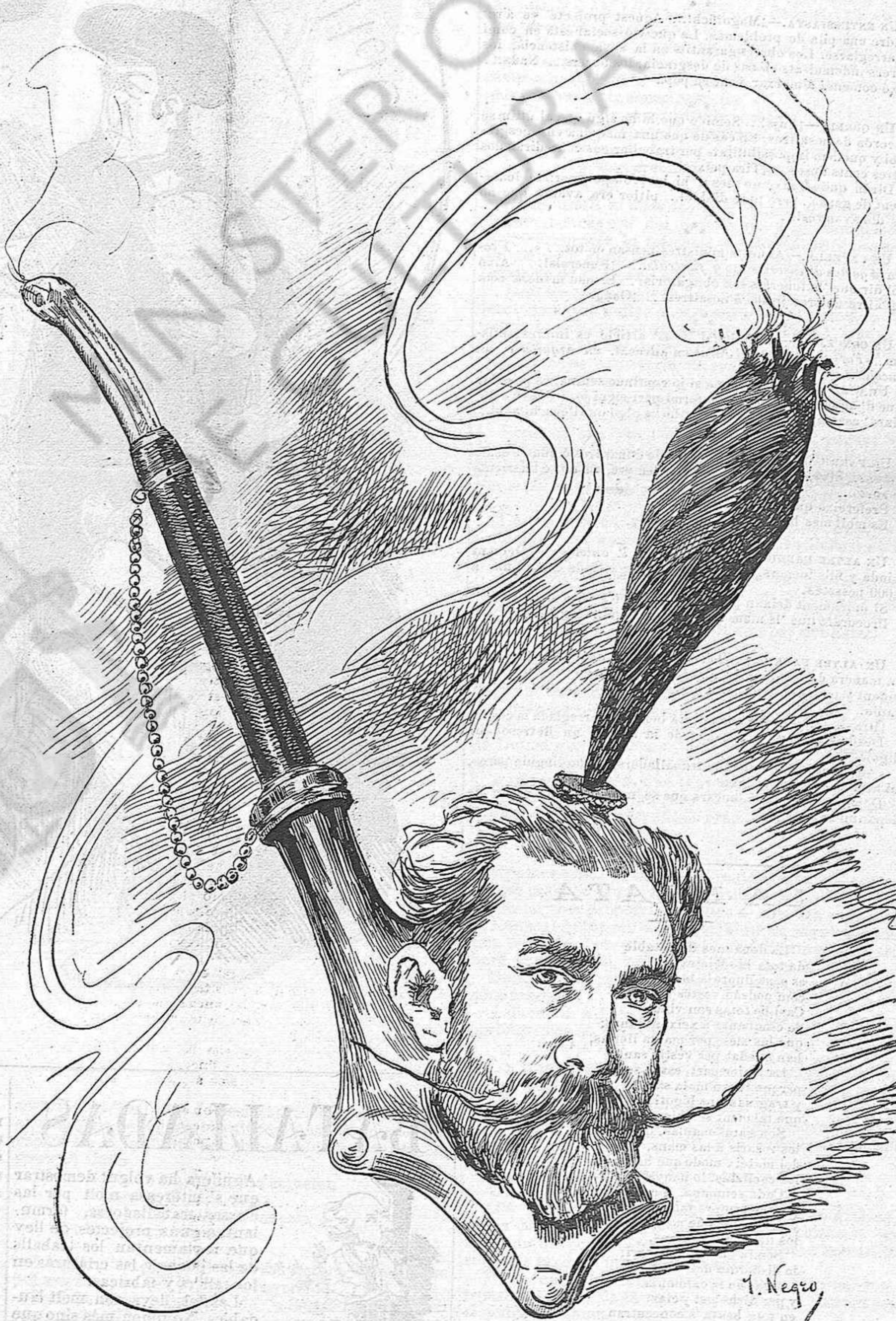
Lo gran Amós lo qui tira á perdre al contribuyent