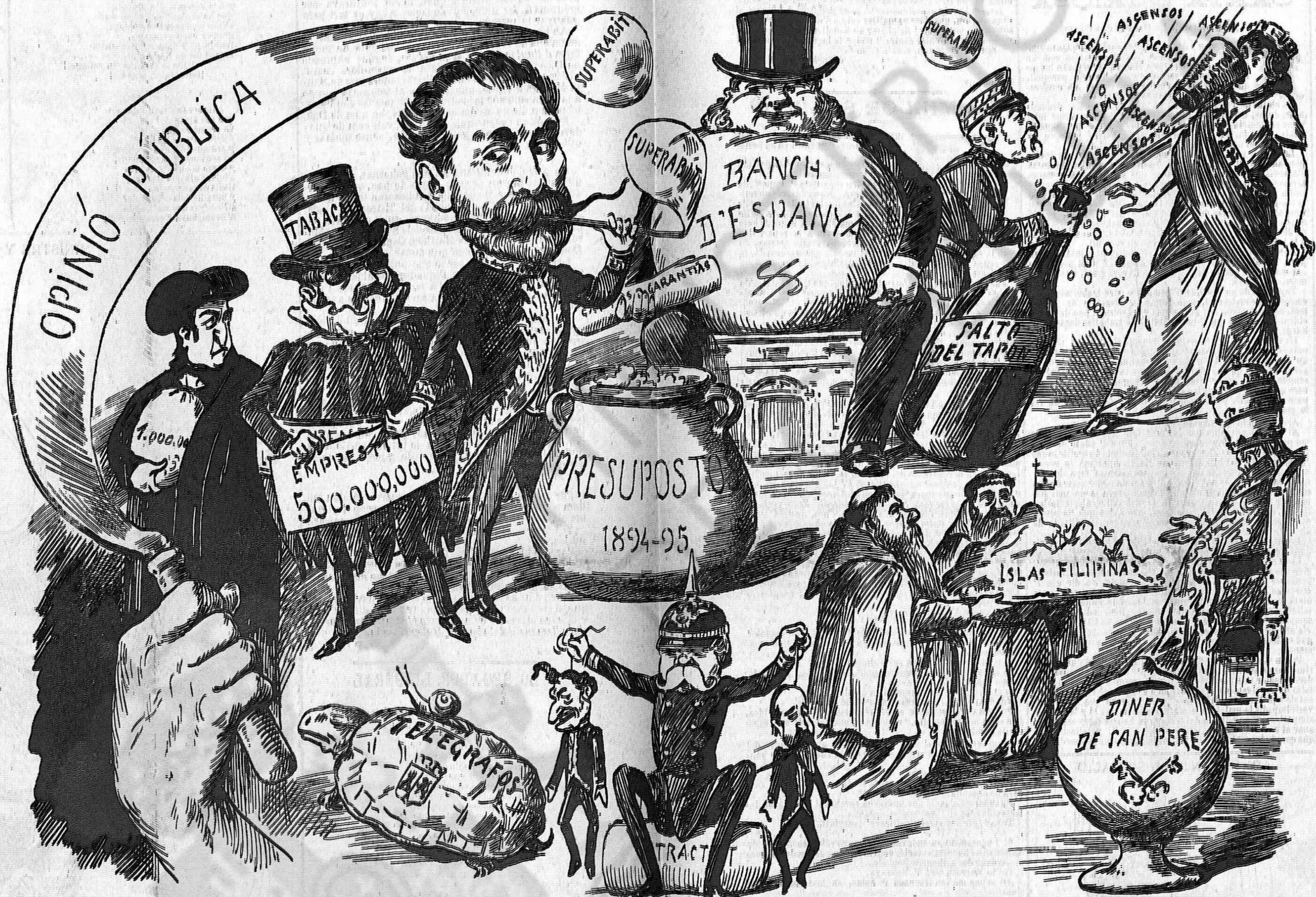
Lo país no anirà bé ni farà may res de bo