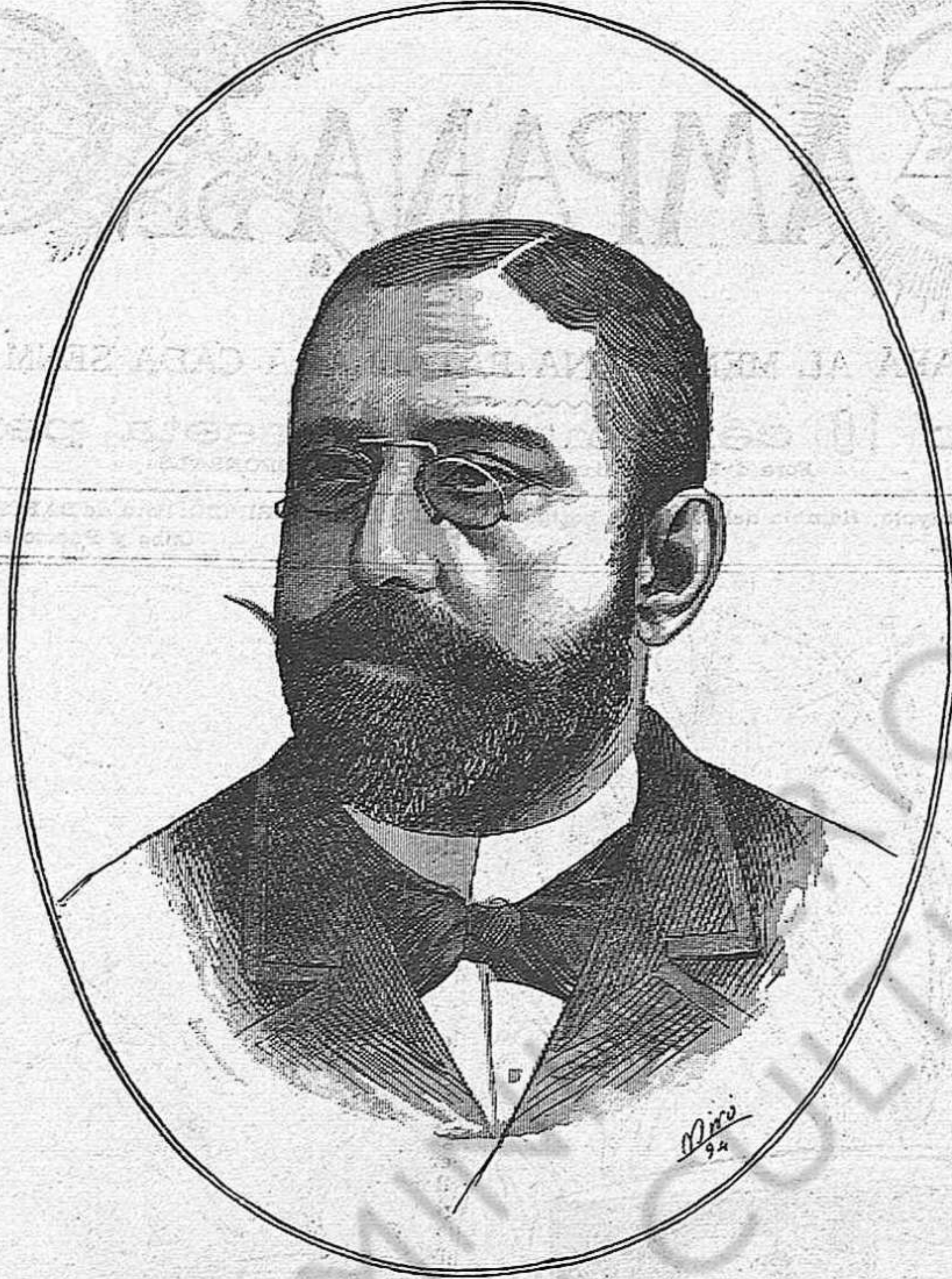
EXCM. SR. D. RAMON LARROCA GOBERNADOR CIVIL DE LA PROVINCIA DE BARCELONA

Y no obstant, en la llibertat, y sols en la llibertat contra la qual tiran los séus eternals enemichs, se troba l' únich remey racional aplicable á todas las dolencias sociales. Res hi fá que molts no 's dongan compte de la séva eficacia. També hi ha qui viu y no 's dona compte que deu l' existencia al aire que respira. Es precis, sobre tot, inculcar á las classes obreras la idea justa de que la llibertat es l' únich element en que poden viure y aspirar á la séva millora real y efectiva: la llibertat permet l' exposició de todas las ideas, la controversia de tots los principis, la depuració de todas las aspiracions; per la llibertat se progressa: per