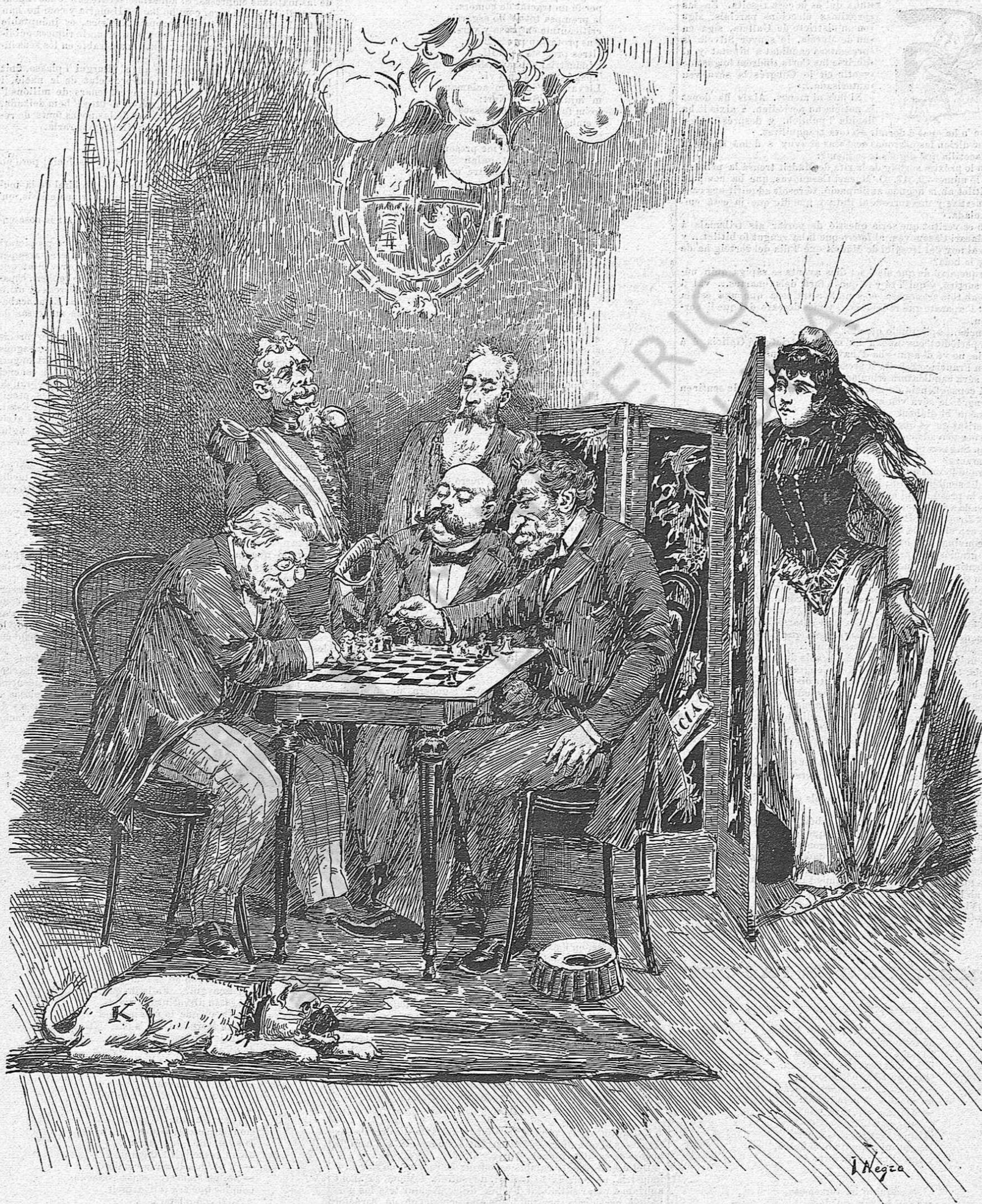
Aquesta gent que jugan ab tot, y principalment ab lo país, un dia ó altre donarán mate , y llavoras será ocasió de que la República, que no está per jochs, guanyi la partida.