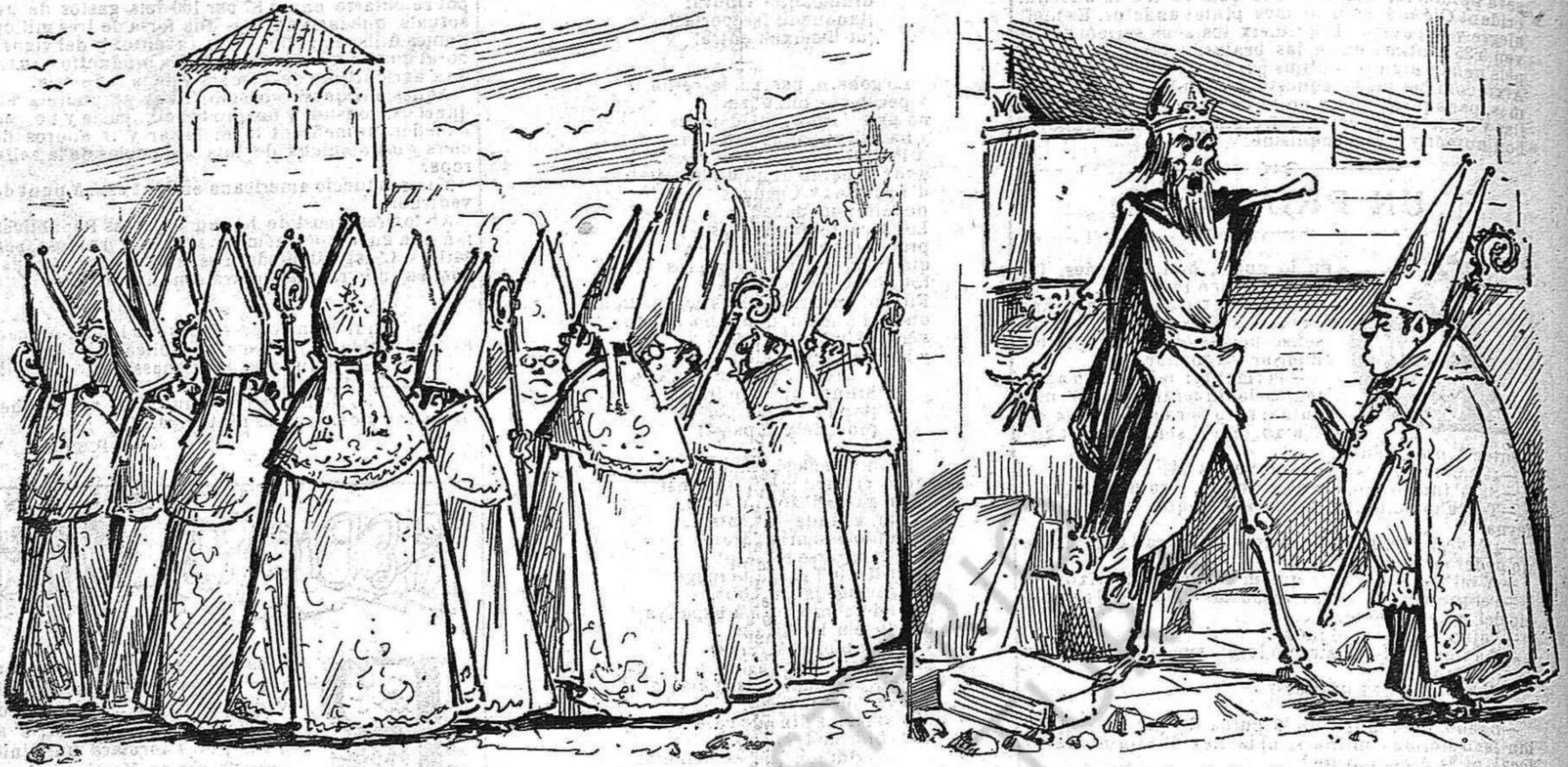
Lo Monastir es bisanti; pero las festas serán góticas porque acabarán en punta.