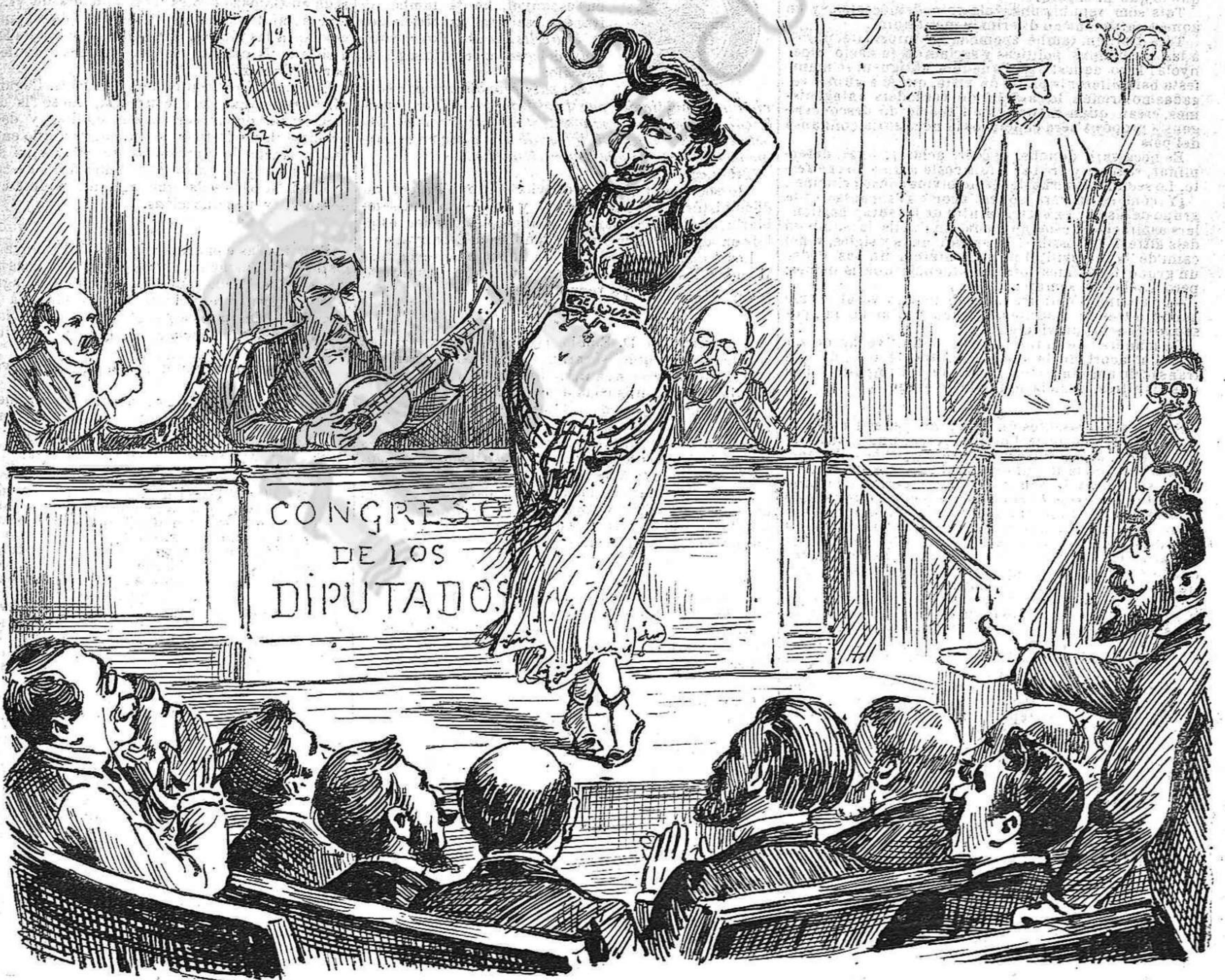
El Feo Chiquito ballará cada día la danza del ventre.

Remey segur porque 'ls diputats, ab la calor no se 'n hi vajan